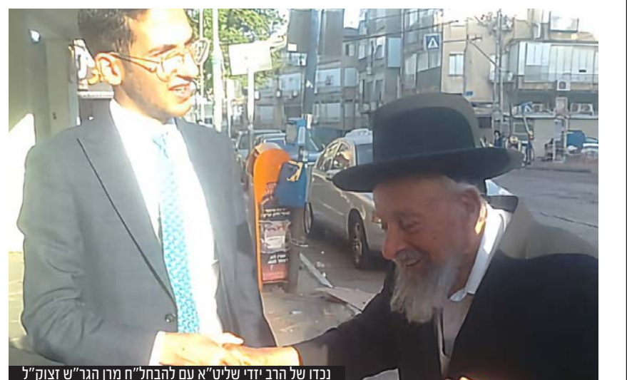
נכדו של הרב יזדי שליט"א עם להבח"ח מרן הגר"ש זצוק"ל