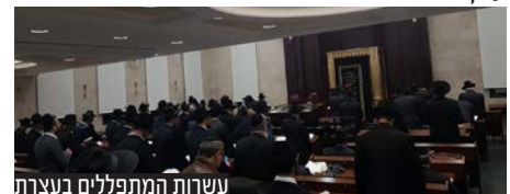
עשרות המתפללים בעצרת