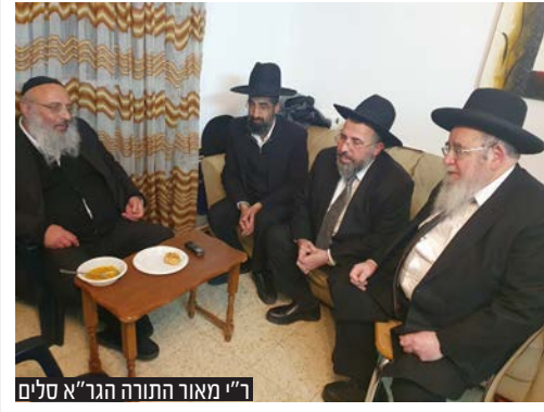
ר"י מאור התורה הגר"א סליים