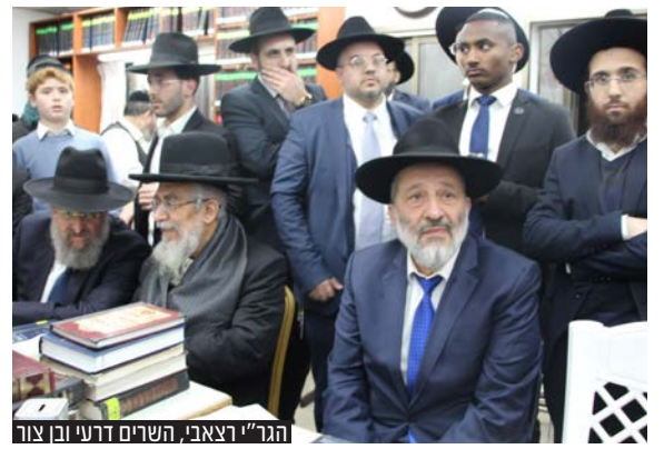
הגר"ר רצאבי, השרים דרעי וכו' צור