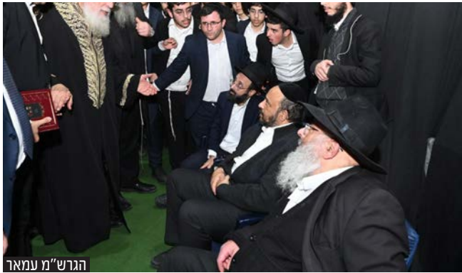
הגר"ש מ' עמאר

מראות ניחום אבלים אצל בני מרן הגר"ש בעדני זצ"ל