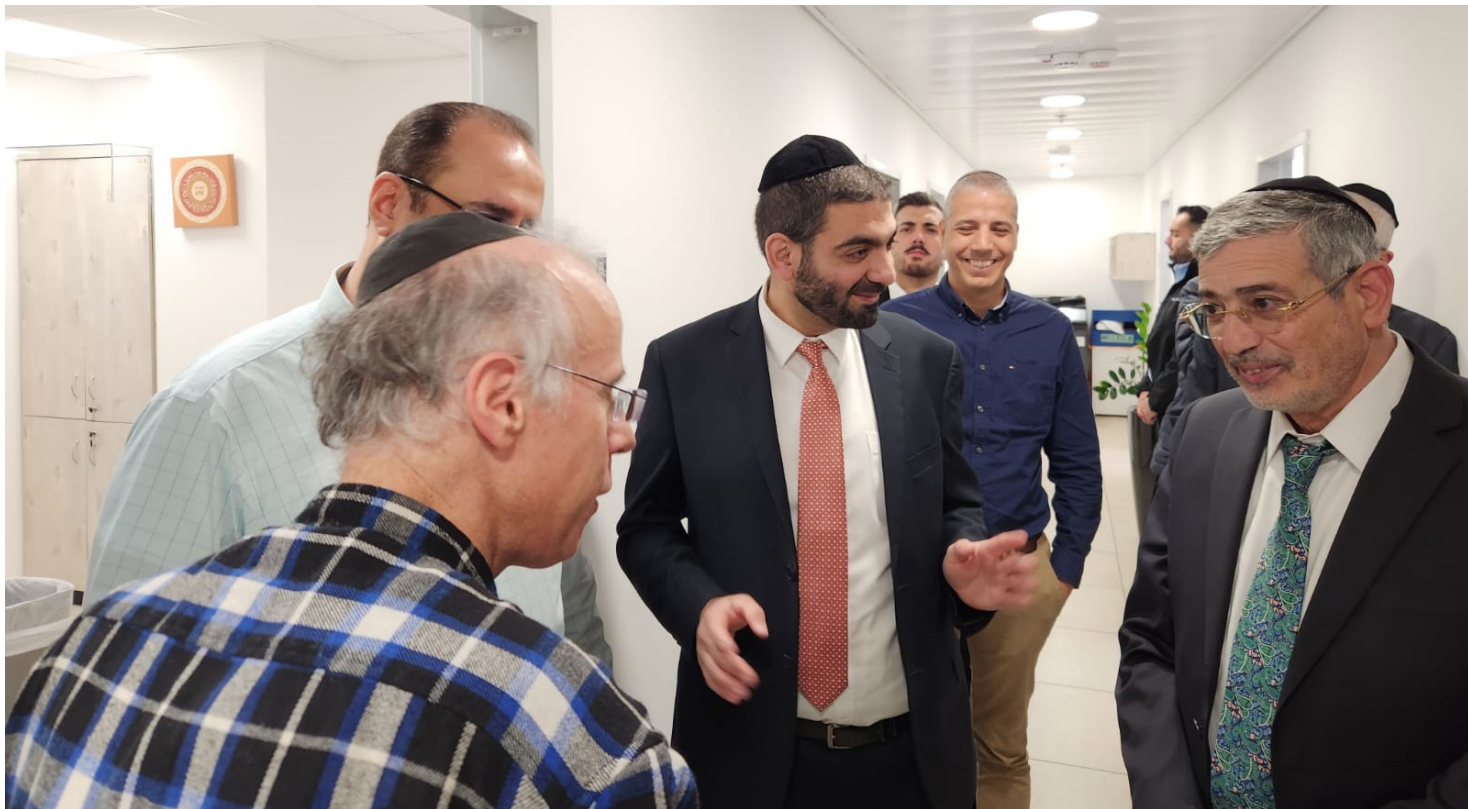
מהפנה במשרד הדתות, השר והמנכ"ל בסיור מקצועי