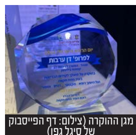
מגן ההוקרה

הציבורים מורסו והמקצועי ודתו מיוחדת לכל הרופאים והרופאות העובדים בפתח תקווה בה יש את מרכזי הרפואה המובילים והטובים בארץ."