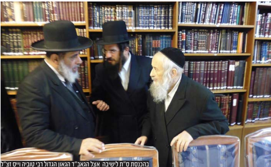
בהכנסת ס"ת לשיבה אצל הגאון ד"ר הגאון הגדול רבי טוביה וייס זצ"ל