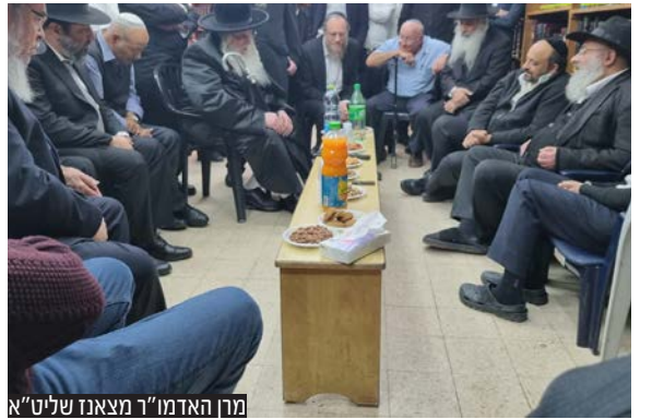
מרן האדמו"ר מצאנז שליט"א