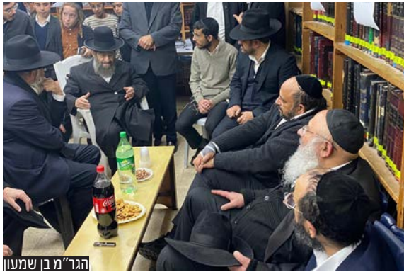
הגר"מ בן שמעון