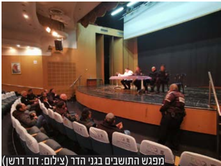
מפגש התושבים בגני הדר

ביום שני התקיים מפגש תושבים עם בכירי משטרת פתח תקווה ובהשתתפות ראש העיר מר רמי גרינברג