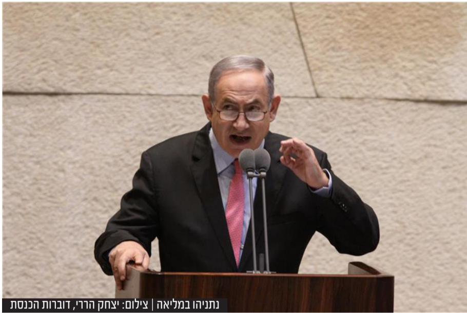
נתניהו במליאה

בתום שבוע מתוח בתוך יהדות התורה ורק לאחר ששר השיכון המיועד יצחק גולדקנופף הודיע כי הוא מוותר על חברותו בקבינט המדיני-ביטחוני, חתמה דגל התורה על ההסכם הקואליציוני. ביום חמישי צפוי נתניהו להשביע את ממשלתו השישית, לאחר שהסתיים בליץ החקיקה שדרשו דרעי, סמוטריץ' וכן גביר. בג"צ דחה את העתירה שביקשה למנוע את מינויו של דרעי לשר בטענה "שהעתירה הקדימה את זמנה"