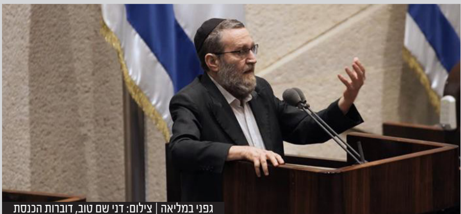
גפני במליאה | צילום: דני שם טוב, דוברות הכנסת

לדברי ח"כ משה גפני בפתח ישיבת ועדת הכספים: "אני אומר לכל הכתבים והפוליטיקאים, אנחנו לא מפחדים מכם. שנה וחצי שתקתם כי חשבתם שאלך איתכם, קיבלתי תדמית שאלך עם לפיד וגנץ, לא הלכתי איתכם ועכשיו הגיעה שעת הנקמה בנו"