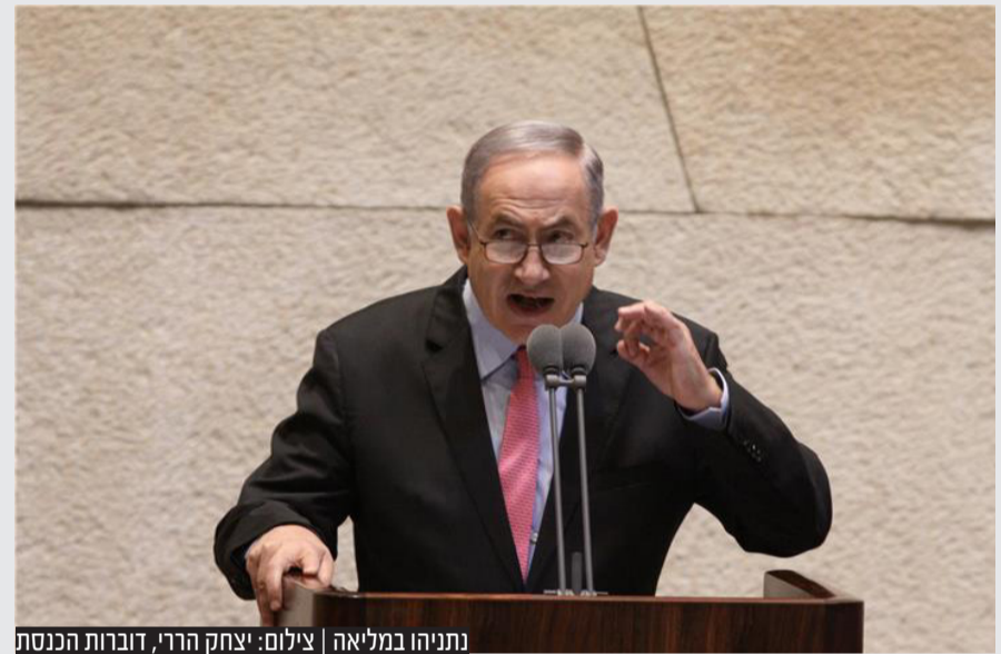
נתניהו במליאה

בתום שבוע מתוח בתוך יהדות התורה ורק לאחר ששר השיכון המיועד יצחק גולדקנופף הודיע כי הוא מוותר על חברותו בקבינט המדיני-ביטחוני, חתמה דגל התורה על ההסכם הקואליציוני. ביום חמישי צפוי נתניהו להשביע את משלתו השישית, לאחר שהסתיים בליץ החקיקה שדרשו דרעי, סמוטריץ' ובן גביר. בג"צ דחה את העתירה שביקשה למנוע את מינויו של דרעי לשר בטענה "שהעתירה הקדימה את זמנה" | עמ' 10