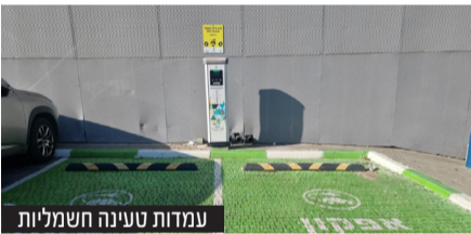
נמדודת טעינה חשמליות

תקציב החברה לשנת 2023 בסך 448 מלש"ח, למעלה מפי שניים מתקציב החברה לשנת 2022 ומהווה גידול של פי 4 בחמש שנים