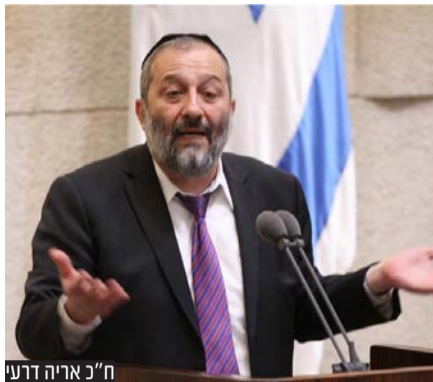
ח"כ אריה דרעי

ח"כ משה ארבל הניח על שולחן הכנסת הצעת חוק שמטרתה להכשיר את יו"ר ש"ס אריה דרעי לכהן כשר בממשלה. בהצעה ח"כ נכתב: "בית המשפט, לרבות בית המשפט העליון בשבתו כנגד", לא מוסמך לקיים ביקורת שיפוטית על מינויים של שרים וזהותם מכל עילה שהיא, למעט לעניין תנאי הכשירות שקבע המכון"