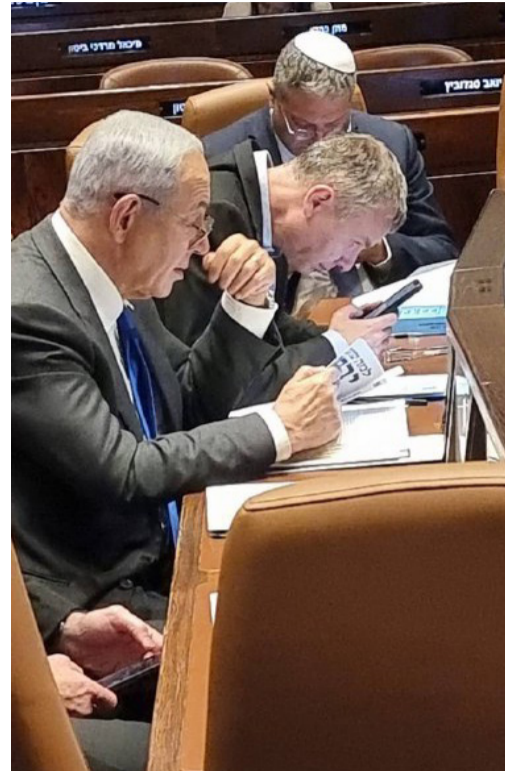
ראה"מ קורא את ספרו של ח"כ רוטמן