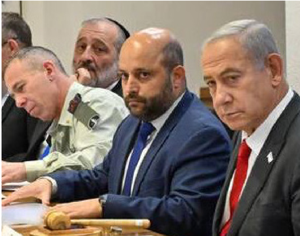
כינוס חירום של הקבינט, עם דרעי