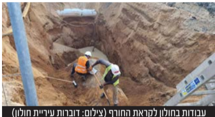
עבודות בחולון לקראת החורף

עיריית חולון ערוכה לטפל באירועי מזג האוויר • בין הפעולות שנקטו: העמדת צוותים מקצועיים, כלים ומשאבות בכוננות - להפעלה בעת הצורך