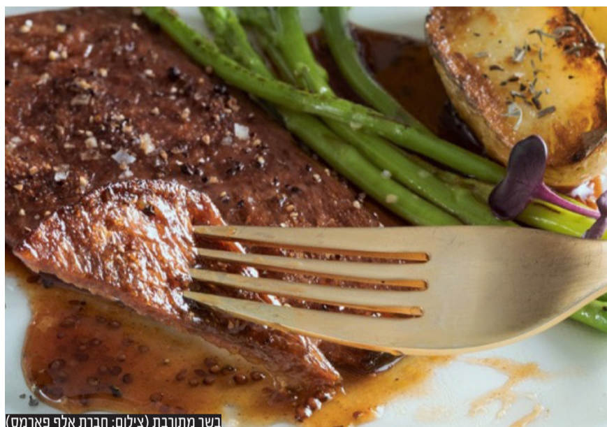
בשר מתורבת