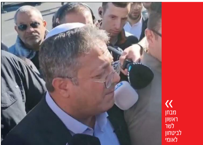
מבחן ראשון לשר לביטחון לאומי

איטום בית המחבל איננו באמת צעד מרתיע יתר על המידה. לא מדובר בהרס הבית, וספק אם משפחת המחבל תיאלץ לישון על ספסלים ברחוב. ובכל זאת, צודק בן גביר - הן בהתעקשותו והן בזעמו. טרור איננו מדיד בהכרח, לא כל צעד במאבק נגדו נספר בהרואים או בחודשי מאסר. בעיקרו, טרור הוא מאבק פסיכולוגי בין שני צדדים, והצד השני, במקרה שלנו, בוחן את רצינותו של השר החדש ואת יכולותיו. ענישה מהירה, אפילו מינורית, מצביעה על רוח קרב ונחישות. מנגד, תהליך מגומגם ואיטי משדר חולשה וחוסר יכולת של ממש להיאבק בטרור