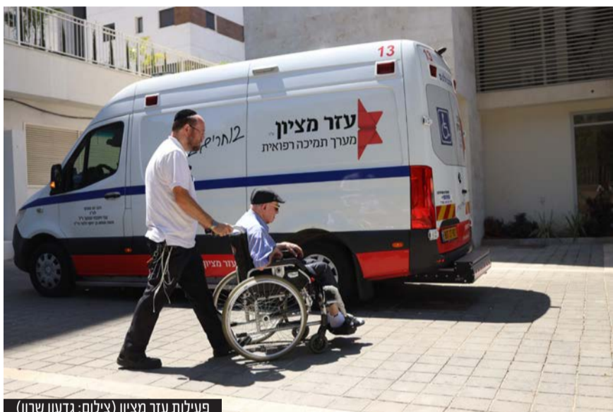
פעילות עזר מציון

התגעגעתם? המכירה הסינית של 'עזר מציון' חוזרת ובגדול: ההזדמנות החד פעמית גם להציל חיים וגם לזכות במאה אלף דולר במזומן, רכב משפחתי יוקרתי ואינספור מתנות יקרות ערך - חוזרת אלינו ובגדול!