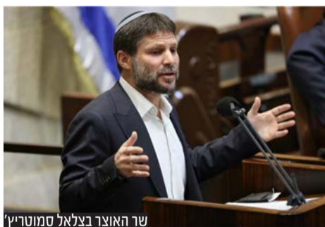
שר האוצר בצלאל סמוטריץ'

בפתח ישיבת סיעת הציננות הדתית תקף שר האוצר בצלאל סמוטריץ' את יו"ר האופוזיציה יאיר לפיד: "ראיתי אתמול סרטון שיאיר לפיד פירסם במיוחד, שהמסקנה שלו היא שצריך להוציא השקעות ממדינת ישראל ולהעביר לסינגפור. אני רוצה לפנות אליך יאיר, אתה ראש ממשלה ושר אוצר לשעבר, מה קרה לך? אין לך טיפת אחריות?"