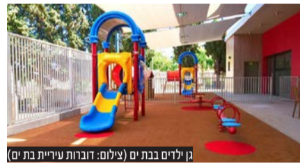
גן ילדים בבת-ים

מנת לספק להורים ודאות על שיבוץ ילדיהם מוקדם ככל הניתן. התהליך שנבנה בכוחות משותפים של מספר גורמים עירוניים יוביל לשיפור משמעותי במהירות, ביעילות ובחויית השירות שאותה אנו מספקים להורים תושבי העיר בחוויית הרישום.