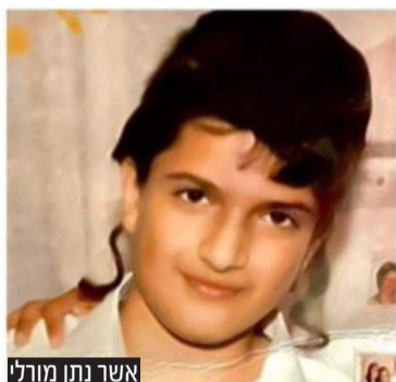
אשר נתן מורדכי