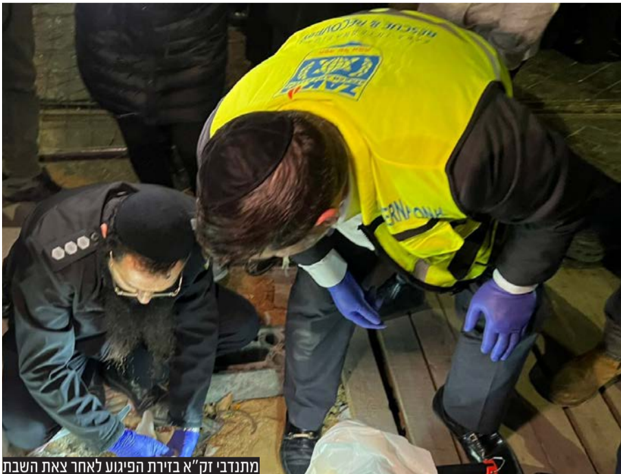
מתנדבי זק"א בזירת הפיגוע לאחר צאת השבת