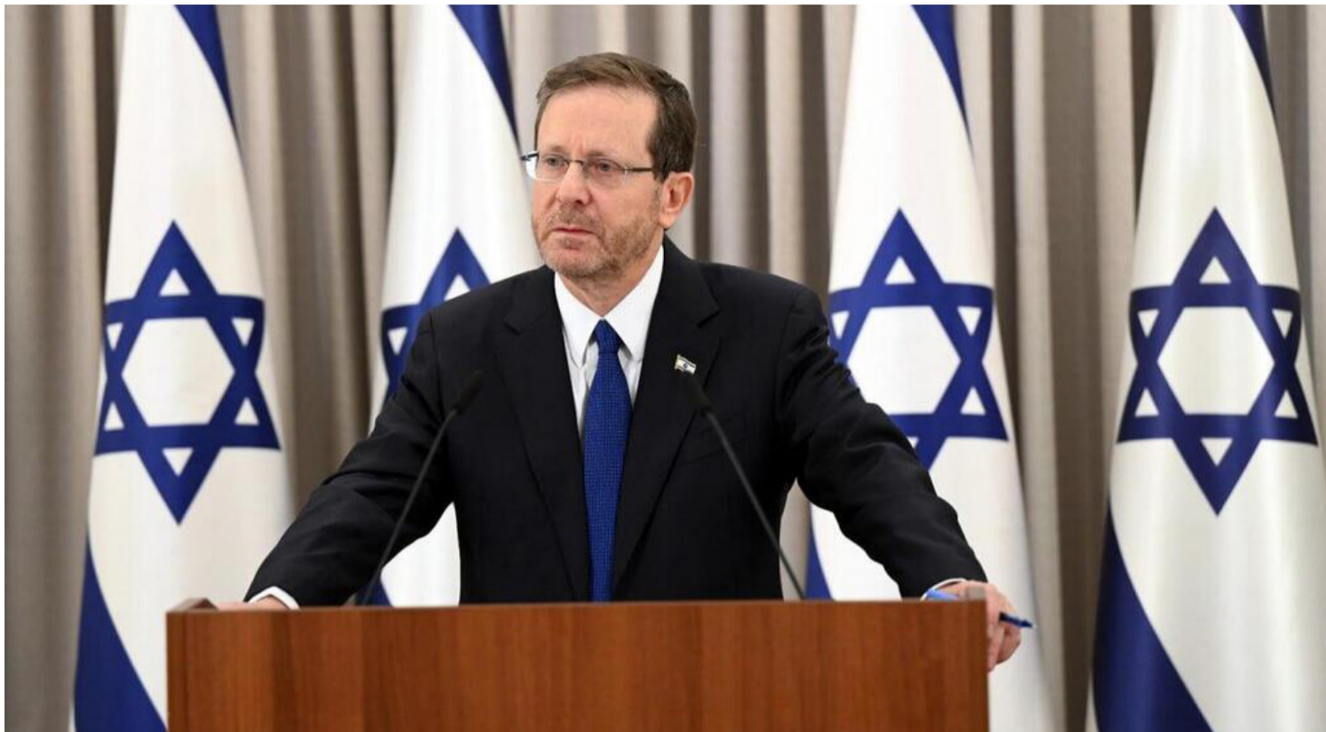
טקטיקה של מתנגדים, אסטרטגיה של תומכים. הנשיא הרצוג מציג את המתווה

הרפורמה, התנהג בממלכתיות הנדרשת וקיים את התהליך בשלמותו, כשהוא מסיים את השלב הראשון מבחינתו ומגלגל את הכדור לפתחה של הכנסת. במקביל, הודיע שר המשפטים - במה שמתפרש כמחווה של רצון טוב לבקשת הנשיא - כי ההצבעה בקריאה ראשונה במליאה תתקיים ביום שני הבא, ולא ביום רביעי השבוע כפי שנשקל מלכתחילה.