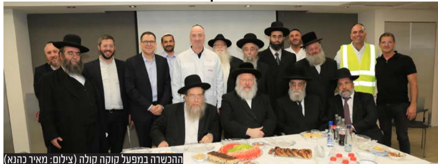
הכשרה במפעל קוקה קולה

בשבוע האחרון נערכה הכשרת המפעל בבני ברק במעמד מיוחד וחגיגי בהשתתפות הרה"ג יצחק לנדא והרה"ג שבח רוזנבלט, רבני העיר בני ברק, הרב יעקב רוז'ה רב העיר בת ים והרב האחראי על מחלקת הכשרות ברבנות ת"א