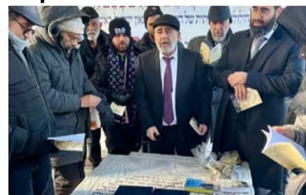
מאת: יוסף טולידנו

ההמונית סיפר בהתפעלות שמשנה לשנה יותר ויותר אנשים מגיעים לפקוד את ציונו של הצדיק, גם בשאר ימות השנה, וזו הסיבה שאירגנו השנה שידור ישיר מהמקום לאלו שלא התאפשר להם להגיע, כדי להעביר את המעמד הנשגב לארץ. לקהילות באירופה, בארצות הברית ובדרום אמריקה, שהתרגשו מאוד והעבירו בקשות וברכות לתפילה.