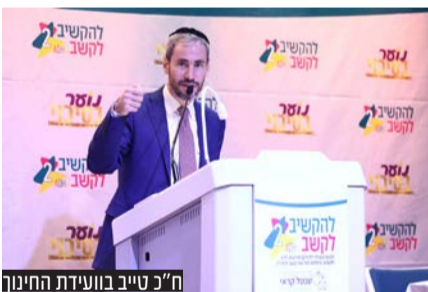
ח"כ טייב בועידת הנוער

באופן חריג, יו"ר הועדה ח"כ יוסי טייב יכנס את ועדת החינוך במסגרת ועידת 'נוער בסיכו 4', העוסקת בסוגיות של התמודדות עם נוער בסיכון • טייב: "חינוך נוער נמצא בראש סדר העדיפויות מבחינתי בכל פעילותי הציבורית"