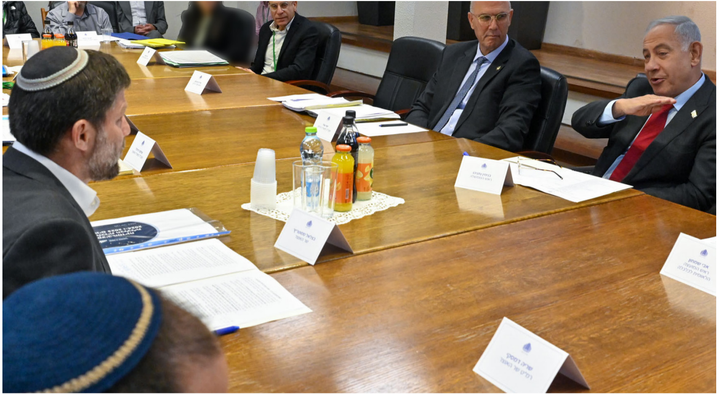
הקרב על התקציב נפתח בעימות בישיבת הממשלה | צילום: קובי גדעון, לע"מ

אגף התקציבים, איש איש והכוח הפוליטי שהוא מחזיק ביד.