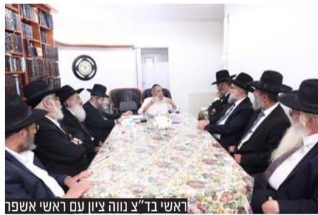
ראשי ב"צ מוה ציון עם ראשי אשפר