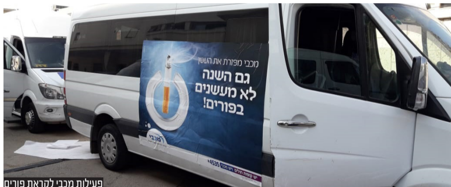
פעילות מכבי לקראת פורים

לקראת פורים, מכבי מזכירה לכל הצעירים: אל תיפלו במלכודת - הימנעו מעישון בפורים ובכל ימות השנה