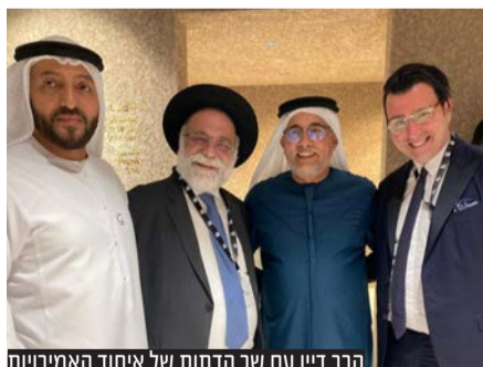
הרב דין עם שר הדתות של איחוד האמירויות