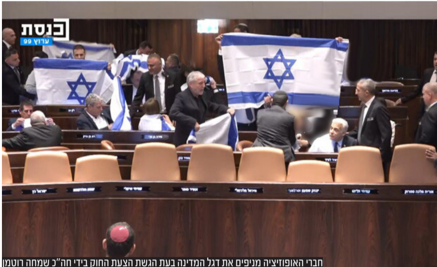
חברי האופוזיציה מניפים את דגל המדינה בעת הגשת הצעת החוק בידי ח"כ שמחה רוטמן

השלב הראשון ברפורמה המשפטית של יריב לוין ולפיו בג"צ לא יוכל לפסול חוק יסוד והרכב הוועדה לבחירת שופטים תשתנה, אושר בקריאה ראשונה בתמיכה של 63 חברי כנסת אל מול 47 שהתנגדו • רוטמן: "בית המשפט העליון פגע במעמדה של הרשות השופטת וזה מה שעומד בלב התיקונים שעולים במליאת הכנסת היום" • שר המשפטים יריב לוין: הלילה הזה זוקפים את קומתם המונית אזרחים", אך יחד עם זאת הציע לקיים הידברות: "אני רוצה להושיט יד, כדי שאולי סוף סוף נקיים באמת הידברות. נקיים שיח, ננסה לפחות, בלי תנאים, מתוך כוונה להגיע להסכמות ולא למנוע את החקיקה"