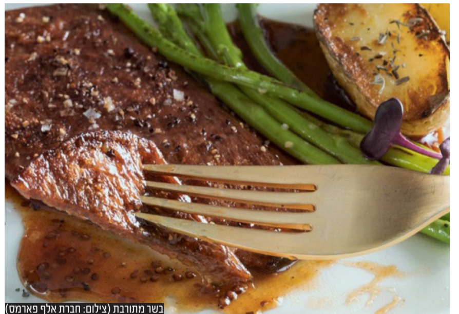
בשר מתורבת