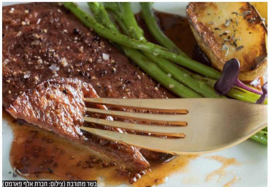
בשר מתורבת