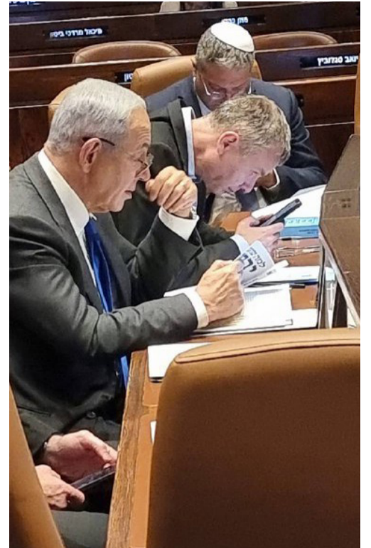
ראה"מ קורא את ספרו של ח"כ רוטמן