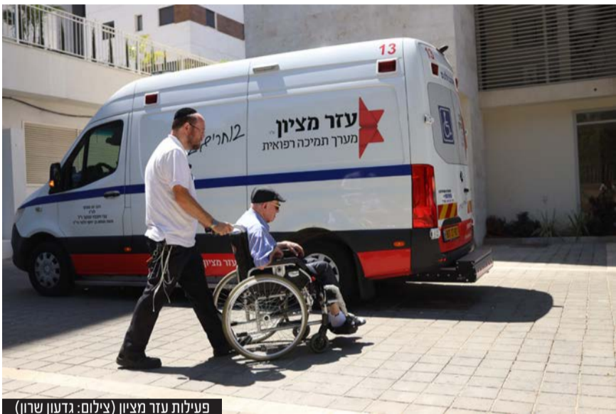
פעילות עזר מציון

התגעגעתם? המכירה הסינית של 'עזר מציון' חוזרת ובגדול: ההזדמנות החד פעמית גם להציל חיים וגם לזכות במאה אלף דולר במזומן, רכב משפחתי יוקרתי ואינספור מתנות יקרות ערך - חוזרת אלינו ובגדול!