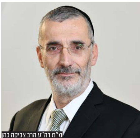
מ"מ רה"ע הרב צביקה כהן

השכונות והקהילות בירושלים שהודו לסגן ומ"מ ראש העיר הרב צביקה כהן, על היוזמות הברוכות למען לומדי התורה ומשפחות בני התורה.