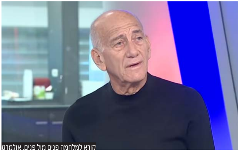
הואיל למלחמה הפנים מול הפנים. אולמרט