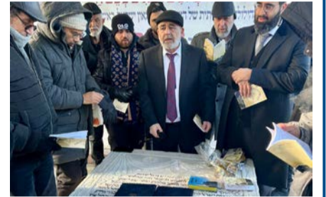
מאת: יוסף טולידנו

ההמונית סיפר בהתפעלות שמשנה לשנה יותר ויותר אנשים מגיעים לפקוד את ציונו של הצדיק, גם בשאר ימות השנה, וזו הסיבה שאירגנו השנה שידור ישיר מהמקום לאלו שלא התאפשר להם להגיע, כדי להעביר את המעמד הנשגב לארץ. לקהילות באירופה, בארצות הברית ובדרום אמריקה, שהתרגשו מאוד והעבירו בקשות וברכות לתפילה.