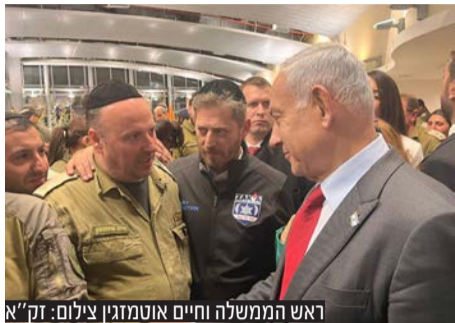
ראש הממשלה חיים אטמזגין

נגיע עד קצה העולם למען הצלת חיים וכבוד המת" • בתום שישה ימי פעילות מתנדבי זק"א במשלחת החילוץ של מדינת ישראל לאסון רעידת האדמה בטורקיה שבו השבוע לישראל