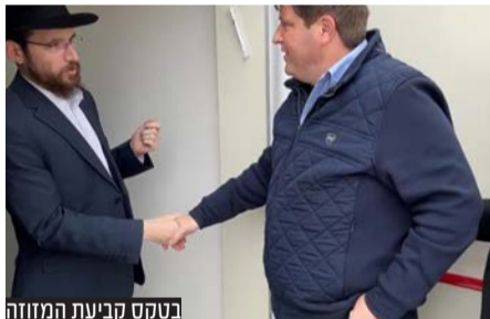
בטקס קביעת המזונה