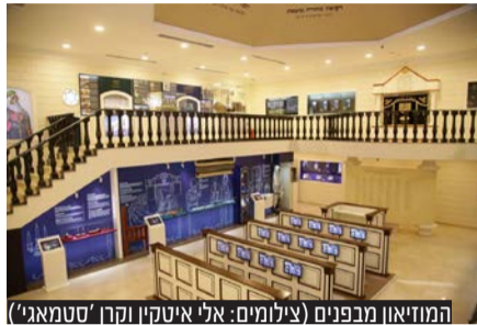
המוזיאון מבפנים