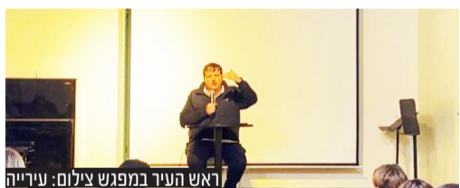
ראש העיר במפגש