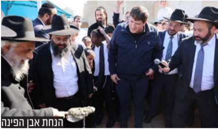
הנחת אבן הפינה

הנחת אבן הפינה לתלמוד תורה 'נטיעים' בהשתתפות רבנים, ראש העיר ואישי ציבור