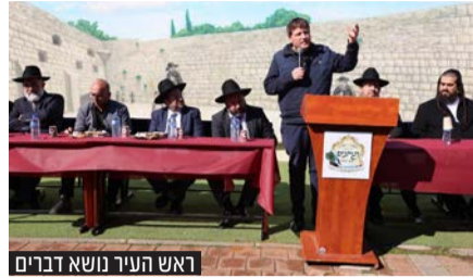
ראש העיר נושא דברים