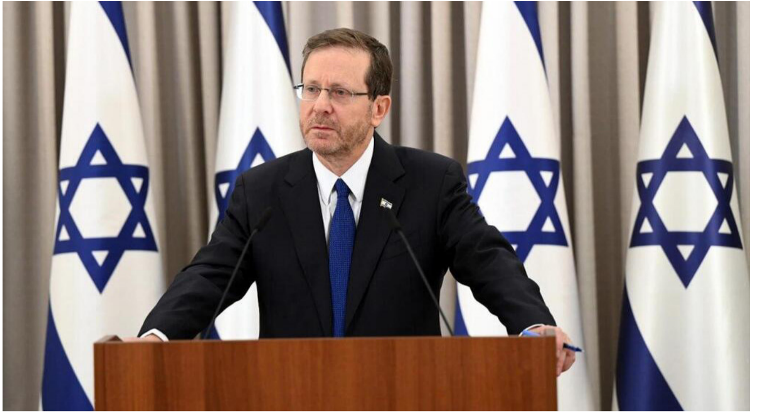
טקטיקה של מתנגדים, אסטרטגיה של תומכים. הנשיא הרצוג מציג את המתווה

הרפורמה, התנהג בממלכתיות הנדרשת וקיים את התהליך בשלמותו, כשהוא מסיים את השלב הראשון מבחינתו ומגלגל את הכדור לפתחה של הכנסת. במקביל, הודיע שר המשפטים - במה שמתפרש כמחווה של רצון טוב לבקשת הנשיא - כי ההצבעה בקריאה ראשונה במליאה תתקיים ביום שני הבא, ולא ביום רביעי השבוע כפי שנשקל מלכתחילה.