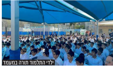
ילדי התלמוד תורה במעמד