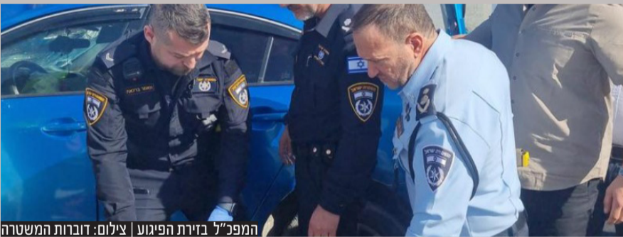
המפכ"ל בזירת הפיגוע