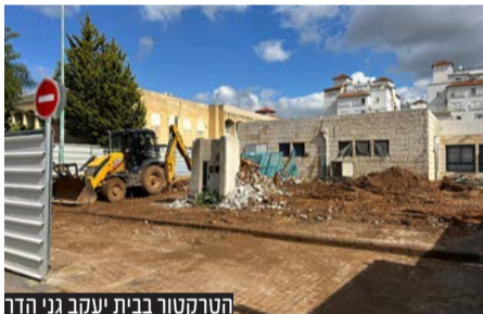
הטרקטור בבית יעקב גני הדר