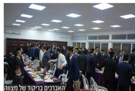
האברכים בריקוד של מצווה

במוצאי שבת האחרונה, התקיים ערב גיבוש והוקרה לחברי קהילת בני תורה בהשתתפות רבנים ואישי ציבור