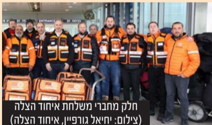
חלק מחברי משלחת איחוד הצלה

משלחת סיוע של איחוד הצלה עם למעלה מ-10 טון ציוד ו-30 אנשי רפואה וחילוץ המריאה לטורקיה