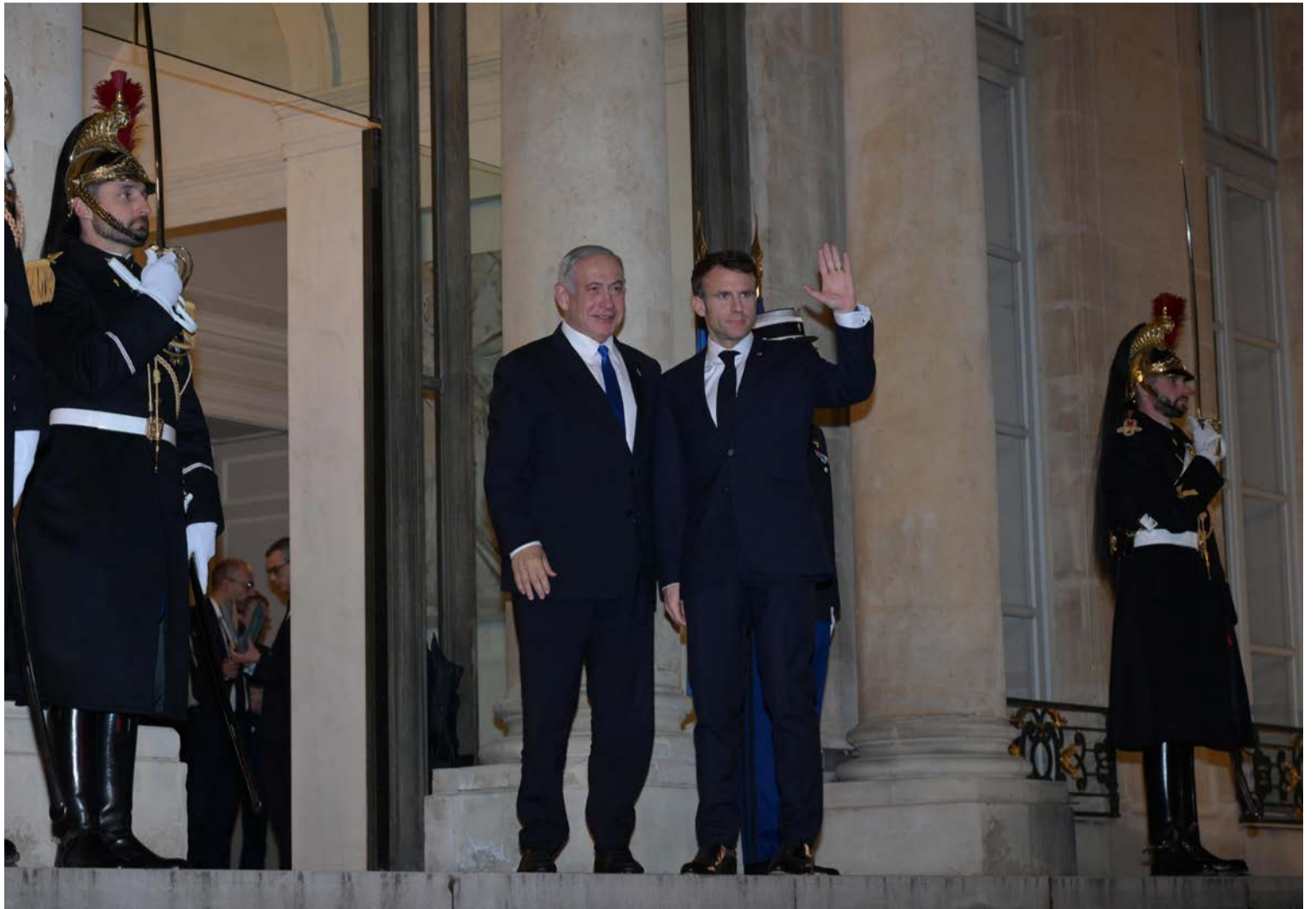
נמלט מההסתה? נתניהו בפריז עם הנשיא מקרון

» הסיבה המרכזית היא רצונו של גנץ לבדל את עצמו מלפיד, כפי שניסה לעשות בחוסר הצלחה לפני הבחירות, ולמצב את עצמו כמי שמסוגל ליצור איחוד פוליטי ולהגיע להסכמות גם עם האגף הימני ועם החרדים, מתוך הבנה שבעתיד הנראה לעין לא ניתן להגיע לראשות הממשלה בלי תמיכה מחוגי הימין. רוטמן ולוין, מצדם, ישלמו בשמחה אי אלו ויתורים על עיזים שהוכנסו מלכתחילה לצורך כך, כדי להשיג 'הסכמה ציבורית רחבה' לרפורמה, עיזים שגנץ יוכל לנפנף בהם בפומבי ולספר על ההישגים שהשיג ועל היותו גורם ממתן ברפורמה.