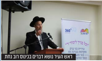
ראש העיר נושא דברים בכינוס רוב נחת