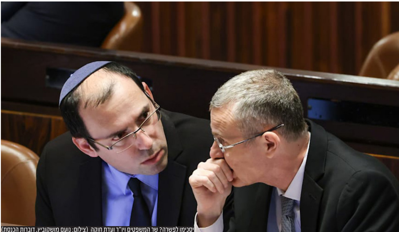
יסקימו לפשרה? שר המשפטים ויו"ר ועדת חוקה

כבר מס' שבועות שלצד הפגנות המחאה ההמוניות וההצהרות החוזרות ונשנות של שר המשפטים יריב לוין ויו"ר ועדת החוקה ח"כ שמחה רוטמן שתהליך החקיקה לא ייעצר אפילו לדקה, מאחורי הקלעים מתנהלים מגעים אינטנסיביים להם שותפים נציגים מהקואליציה ומהאופוזיציה, ובמקביל, בכירי עולם הייטק ומשפטנים בכירים השותפים אף הם לניסיונות להגיע לפשרה מוסכמת. את עיקר המאמצים מוביל בחודש האחרון נשיא המדינה יצחק הרצוג. כבר לפני למעלה מחודש הניח הנשיא הרצוג את המתווה הראשוני. אלא שבשני הצדדים התבצרו בעמדות המוצא - בקואליציה דרשו מו"מ תוך כדי החקיקה, באופוזיציה דרשו עצירת החקיקה ורק אז כניסה למשא ומתן. במהלך השבועות שחלפו נפגש נשיא המדינה עם לא מעט מבכירי הקואליציה והאופוזיציה, אך לא הצליח לכנס את שני הצדדים לחדר אחד. בתווך, נפגש הנשיא עם למעלה ממאה ראשי רשויות שביקשו את התערבות הנשיא להורדת מפלס הלהבות, אולם גם קריאה זו טרם נפלה על אוזניים קשובות.