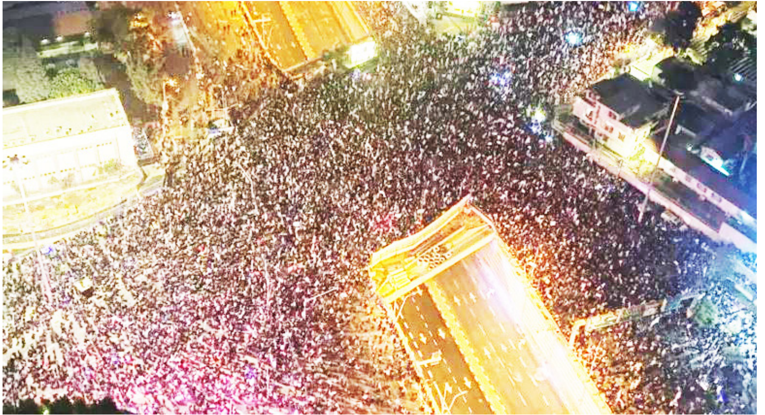
מעבר לשלב ההתמקחות? מפגיני המחאה נגד הרפורמה

» ”אי אפשר להבין את ההתנהלות של נתניהו”, זועמים במפלגה, “דגל התורה היא באמת המפלגה הכי חלקה מבחינתו, הכי ישרה, בלי משחקים, כל החברים פעילים מאוד בועדות הכנסת לטובת האינטרסים של הקואליציה, כל תפקיד שיש להם ממלאים לשביעות רצון כולם. הדרישות שלנו לא בשמים, אנחנו המפלגה היחידה שלא לקחה תפקיד בממשלה וחסכה לו הכי הרבה בעיות בבניית הקואליציה, ומה שכבר כן הובטח - לא מקוים. למה למען השם המשחקים המיותרים האלו ואי העמידה בהסכמים?”