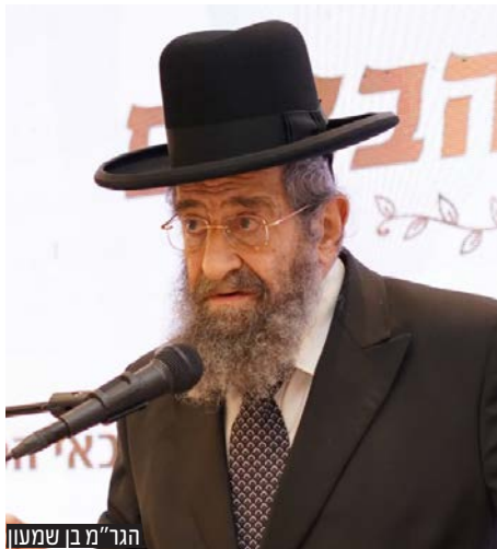
הגר"מ בן שמעון