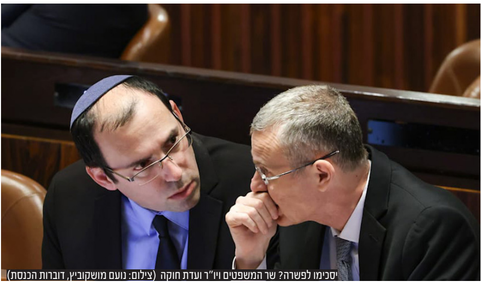
יסימינו לפשרה? שר המשפטים יו"ר ועדת חוקה

בכיר ביהדות התורה: "לא נוכל להמשיך לאורך זמן להתנהל באופן הזה. או שנתניהו והליכוד מתכוונים לקיים את ההסכם הקואליציוני, או שאנחנו לא חלק מהקואליציה. אם תהיה פשרה בנושא פסקת התגברות, לא בטוח שהאצבעות של יהדות התורה מובטחות לנתניהו". גם בש"ס מעבירים ביקורת: "החברים בליכוד צריכים לזכור שכמו שלהם יש דברים חשובים ברפורמה והם עומדים על כך, גם לנו יש דברים שאנחנו לא מוכנים להתפשר עליהם" | עמ' 20