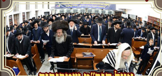
אצל הגר"מ שטרנבוך