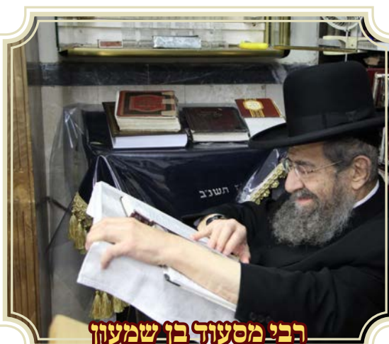
רבי מסעוד בן שמעון