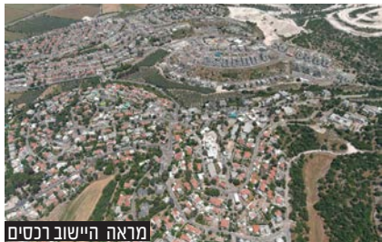
מראה היישוב ברכסים