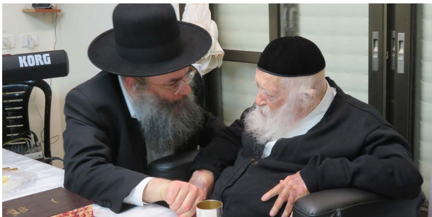
'נדרים פלוס' בחיפוש המוסד 'שיח התורה'.

החל מיום היארציית פורים דמוקפין ט"ו אדר תשפ"ג נפתחת בס"ד ב'שיח התורה' תכנית ייחודית ללימוד, להבין ולדעת הלכות שבת בשנה אחת. התכנית הייחודית ללימוד הלכות שבת ע"י 'שיח התורה' מתייחסת בהדרגתם ובהכוונתם של מרנן גדולי ההוראה שליט"א, לע"נ הרב זצוק"ל על פי רצונו בחיי חיותו, על מנת לסיים את הלכות שבת עד היארציית הבעל"ט. על פי החלטת גדולי ההוראה שליט"א הלימוד יתקיים בספר ה'משנה ברורה'