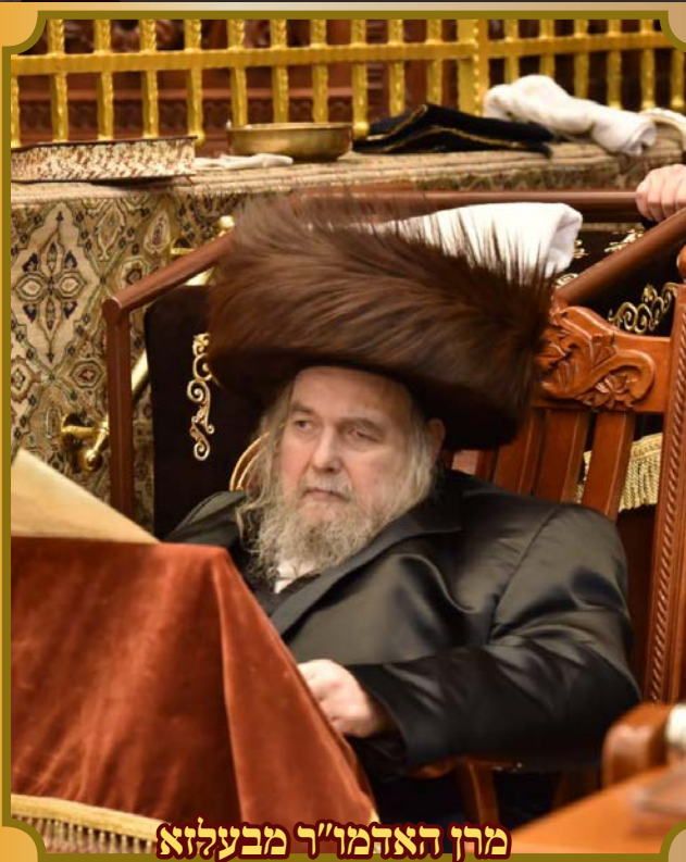
מרן האדמו"ר מבעלזא