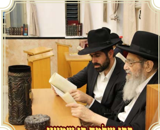
רבי שלמה בן שמעון