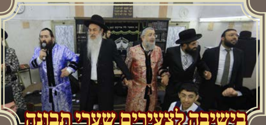
בישיבה לצעירים שערי תבונה