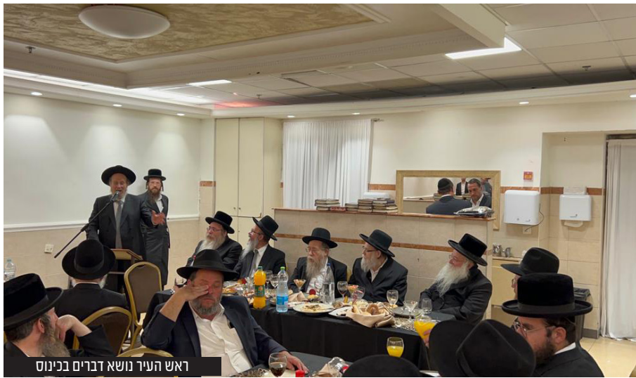
ראש העיר נושא דברים בכינוס

במעמד רבני הערים שליט"א, ראשי העיר ואנשי חסד של אמת התקיים כינוס חיזוק ליום ז' אדר של כלל העוסקים בגמילות חסד של אמת בבית העלמין החדש 'לחיים' של העיר אלעד