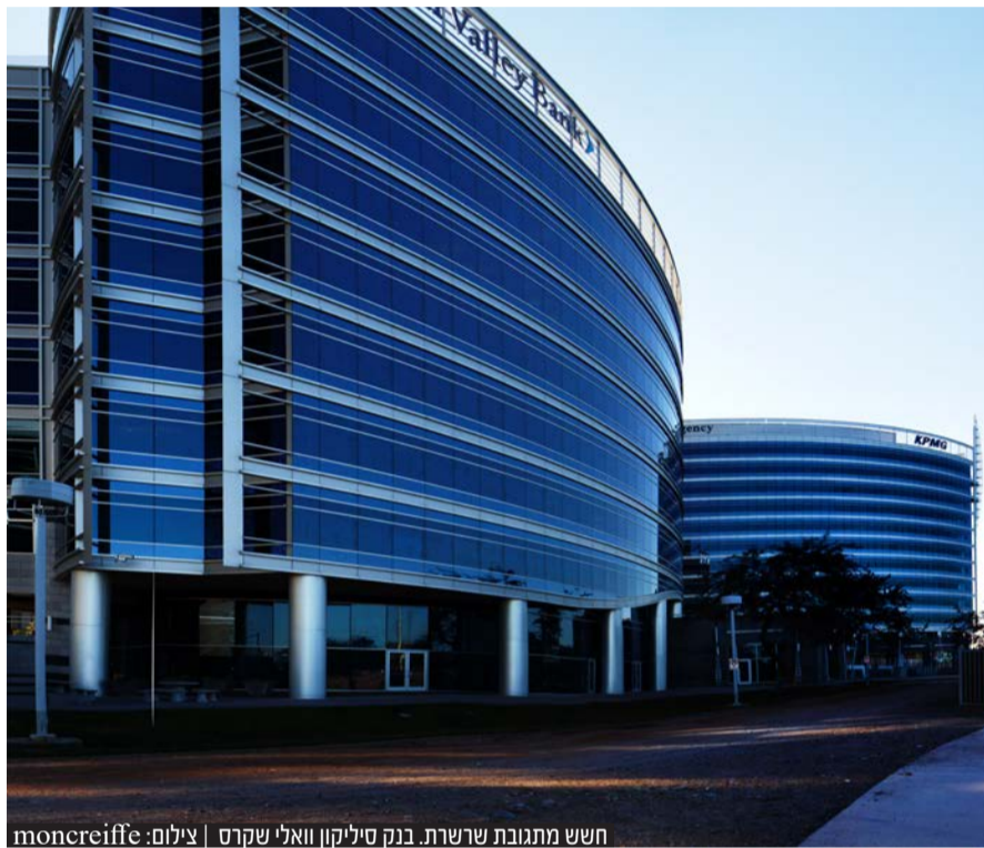
חשש מתגובת שרשרת. בנק סיליקון וואלי שקרס

החשש הגדול הוא מהעובדה שכמה מאילי ההון החרדים של ארה"ב שהחזיקו בחשבון בנק בסיליקון וואלי, עשויים לאבד חלק מכספם. אם כי הדיווח ביום שני