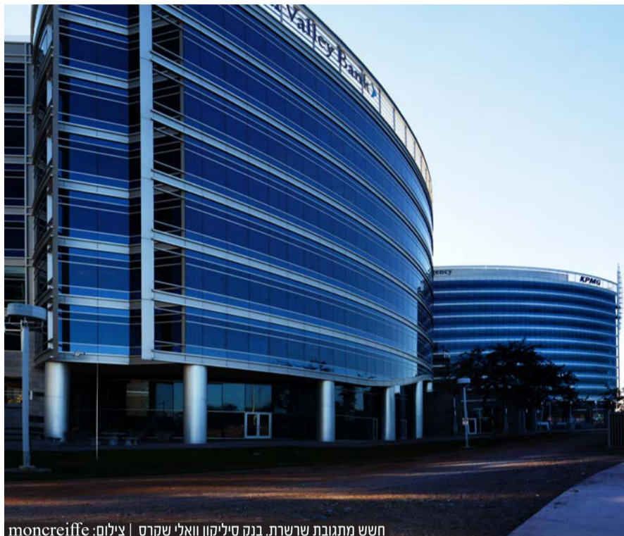
חשש מתגובת שרשרת. בנק סיליקון וואלי שקרס

החשש הגדול הוא מהעובדה שכמה מאילי ההון החרדים של ארה"ב שהחזיקו בחשבון בנק בסיליקון וואלי, עשויים לאבד חלק מכספם. אם כי הדיווח ביום שני