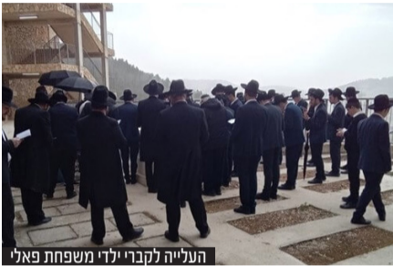
העלייה לקברי ילדי משפחת פאלי