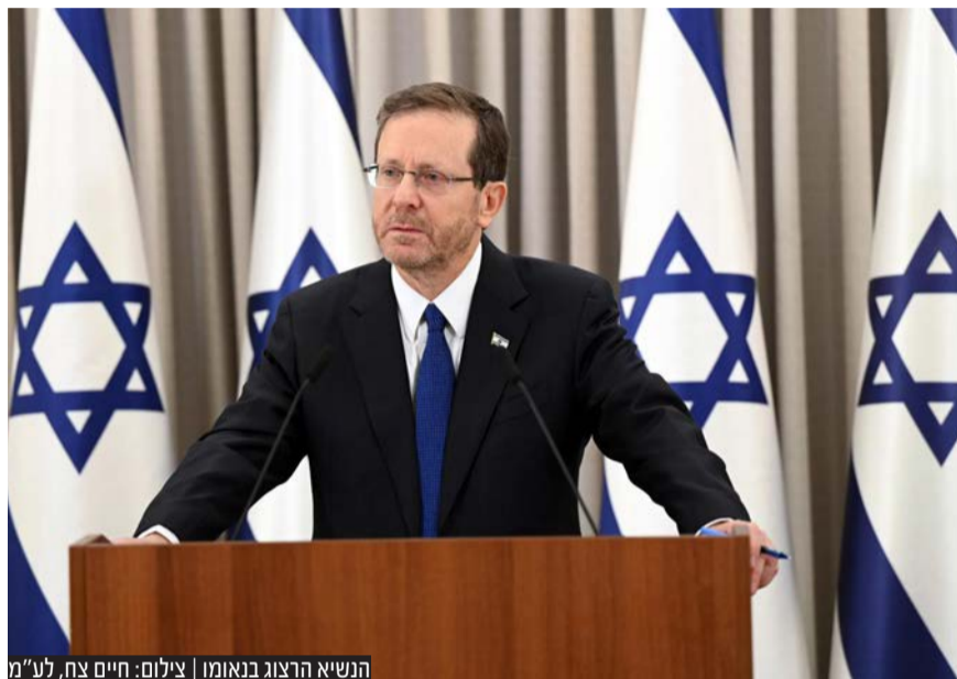
הנשיא הרצוג בנאומו

"מכלול החקיקה שנידון כעת בוועדה צריך לעבור מהעולם ומהר. הוא שגוי, הוא דורסני, הוא מערער את יסודותינו הדמוקרטיים. ולכן יש להחליפו במתווה אחר", אמר הנשיא יצחק הרצוג בנאומו אך הדגיש: "הפערים הצטמצמו מאד, יש הסכמות בנוגע לרוב הנושאים"