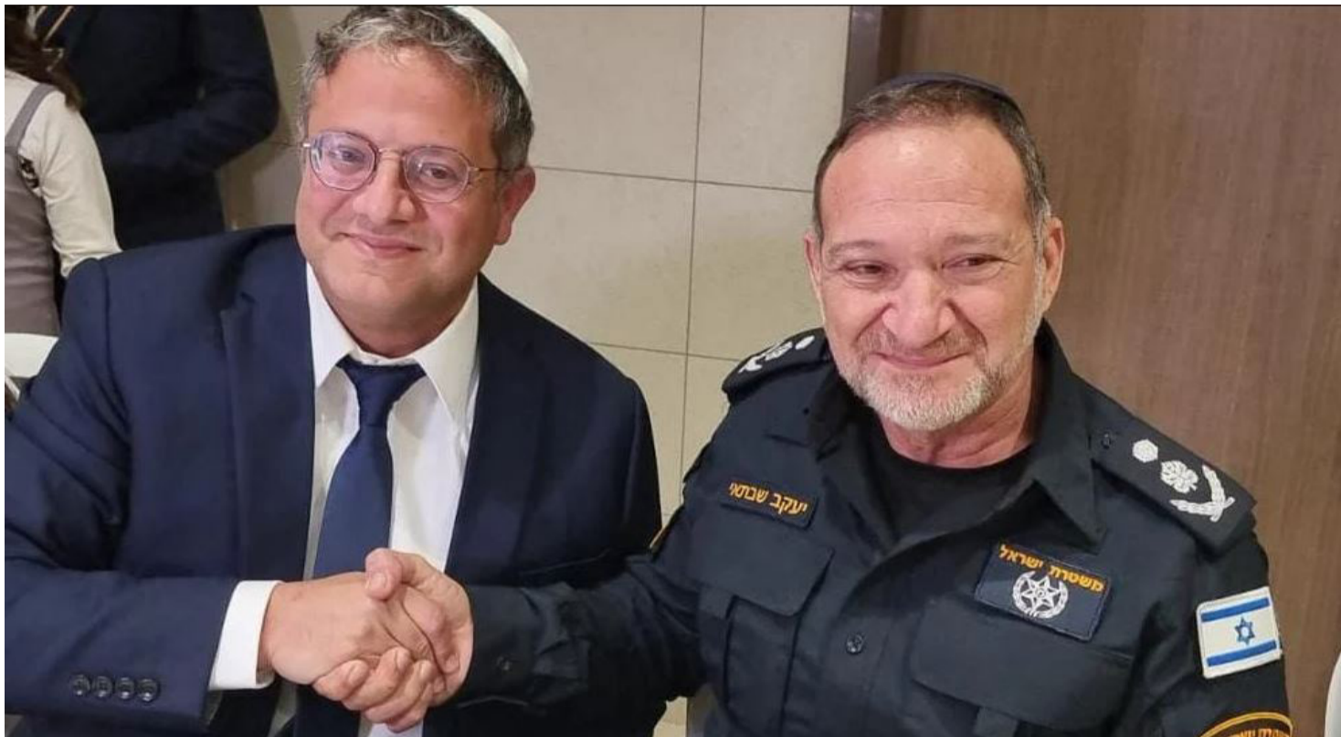
ראש בראש עם היועמ"שית, השר לביטחון לאומי בחברת המפכ"ל

כמו חוק החמץ, למשל. החלק השני והקשה יותר, הוא הסכמה על מעין חוקה יסודית, נטולת אמירות נרחבות ופתוחות לפרשנות בג"צית. חוקה רזה שתכיל אך ורק את כללי היסוד של מוסדות השלטון בישראל, ולצידם רשימה מצומצמת של זכויות אדם יסודיות, כזו שתרגיע את החוששים ותספק להם תחושת ביטחון.