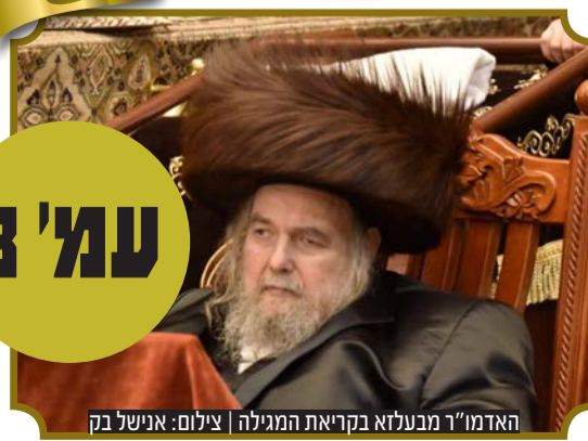
האדמו"ר מבעלזא בקריאת המגילה