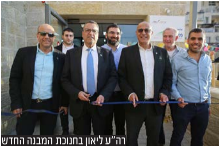
ה"ע ליאון בחנוכת המבנה החדש

אחרי שנים רבות שהפעילויות פוזרו בנקודות שונות ברחבי השכונה, כעת לראשונה נחנך מבנה חדש ומפואר שיאכלס את כלל הפעילויות • ראש העיר משה ליאון: "יש ערוך עצום לפעילות בלתי פורמאלית כרכיב מרכזי המשפיע על התפתחות הילדים, ונמשיך לפתח את המנהלים הקהילתיים"