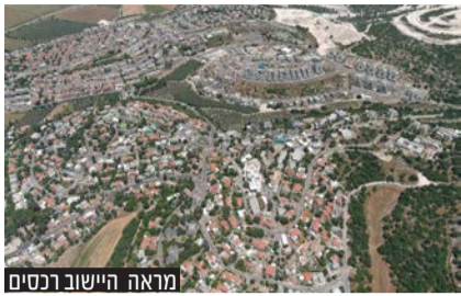
מראה היישוב ברכסים