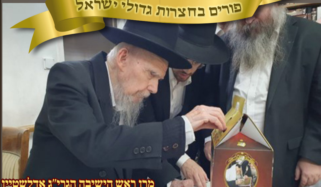
מרן ראש הישיבה הגרי"ג אדלשטיין