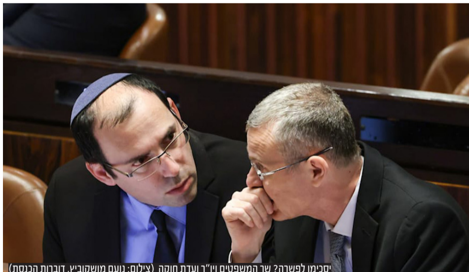
יסימו לפשרה? שר המשפטים יו"ר ועדת חוקה

בכיר ביהדות התורה: "לא נוכל להמשיך לאורך זמן להתנהל באופן הזה. או שנתניהו והליכוד מתכוונים לקיים את ההסכם הקואליציוני, או שאנחנו לא חלק מהקואליציה. אם תהיה פשרה בנושא פסקת התגברות, לא בטוח שהאצבעות של יהדות התורה מובטחות לנתניהו". גם בש"ס מעבירים ביקורת: "החברים בליכוד צריכים לזכור שכמו שלהם יש דברים חשובים ברפורמה והם עומדים על כך, גם לנו יש דברים שאנחנו לא מוכנים להתפשר עליהם" | עמ' 12