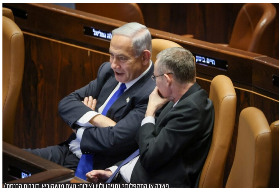
פשרה או התקפלות? נתניהו ולוין

המתווה החדש שיאושר עד סוף מושב החורף: שני המינויים הראשונים של הוועדה למינוי שופטים יתבצעו ברוב של 6 בלבד. למינוי השופט השלישי יידרש חבר אופוזיציה ולמינוי השופט הרביעי ואילך יידרש חבר אופוזיציה ושופט • סיעת הליכוד אישרה ברוב גדול את ההצעה כאשר רק ארבעה חברי כנסת התנגדו • באופוזיציה דחו גם את המתווה הזה וממשיכים במחאות ובהפגנות