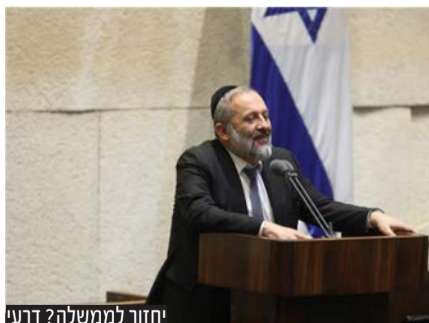
יחזור לממשלה? דרעי

מליאת הכנסת אישרה בקריאה ראשונה את החוק שיאפשר את חזרתו של דרעי לממשלה. בהצעת החוק תמכו 63 חברי כנסת מול 55 שהתנגדו