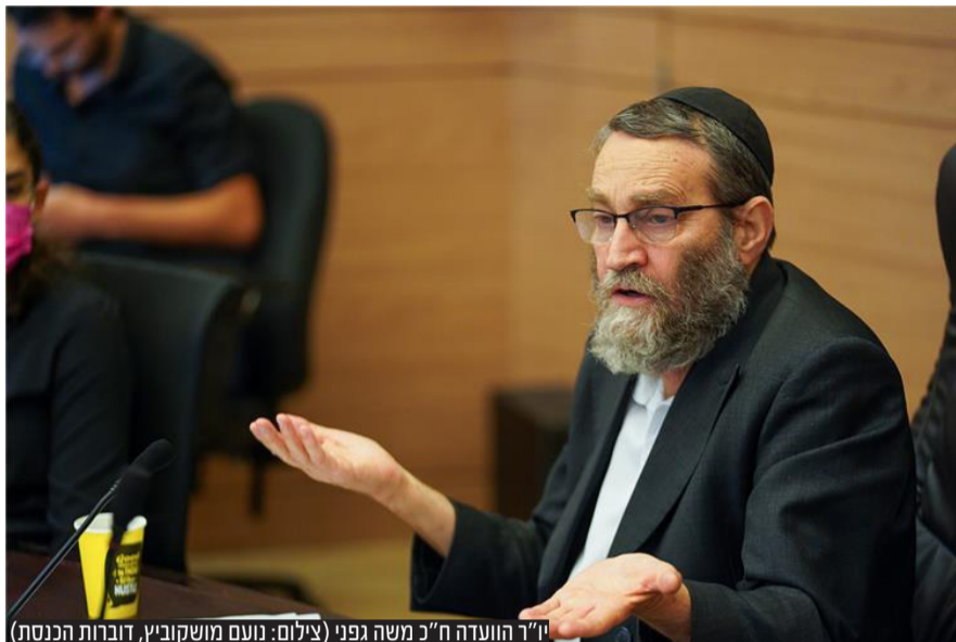
יו"ר הועדה ח"כ משה גפני

בעלי המעונות במאבק חירום עקב מחסור חמור במטפלות, ובעקבות ניסיון להטיל מיסוי רטרואקטיבי מ-2015 • איחוד מעונות ארצי (א.מ.א): "מודים ליו"ר הועדה ח"כ גפני ולח"כ עמית הלוי וינון אזולאי על האכפתיות וההבטחה לפתור את הסוגיות הכואבות"