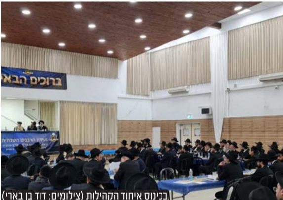
בכינוס איחוד קהילות

בהשתתפות למעלה מ-250 ראשי קהילות, דיינים ומורי הוראה מקרב ציבור האברכים ובני התורה נערך מעמד יסוד איחוד קהילות האברכים בנשיאות הגאב"ד הגר"א פרץ ורה"י הגר"ד אברהם • במרכז המעמד נאם הראשון לציון הגר"י יצחק יוסף