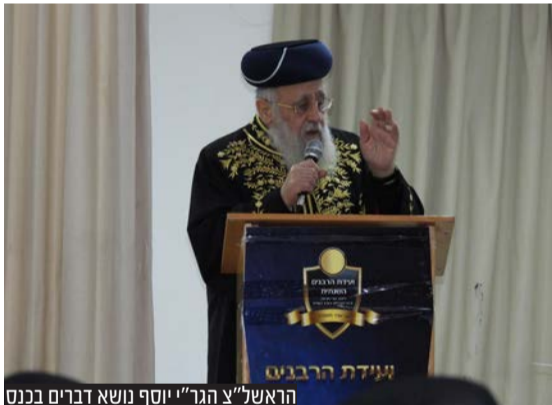
הראשון לציון הגר"י יוסף נושא דברים בכנס