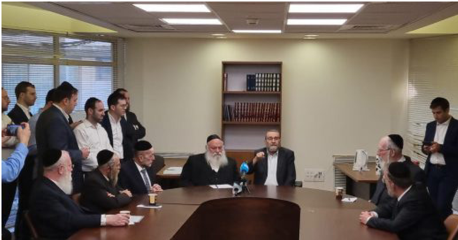
אין תקשורת, ישיבת סיעת יהדות התורה