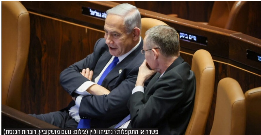
פשרה או התקפלות? נתניהו ולוין

המתווה החדש שיאושר עד סוף מושב החורף: שני המינויים הראשונים של הוועדה למינוי שופטים יתבצעו ברוב של 6 בלבד. למינוי השופט השלישי יידרש חבר אופוזיציה ולמינוי השופט הרביעי ואילך יידרש חבר אופוזיציה ושופט. סיעת הליכוד אישרה ברוב גדול את ההצעה כאשר רק ארבעה חברי כנסת התנגדו. באופוזיציה דחו גם את המתווה הזה וממשיכים במחאות ובהפגנות