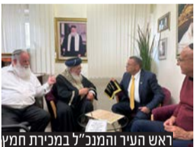
ראש העיר והמנכ"ל במכירת חמץ