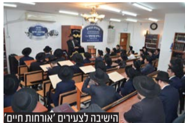
הישיבה לצעירים 'אורחות חיים'