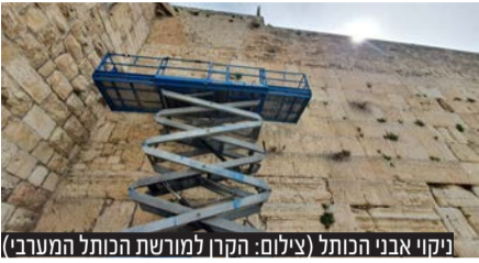
מקווי אבני הכותל

לקראת חג הפסח, הקרן למורשת הכותל המערבי נערכת לבואם של רבבות מבקרים מהארץ ומחו"ל במהלך החודש הקרוב וכן בימי חול המועד פסח