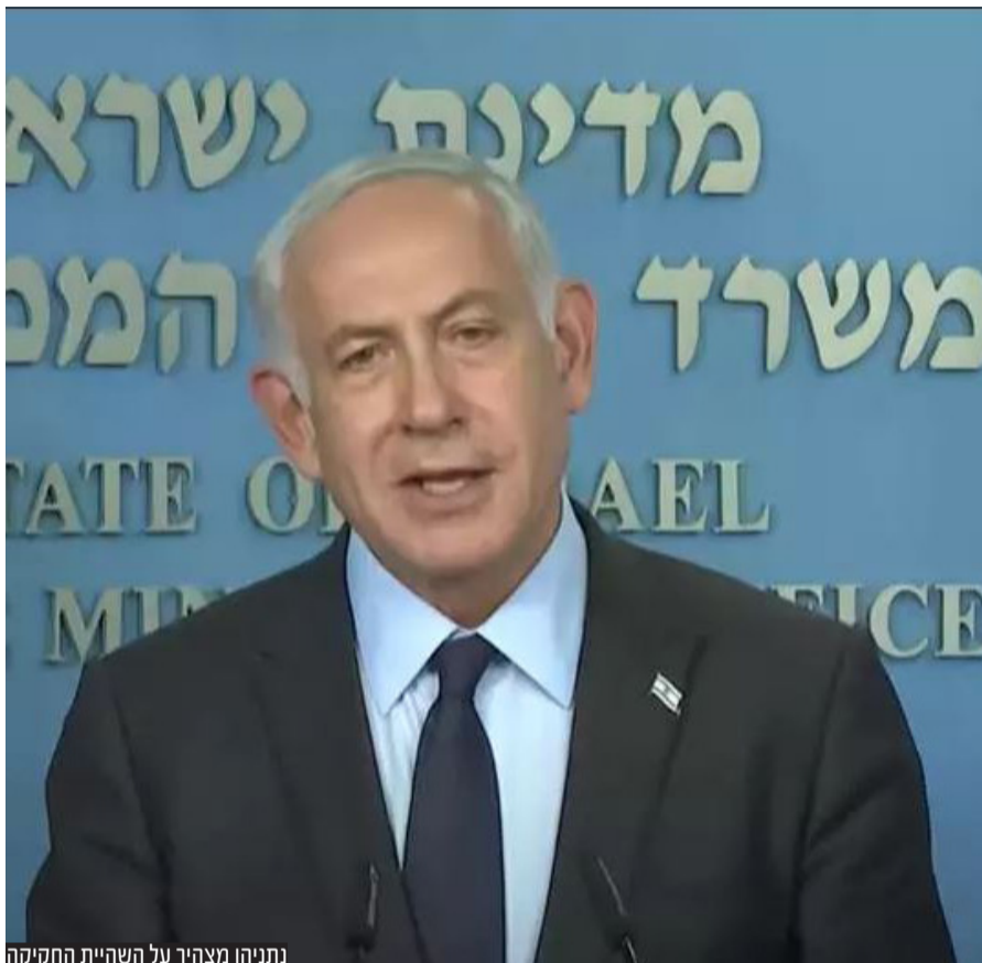
נתניהו מצהיר על השהיית החקיקה

בתום ימים סוערים שבהן יצאו עשרות אלפים לרחובות הערים במחאה על פיטורי שר הביטחון יואב גלנט, גם בליכוד הבינו כי אין מנוס מהקפאת החקיקה עד למושב הקיץ • בנאום שנשא נתניהו ביום שני בערב הודיע: משהים את החקיקה בניסיון להגיע להסכמה • יו"ר המחנה הממלכתי בני גנץ ויו"ר יש עתיד יאיר לפיד בירכו על הקפאת החקיקה