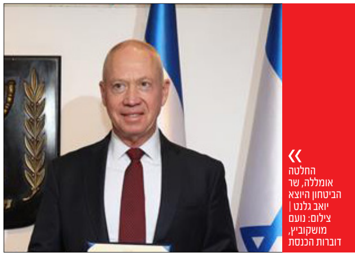
« החלטה אומללה, שר הביטחון היוצא יואב גלנט

ואז הגיעה הפגנת הימין ושיבשה לנתניהו את התוכנית. במקום לתת הצהרה לאומה בשעות הבוקר, לחסוך את השביתה במשק ואת השיבושים בנתב"ג ולצאת מהסיפור בשן ועין, במה שהיה מחסל הרפורמה ואולי מקדם את קצה של הממשלה, בהתפתרות אפשרית של שר המשפטים יריב לוין, עשה נתניהו את מה שהוא יודע לעשות יותר טוב מכולם - לחכות לדקה האחרונה ולהקשיב בינתיים היטב לדופק בקרב ה'בייס' הקשיח של מצביעיו