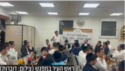
ראש העיר במפגש