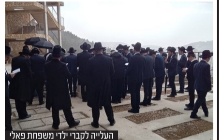
העלייה לקברי ילדי משפחת פאלי