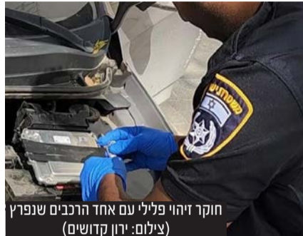
חוקר זיהוי פלילי עם אחד הרכבים שנפרץ

קצר תפסו את הצעיר שמתגורר בצפון הארץ ועצרו אותו לחקירה. בהמשך גנב הרכב יעמוד לדין פלילי ויוגש נגדו כתב אישום.