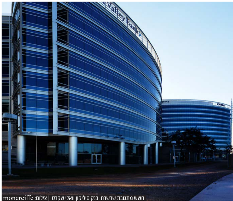
חשש מתגובת שרשרת. בנק סיליקון וואלי שקרס

הצהרה משותפת פורסמה גם על ידי שרת האוצר ג'נט ילן, יו"ר מועצת הפדרל ריזרב ג'רום פאוול ויו"ר תאגיד ביטוח פיקדונות הפדרלי (FDIC) מרטין ג'יי גרינברג. בהודעתם נאמר כי הם נוקטים פעולות נחרצות כדי להגן על כלכלת ארה"ב: "למפקדים תהיה גישה לכל כספם החל מיום שני, 13 במרץ. שום הפסדים הקשורים להחלטה של בנק עמק הסיליקון לא יהיה על משלם המסים. מועצת הפדרל ריזרב הודיעה ביום ראשון כי תעמיד מימון נוסף לזכאים כדי לסייע להבטיח שלבנקים תהיה את היכולת לענות על הצרכים של כל המפקדים שלהם".