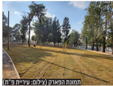
תמונת הפארק

בפארק חדש שנבנה בימים אלו ברחוב ארלוזורוב בסמוך לגן יהונתן ופארק יד לבנים, ינצחו את שמו של סא"ל עמנואל מורנו ז"ל