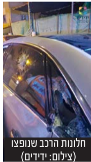
חלונות הרכב שנופצו