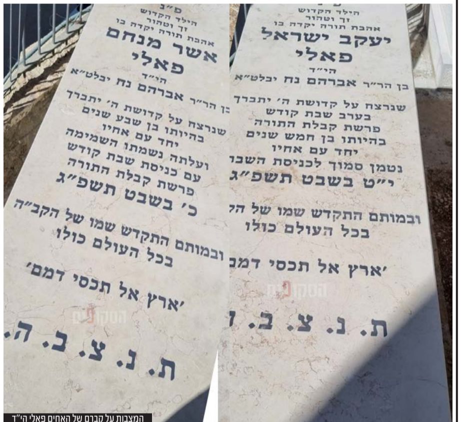
המצבות על קברם של האחים פאלי הי"ד