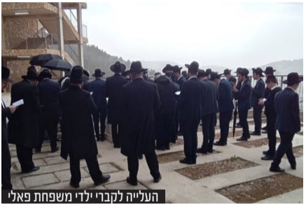
העלייה לקברי ילדי משפחת פאלי