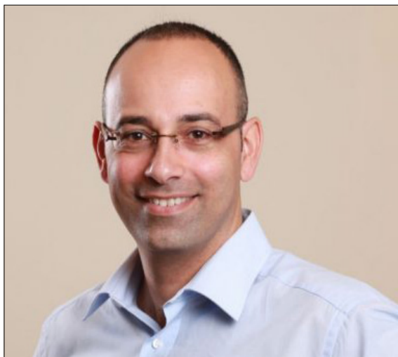
« הטעות של מוד"ס. פרוץ ירון זליכה

לפי התוכנית המסתמנת, ש"ס תחפוץ בשלושה מינויים: תחילה, הראשון לציין, הגאון רבי יצחק יוסף, שצפוי להתמנות לתפקיד נשיא מועצת חכמי התורה, תפקיד שנשמר פנוי במוצהר עד לסיום כהונתו. שנית ושלישית, חבר מועצת חכמי התורה הגאון רבי דוד יוסף ורבה של באר שבע הגאון רבי יהודה דרעי, האחד יזכה בקופה המרכזית של תפקיד הראשלי"צ הבא, והשני יסתפק בפרס הניחומים של רבנות העיר ירושלים