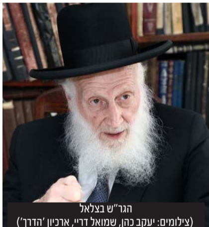
הגר"ש בצלאל