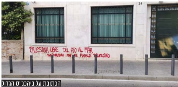
הכתובת על ביהכנ"ס הגדול