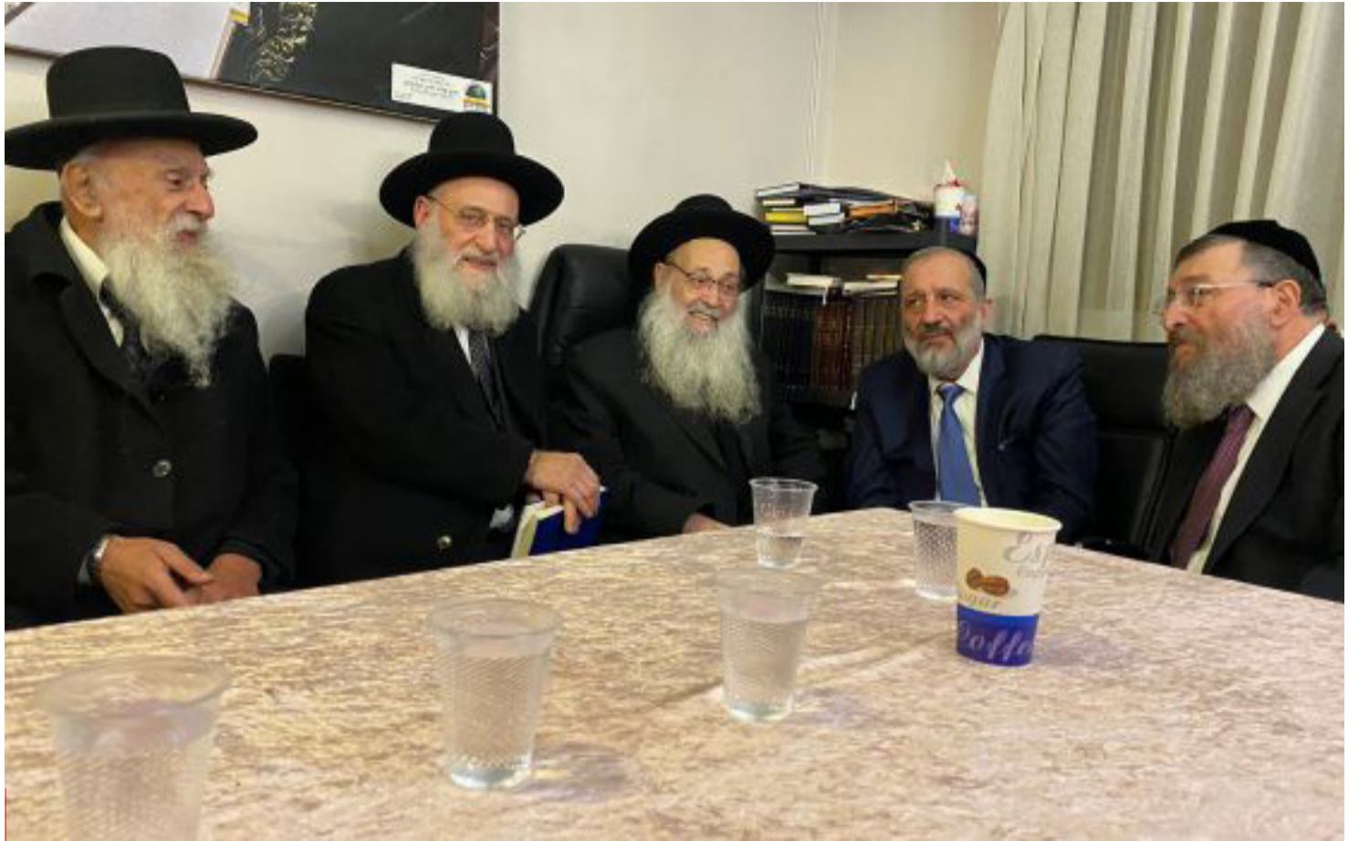
"להרחיב את גבולות הקדושה", מועצת חכמי התורה | צילום: יעקב כהן

כך גם באינפלציה בשאר המוצרים, קרוב ל-40% מעליית המחיר משולמת כמיסים. את מה שאני טענתי הבינו גם בשתי חברות הדירוג האחרות ולכן אצלן לא השתנתה התחזית לדירוג האשראי של ישראל". לפי זליכה, במודי'ס הבינו את הטעות כבר במהלך השנה שעברה, ולכן גם לא העלו את הדירוג בזמנו - למרות התחזית החיובית. עכשיו, בהזדמנות הראשונה, הם תיקנו את הטעות ו"חיפשו תירוץ נוח, כי הרי הם לא יגידו 'טעינו', ואין נוח יותר מהמחאה". זליכה גם מדגישה, "למחאה אין שום משמעות מבחינת שוק האשראי. כל שוק ההון לא התייחס אליהם ברצינות כבר בזמנו ולא הוזיל את הריבית בשנה שעברה, ולכן גם כעת אין לזה שום משמעות".