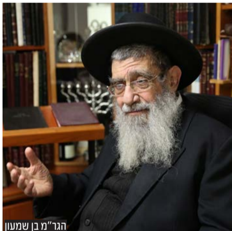
הגר"מ בן שמעון