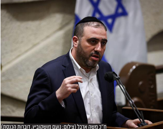
ח"כ משה ארבל

"הוחלט כי לעת עתה ח"כ הרב משה ארבל, אשר כיהן כסגן שר הבריאות והפנים, ימונה לתפקיד שר הבריאות והפנים, עד אשר הרב אריה דרעי יוכל לחזור ולהתמנות לתפקיד השר, והרב ארבל יחזור לכהן כסגנו", כך כתב הגר"מ מאיה