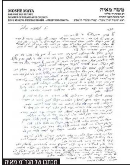
מכתבו של הגר"מ מאיה

שלמה מחפוד שליט"א, רבה של יהדות תימן וגאב"ד יורה דעה. מינויו של הגר"א סאלים כחבר מועצת חכמי התורה של ש"ס מהווה סגירת מעגל שהחלה לפני למעלה מעשור. כידוע הגר"א סאלים, מתלמידיו בל שמרן הגראמ"מ שך זצוק"ל, היה ממייסדי ארגון מרכזי התורה, שתמכו במשך השנים ב'דגל התורה'. יחד עם זאת, בשנים האחרונות לחייו, נפגש הגר"א סאלים עם מרן הגר"ע יוסף זצוק"ל כאשר הגיע לבקרו בביתו. מאז, השתתף הגר"א סאלים באירועים רבים של תנועת ש"ס, והשבוע כאמור מונה לחבר מועצת חכמי התורה של התנועה.