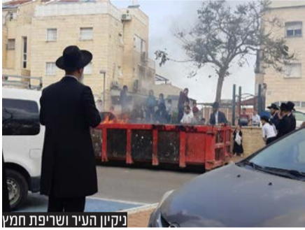
ניקיון העיר ושריפת חמץ

כמו כן, חידוש שנרשם השנה היה בנושא שריפת החמץ, כאשר לאחר מיפוי מדויק ובחינת הנתונים מהשנים הקודמות, הובאו מכולות ענק לאזורים בהם ישנה כמות גדולה של חמץ שמוצאת לשריפה בערב החג, וכך עם תום מועד ביעור החמץ, הגיעו המשאיות הגדולות ואספו את כל המכולות והחביות בתוך פרק זמן קצר.