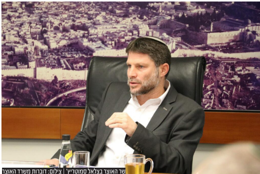
שר האוצר בצלאל סמוטריץ'

שר האוצר בצלאל סמוטריץ' הציג ביום שני בבוקר במליאת הכנסת את תקציב המדינה וחוק ההסדרים לשנים 2023-2024, להצבעה בקריאה ראשונה • בדבריו אמר השר סמוטריץ': "הנהגה כלכלית אחראית נחוצה כעת לצליחת האתגרים המצויים לפתחנו. בעת הזו חשוב מאוד לנהוג באחריות. אישור התקציב הוא צעד קריטי - הוא משדר לציבור, לחברות הדירוג ולמשקיעים שישראל פועלת באחריות ויסייע להבטיח יציבות"