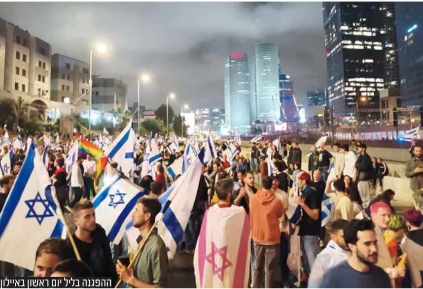
ההפגנה בליל יום ראשון באילון

אם יגיע היום ותפסיק להתקיים כאן דמוקרטיה, זה יהיה בגלל מפגינים שלא קיבלו את העובדה שלמעלה מ-2 מיליון אנשים הלכו לקלפי כדי לממש מדיניות ימין. כשהימין הלך לקלפי הוא הצביע בשביל למשול - בנגב, ביו"ש ובבית המשפט. והתקופה הזאת תיזכר כימים בהם מיעוט קולני מגובה במוסדות השלטון לא נתן לימין לממש את זכותו