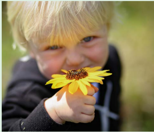
שאלרגיה היא סיבה שכיחה להיעדרות מעבודה. במקרים מסוימים היא יכולה להביא לדלקת של הסינוסים או דלקת ריאות.