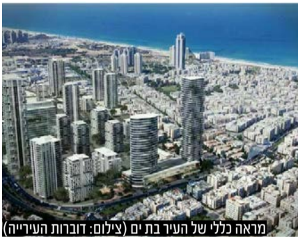
מראה כללי של העיר בת ים

ע"פ נתוני הלמ"ס: מעל 3,000 דירות החלו להיבנות בבת ים בשנת 2022 • ניתוח הנתונים נעשה בחברת מכלול מימון העוסקת במימון וליווי פרויקטים למגורים