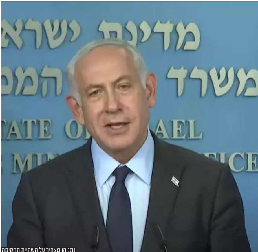
נתניהו מצהיר על השהיית החקיקה

בתום ימים סוערים שבהן יצאו עשרות אלפים לרחובות הערים במחאה על פיטורי שר הביטחון יואב גלנט, גם בליכוד הבינו כי אין מנוס מהקפאת החקיקה עד למושב הקיץ • בנאום שנשא נתניהו ביום שני בערב הודיע: משהים את החקיקה בניסיון להגיע להסכמה • יו"ר המחנה הממלכתי בני גנץ ויו"ר יש עתיד יאיר לפיד בירכו על הקפאת החקיקה