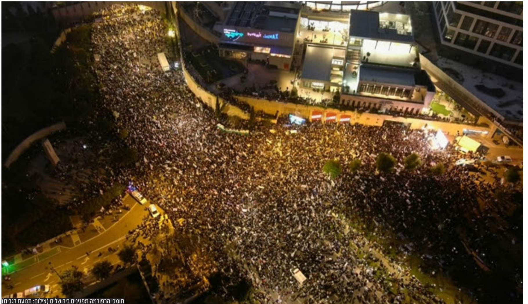
תומכי הרפורמה מפגינים בירושלים

כמאה אלף מפגינים תומכי הרפורמה שהגיעו לגן סאקר דרשו מהמשלה להמשיך בחקיקה: "לא יגבנו לנו את הבחירות" • בהכנה נשאו דברים שר האוצר בצלאל סמוטריץ', שר התקשורת שלמה קרעי, השר לביטחון לאומי איתמר בן גביר, השרה מאי גולן ויו"ר ועדת החוקה ח"כ שמחה רוטמן שקראו לנתניהו להמשיך בחקיקת הרפורמה