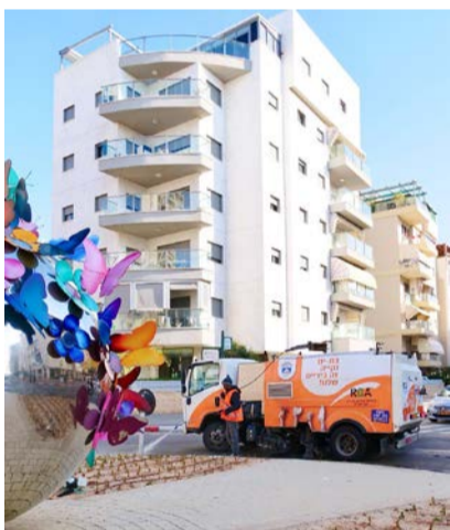
מבצע ניקיון ברחובות בת ים