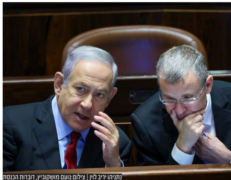
נתניהו יריב לוין