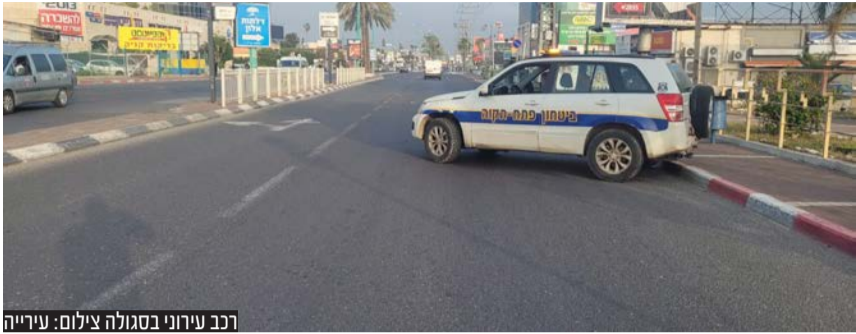
רכב עירוני בסגולה

ברחבי העיר והרחבנו את המענה בתחום גם בחג וגם בשגרה"