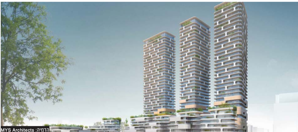
MYS Architects: תמונה

בסמוך לתחנת מטרו ורכבת קלה, הוועדה הארצית לתכנון ובנייה אישרה פרויקט התחדשות ברחובות אנסקי, אמסטרדם וקפלן