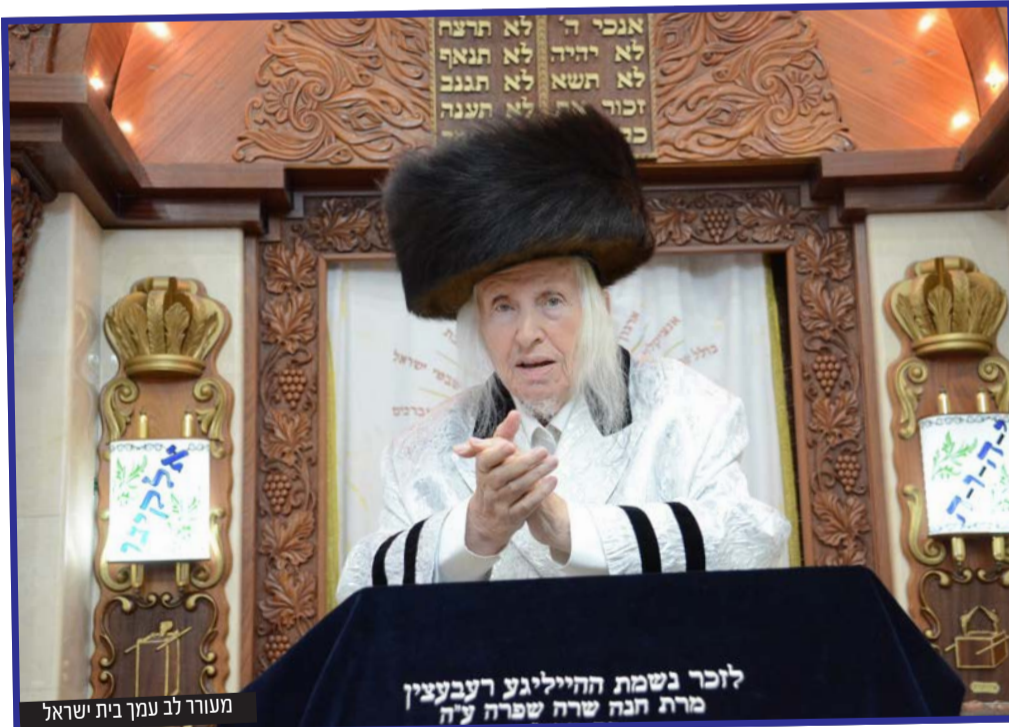
מעורר לב עמך בית ישראל

הרבי. "היה אצלנו בקאליב בזמנו, בכנס השלושים' לרבי זצ"ל יהודי ספרדי מבוגר עם כובע וזקן. הוא לא הבין מילה מהשיחות, שהיו ביידיש. בסוף הכנס הוא הגיע אליי ואמר לי: הרבי חייב להקשיב לסיפור שלי: אני הייתי אחד מהאנשים מהכי אנטי דתיים בקום המדינה, ולפני כמעט יובל שנים הייתי ברחוב בראשון לציון במוצאי שבת של סליחות, והייתי צריך להתפנות, ואמרו לי שיש בית כנסת 'קאליב' קרוב, שהוא פתוח (בזמנו, כאמור, קאליב שכנה בראשון לציון). נכנסתי לשם, ואז שמעתי קול של מישהו שר לעצמו. אמרתי: אכנס רק לשנייה. נכנסתי, ומאז אני דתי. אני לא ארחיב מעבר לזה, אבל זה, השירה השמימית הזאת של הרבי,