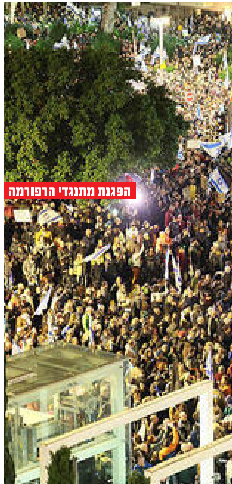
הפגנת מתנגדי הרפורמה