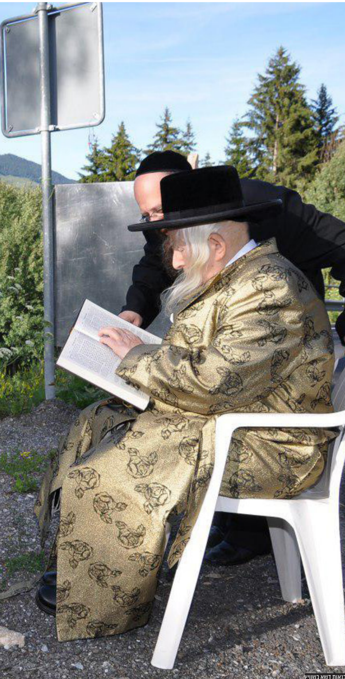
בנאות דשא בשווייץ

א ין כמעט ילד שלמד בבית ספר תורני בארץ ישראל בשנות השמונים והתשעים שלא זכה לראות מקרוב את דמותו של הרבי מקאליב זצוק"ל, שנפטר לפני כארבע שנים, יומיים לאחר פסח תשע"ט. הרבי, ששרד את השואה הנוראה והיה בכל חייו זיכרון חי לקדושי השואה, נהג לעבור במשך עשרות שנים בין מוסדות שונים - בתי ספר, תלמודי תורה, בסיסי צבא, אירועים, כנסים - ולשיר את שירת חייו, שיר הלל לה' יתברך, וגם שירים לזכרם של ששת מיליון קדושי השואה הי"ד.