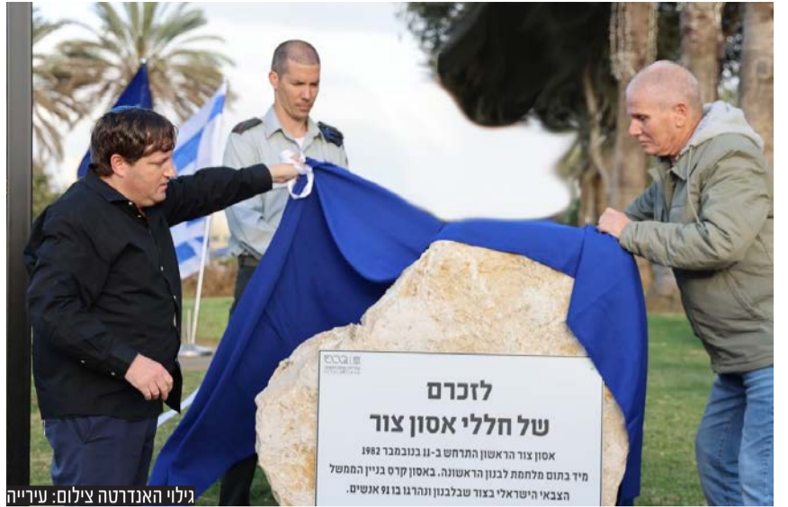
גילוי האנדרטה