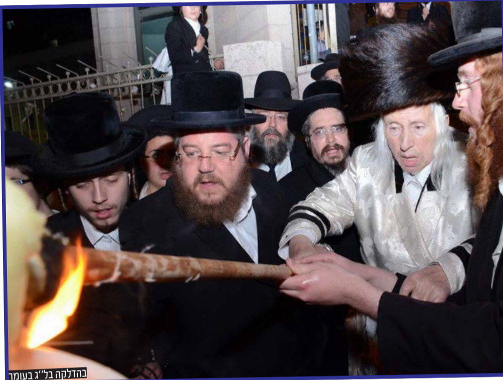
ההדלקה בל"ג בעומר