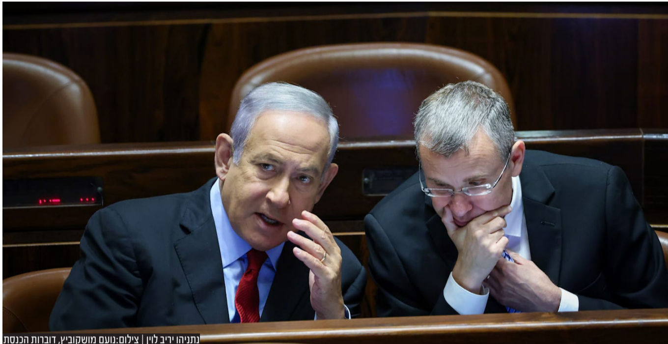
נתניהו וריב לין

ראש הממשלה בנימין נתניהו הודה ביום ראשון השבוע בתשובתו לבג"צ כי המהפכה המשפטית משפיעה על ביטחון המדינה, ולכן הוא אינו מנוע מלהתערב בה חרף הסכם ניגוד העניינים שבו הוא מצוי. העתירה הוגשה על ידי התנועה לאיכות השלטון, ולפיה נתניהו הפר את הסדר ניגוד העניינים שלו ואת פסיקת בג"ץ שאוסרת עליו לעסוק בנושאים משפטיים. בנאומו, עליו עתרה התנועה לאיכות השלטון, התייחס נתניהו בפעם הראשונה למהפכה המשפטית ואמר כי הוא "נכנס לאירוע". ראש הממשלה אמר כי הוא ידאג לטפל בחקיקה זו באופן אישי, וכי מנע ממנו לעסוק בכך עד עכשיו כי "איימו להוציא אותי כראש ממשלה כנבצרות". כזכור, לאחר נאומו של נתניהו, אמרה היועצת המשפטית לממשלה גלי בהרב מיארה כי בדברים שנשא, הפר נתניהו את פסיקת בג"ץ בעניינו וכתבה כי "הצהרתך וכל פעולה שתבוצע על ידך בניגוד לאמור היא בלתי חוקית ונגועה בניגוד עניינים". נתניהו הגיב באמצעות עורכי דינו לעתירה וטען כי "אזרחי ישראל בחרו רק לפני חודשים ספורים, ברוב ברור, במפלגות המרכיבות את הקואליציה הנוכחית. כל המפלגות המרכיבות את הקואליציה הנוכחית, הודיעו באופן ברור במערכת הבחירות, שהן מעוניינות שחבר הכנסת בנימין נתניהו יעמוד בראשות הממשלה". בהמשך הדברים טען נתניהו כי "פסק הדין לא אסר על ראש הממשלה לדון