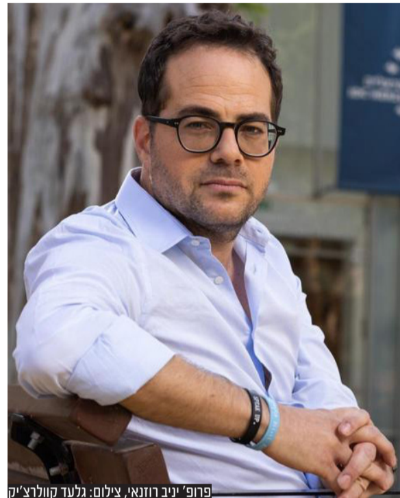
פרופ' יוני רוזנאי, צילום: גלעד קוולרצ'יק

שיפוטיות. אגב, מתווה הנשיא מבטל את הוטו של השופטים ומעלה משמעותית את כוחם של נציגי הציבור, בלי לתת שליטה קואליציונית".