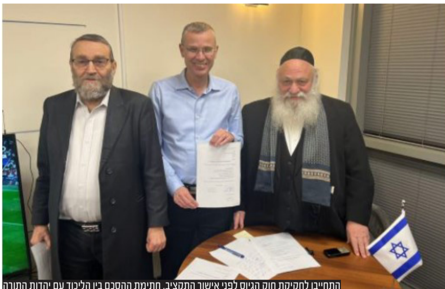
התחייבו לחקיקת חוק הגיוס לפני אישור התקציב. חתימת ההסכם בין הליכוד עם יהדות התורה

סביר להניח שיו"ר ועדת הכספים ח"כ משה גפני עוד יעשה שימוש בדיוני הוועדה כדי לעכב דברים החשובים לליכוד, במחאה על אי העברת חוק הגיוס. אך בש"ס וביהדות התורה מפנימים שגם מושב הקיץ הקרוב עשוי להסתיים מבלי שהסוגיא באה אל פתרונה. על אף שהדד ליינ המשפטי נקבע ליולי 2023, לא מן הנמנע שהממשלה תבקש ארכה נוספת ואולי לשם כך אף תעביר את חוק הגיוס בקריאה ראשונה, בידיעה שהחוק יעבור שינויים לקראת קריאה שניה ושלישית, אך יתן לבג"צ עילה מספקת להיענות לבקשת הממשלה לדחות את מועד העברת החוק, בטענה שהליכי החקיקה כבר החלו בפועל.