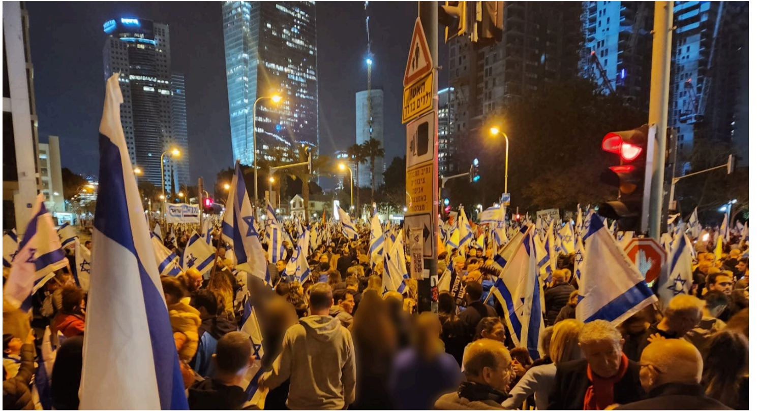
הישראלים נגד היהודים. הפגנת המחאה בקפלן