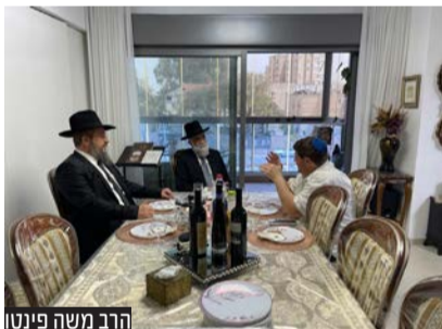
הרב משה פינטו