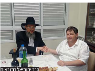
הרב יקותיאל רזנבאום