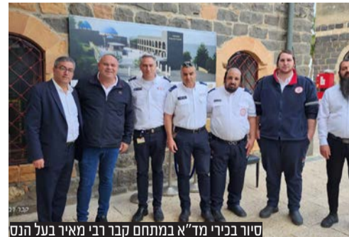
סויר בכירי מד"א במתחם קבר רבי מאיר בעל הנס