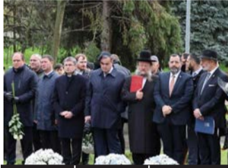
הנכבדים בטקס לציון 120 שנה לפוגרום קישינב