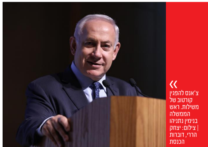
צ'אנס להפגין קורטוב של משילות ראש הממשלה בנימין נתניהו

ההיבט השני העמוק במחאה הנוכחית, הוא תחושתם של המוחים על כך שישנו בישראל חוסר בשוויון נטל, הצבאי והכלכלי. גם אם מדובר בתחושה מדומה - משום שדווקא מצביעי הציונות הדתית והליכוד, תושבי הפריפריה וההתנתחויות, הם הנושאים בעיקר הנטל הצבאי, על פי כל דגימה של מצב הלוחמים הקרביים בצה"ל (מה שמתבטא, לצערנו, גם בבחינת זיהויים של הנופלים בשנים האחרונות). באופן אירוני, דווקא העובדה ששערי הקורסים היותר נחשקים, התפקידים היותר נכבדים, כמו טייסים, למשל, היו סגורים בפני קבוצות האוכלוסייה המשתייכות לימין, מחזקת את תחושת עורף הנטל המונח על כתפי המוחים וההנחה ש"המדינה זה אנחנו".