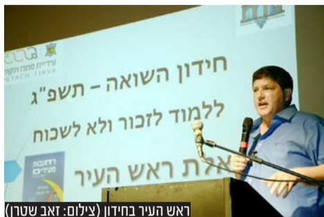
ראש העיר בחידון