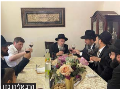
הרב אליהו כהן

לצד סגנו ומ"מ הרב אליהו גינת ראש העיר רמי גרינברג התקבל בחמימות ובידידות רבה במעונם של רבני העיר שליט"א