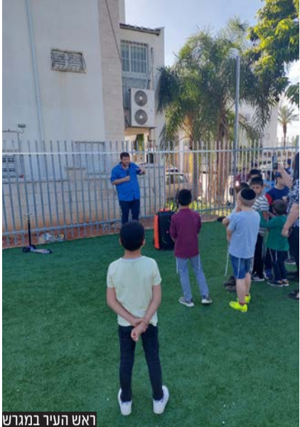
ראש העיר במגרש

ראש העיר נענה לבקשת התושבים בגני הדר והכשיר שטח ציבורי למגרש משחקים • "אנו חשים ביחס המיוחד שראש העיר נותן לכל תושב"