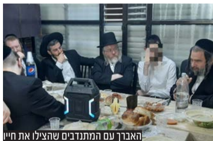
האברך עם המתנדבים שהצילו את חייו

האברך הצעיר שהתמוטט לפתע בביתו, זכה לקבל את חייו במתנה אודות למאמצי ההחייאה האדירים של מתנדבי 'הצלה' שפעלו בתושייה