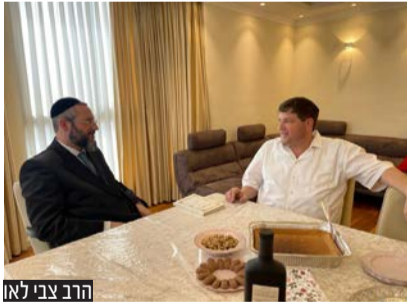
הרב צבי לאו