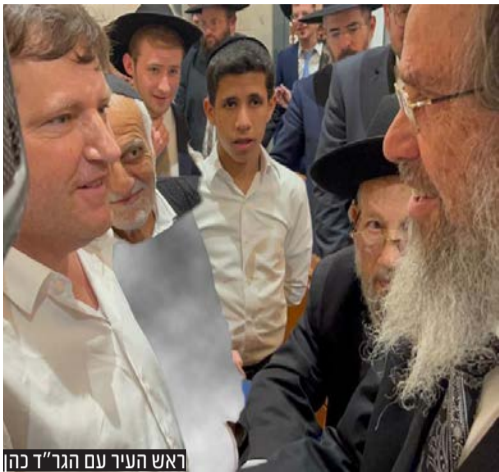
ראש העיר עם הגר"ד כהן

בבית המדרש - 'חברון היכל יחזקאל': המונים השתתפו בשיעורו של ראש הישיבה וחבר מועצת גדולי התורה הגאון הגדול רבי דוד כהן שליט"א