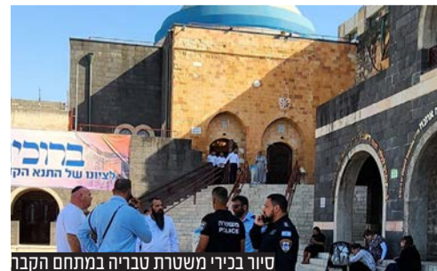
סויר בכירי משטרת טבריה במתחם הקבר

במקביל, התקיים סיור הערכות מקיף ומקצועי של בכירי מד"א במתחם הקבר, כדי לעמוד מקרוב אחרי סידורי האבטחה במקום ופריסת הכוחות בשטח.