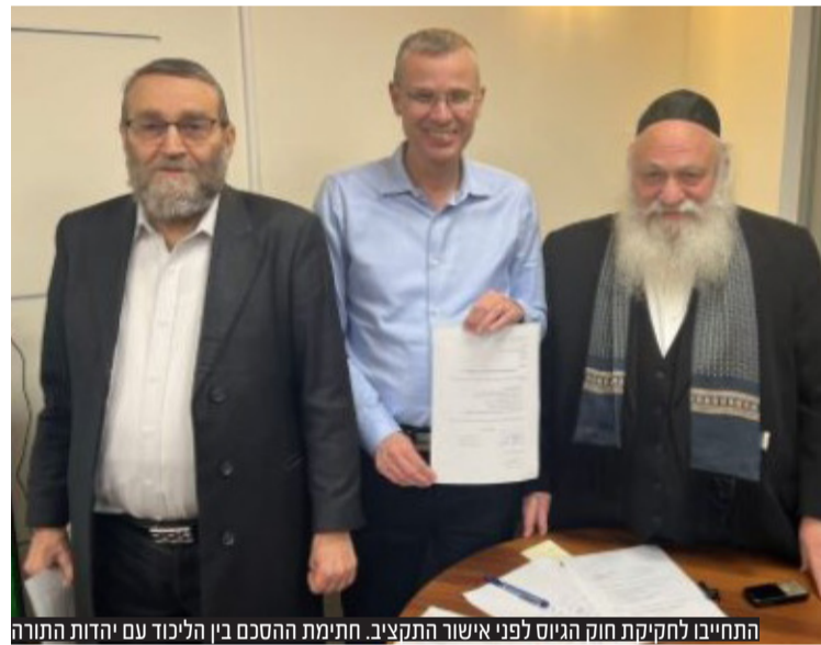
התחייבו לחקיקת חוק הגיוס לפני אישור התקציב. חתימת ההסכם בין הליכוד עם יהדות התורה

בכירים בליכוד העבירו לראשי ש"ס ויהדות התורה את המסר ולפיו לאור האווירה הציבורית, לא ניתן יהיה להעביר את חוק הגיוס ואת חוק יסוד לימוד תורה לפני העברת תקציב המדינה, כפי שהתחייבו בהסכם הקואליציוני | עמ' 14