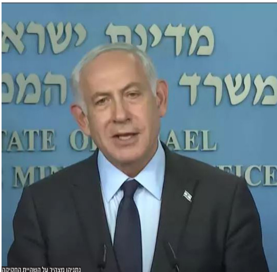
נתניהו מצהיר על השהיית החקיקה

בתום ימים סוערים שבהן יצאו עשרות אלפים לרחובות הערים במחאה על פיטורי שר הביטחון יואב גלנט, גם בליכוד הבינו כי אין מנוס מהקפאת החקיקה עד למושב הקיץ • בנאום שנשא נתניהו ביום שני בערב הודיע: משהים את החקיקה בניסיון להגיע להסכמה • יו"ר המחנה הממלכתי בני גנץ ויו"ר יש עתיד יאיר לפיד בירכו על הקפאת החקיקה