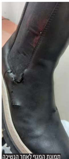
תמונת המגף לאחר הנשיכה

בהמשך לידיעה שפרסמנו בשבוע שעבר אודות הנערה שנשכה מכלב, אב הנערה במסר כללי - "חייבים להעניש וליצור הרתעה" • "אירוע של נשיכת ילדה על ידי כלב הוא אירוע המוגדר כטראומתי לא רק עבור הילדה הננשכת אלא גם עבור ילדים אחרים שנחשפו לסיפור ואשר עלולים לסבול מטראומטיזציה משנית"