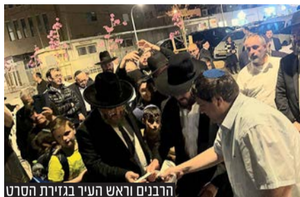
הרבנים וראש העיר במזירת הסרט