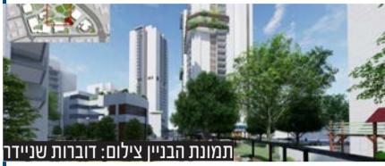
תמונת הבניין

המגדל החדש אשר מכפיל בגודלו את ההיקף הקיים של מרכז שניידר, מהווה גם בית חולים חירום נגד מלחמה קונבנציונלית, ביולוגית וכימית וכולל פגייה עם חדרים אישיים וגינה טיפולית. הבניין יחל בתהליך אכלוס בחודש מאי