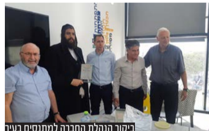
ביקור הנהלת החברה למתנ"סים בעיר

הנהלת החברה למתנ"סים הגיעה לסיור והעניקה תעודת הוקרה לראש העיר