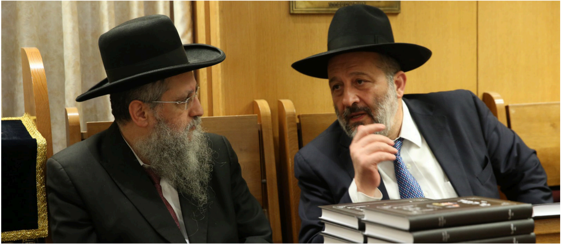
חברות במבחן, הגאון רבי דוד יוסף עם יו"ר ש"ס אריה דרעי