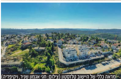
מראה כללי של היישוב טלזסטון

היישוב בהנהגתך. אני מאחל לנו שיתוף פעולה פורה, ומחכה לפגישתנו". ראש עיריית טלז התחייב בפני הרב רביץ שהעירייה בראשותו תציב לוח זיכרון באזור המקום בו פעלה ישיבת טלז המעטירה. יצוין כי לקראת מעמד החתימה המרגש שיתקיים במהלך חודש תמוז לציון טבח יהודי העיר, תגיע משלחת מכובדת בראשות ראש המועצה הרב יצחק רביץ וצאצאיו של מרן הגר"א גורדון זצוק"ל. בעיריית טלז כבר מתכוננים בהתרגשות לביקור ההיסטורי, והרשויות הונחו להיערך בהתאם. ביישוב הביעו התרגשות על הבשורה, והתושבים סיפרו שהם ממתנינים בהתרגשות למעמד החתימה הרשמי והחגיגי. גם בעיר טלז שבליטא דיווחו על שהם רואים בכך מעט מן המעט ממה שהם יכולים לעשות כדי להביע חרטה על ימי הזוועות שעברו יהודי העיר והמדינה כולה.