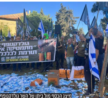
מיצג הכסף מול ביתו של השר גולדקנופף