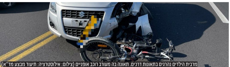
מרבית הילדים נהרגים בתאונות דרכים. תאונה בה מעורב רוכב אופניים

זעקת ההורים השכולים לרגל שבוע בטיחות הילד: ארבעה הורים ששכלו את ילדיהם בתאונות מבקשים: "אל תגידו לי זה לא יקרה" • אורלי סילבינגר, מנכ"לית ארגון בטרם לבטיחות ילדים: "מידי שנה מגיעים לחדרי המיון למעלה מ-200 אלף ילדים שנפגעו בתאונות שניתן היה למנוע את רובן" | עמ' 6