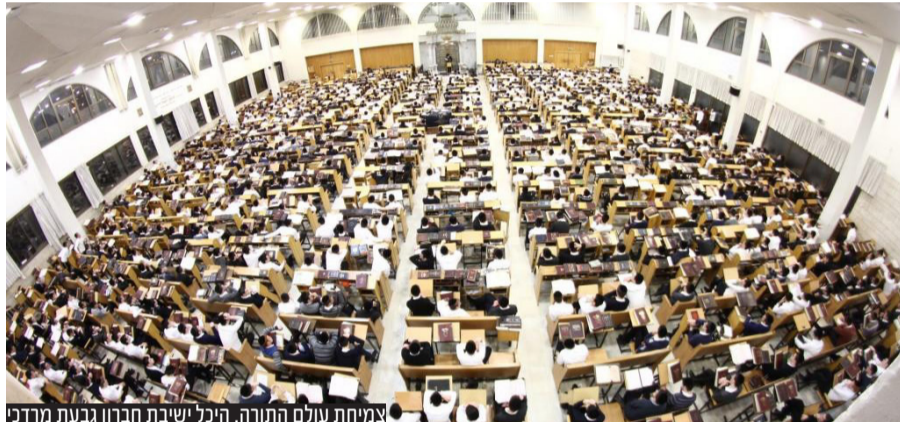
צמיחת עולם התורה. היכל ישיבת חברון גבעתי מרדכי

שר האוצר בצלאל סמוטריץ': "גם אחרי התוספות, מוסדות הפטור לא יקבלו יותר מ-55% תמיכה, דבר שנקבע לפני עשרות שנים. במשך השנים האחוזים נשחקו והגיעו ל-23%, בעיקר בגלל הגידול בבסיס של החינוך הממלכתי. אנחנו בסך הכול מתקנים עוול" | עמ' 10