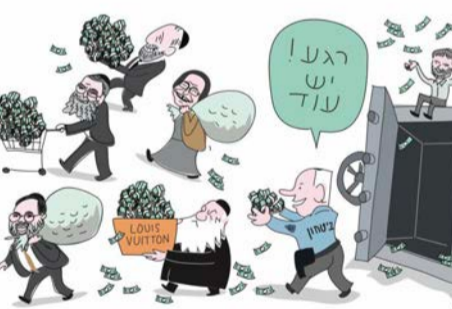
הקריקטורה של בידרמן בעיתון 'הארץ'