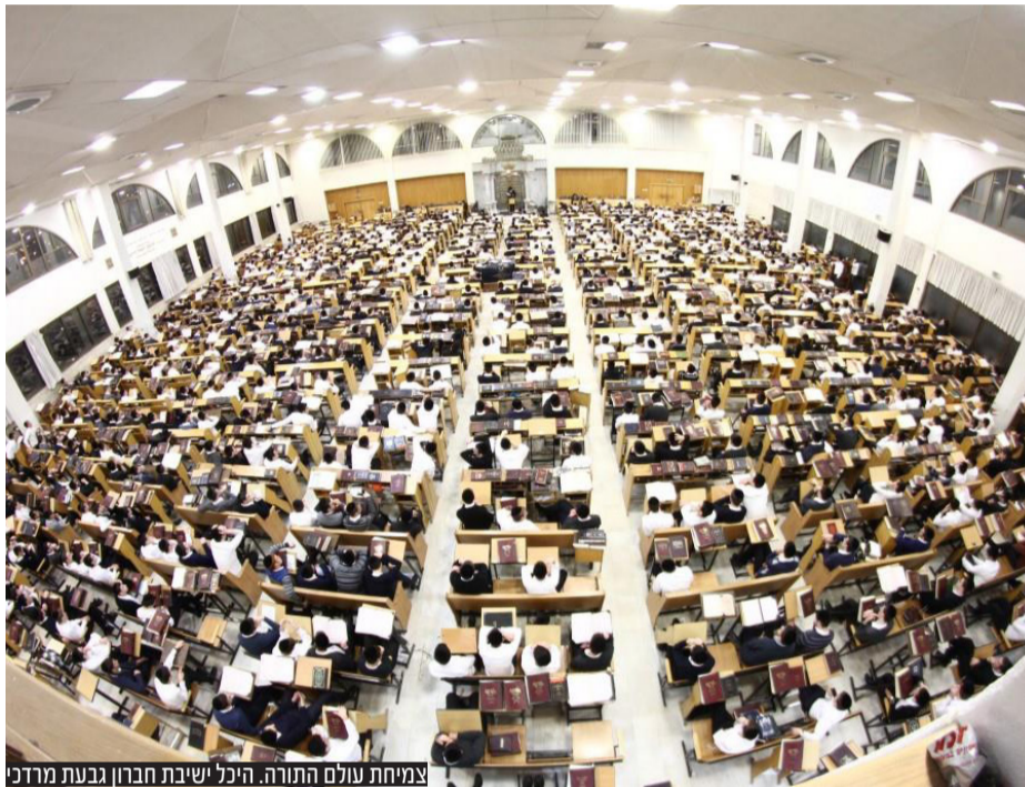
צמחת עולם התורה. היכל ישיבת חברון גבעתיים מרדכי

הממונה על התקציבים באוצר יוגב גרדוס יצא נגד ההחלטה וכתב: "הגדלת התמיכה במוסדות תורניים וחלוקת תלושי מזון במנגנון קצבתי תגדיל את התמריץ לאי-השתתפות בתעסוקה ותביא לפגיעה מיידית בו". לדבריו, "אם השתתפות הגברים החרדים בשוק העבודה תיוותר כפי שהיא כיום, בשיעור של כ-50%, יהיה צורך להעלות את המיסים הישירים ב-16% בשנת 2065, כדי שהמדינה תוכל לספק לציבור הישראלי שירותים ברמה דומה לזו שניתנת כיום".