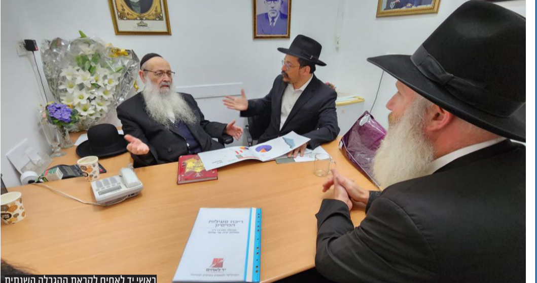
ראשי יד לאחים לקראת ההגרלה השנתית

ביד לאחים אומרים כי נוסף למצווה החשובה של כתיבת ספר תורה, הזוכה יוכל להכניס את ספר התורה בו יזכה לבית הכנסת שלו, לזכותו או לעילוי נשמת יקיריו