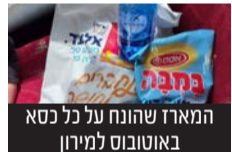
המארז שהונח על כל כסא באוטובוס למירון

ביוזמת רה"ע הרב ישראל פרוש חולקו אלפי מארזי כיבוד שהמתינו לנוסעים למירון בל"ג בעומר תרומת "אסם" ו"טמפו"