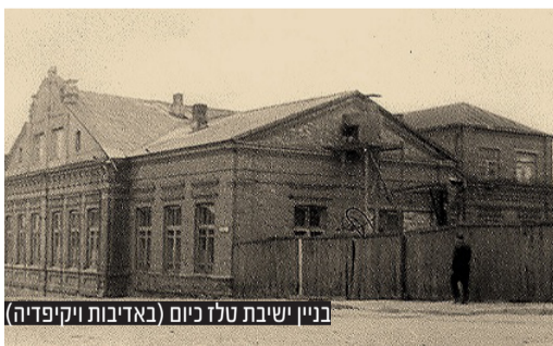
בנין ישיבת טלז ניום