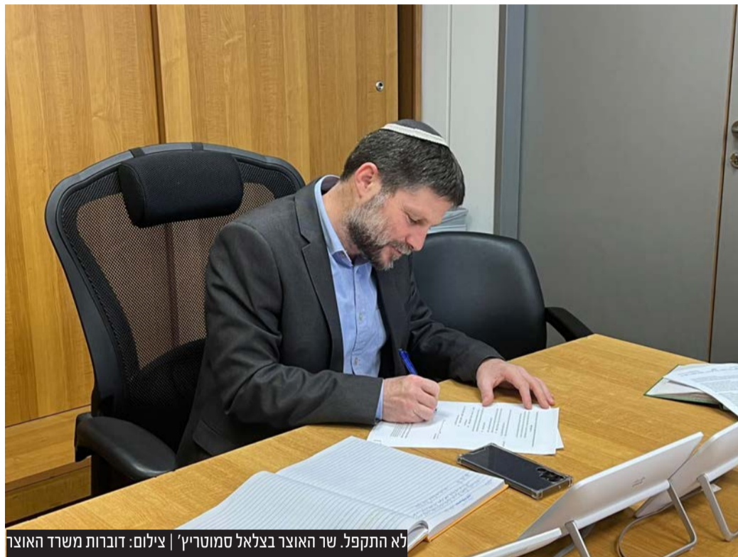
לא התקפל. שר האוצר בצלאל סמוטריץ'

מי שלא הזדעזע כאשר הממשלה הקודמת העבירה מיליוני שקלים לחתולי רחוב, מזדעזע עכשיו כשהממשלה הנוכחית מעבירה מיליוני שקלים ללומדי תורה ולחינוך ילדי ישראל. עניין של סדרי עדיפויות. אמנם ניתן ללמוד מחתול את מידת הצניעות, אך לפעמים צריך דווקא להמתין שהשיירה תעבור חרף הנביחות הנשמעות ברקע.