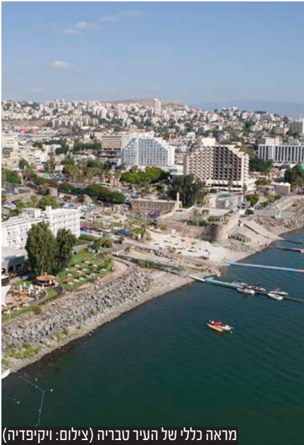
מראה כללי של העיר טבריה

בעקבות התרעה ומעקב צמוד של ארגון 'אור לאחים', בוטל ברגע האחרון כנס מיסיונרי מוזיקלי שנועד להתקיים במתנ"ס פירסט העירוני במרכז העיר טבריה