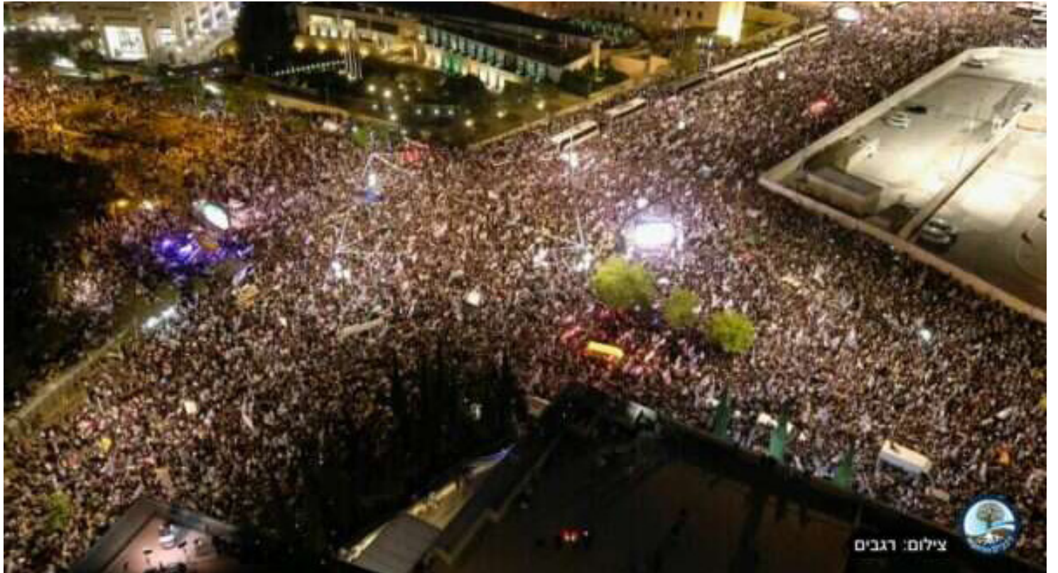
ההפגנה הגדולה ביותר עד כה. מחאת הימין בירושלים

» על רקע ההכרזות הללו נפתח כנס הקיץ בו תידרש הכנסת לאשר את תקציב המדינה. על פניו, התחייבה הקואליציה לסייעות החרדיות להעביר את חוק הגיוס במקביל לתקציב. אולם בש"ס וגם ביהדות התורה הודיעו עקרונית לראש הממשלה כי עקב גל ההסתה (וגם עקב ההבנה שאין משמעות אמיתית לחוק הגיוס בטרם עברה הרפורמה המשפטית, ולמצער פסקת ההתגברות, הקריטית כדי למנוע שוב פסילה של החוק בבג"ץ) הם מוכנים לדחות את החקיקה במספר חודשים