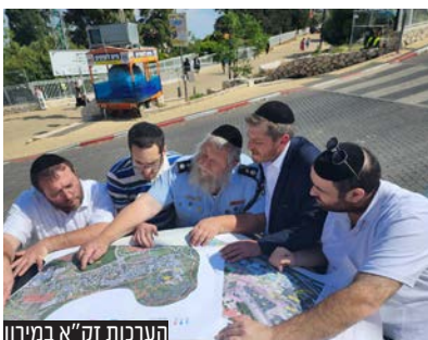
היערכות זק"א במירון

זק"א בציר העלייה המרכזי לצינון של הרשב"י ובמתחם המורחב החדש, עשרות אלפי 'תגי זיהוי' אשר יוצמדו לידי הילדים העולים מירונה, כאשר על התג מופיעים פרטי הילד וכתובת מגוריו עם מספר טלפון של מלוויו הנמצאים במירון. כדי להקל על איתור מהיר של ההורים. רעיון יצירתי שהוכח כמוצלח ביותר באיתור ילדים אובדים ובהקניית שקט להורים."