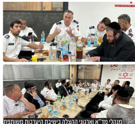
מנהלי מד"א וארגוני ההצלה בישיבת היערכות משותפת

הנהלת מגן דוד אדום ונציגי ארגוני ההצלה הפועלים עמה בשיתוף פעולה קיימו ישיבת היערכות משותפת כהיערכות לקראת הילולת הרשב"י בל"ג בעומר.