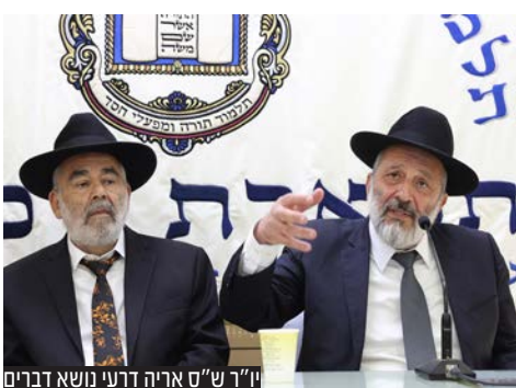
יו"ר ש"ס אריה דובי נשוא דברים

בקהילת "תפארת רפאל" שבתל אביב בראשות הרב שלמה זביחי שליט"א רב יהדות "משהד" ורב קהילת "תפארת רפאל" המשוכן כמידי שנה את מסורת 'יום שכולו תורה' ביום העצמאות בהשתתפות מאות אנשים ובשידור ישיר במדיה.