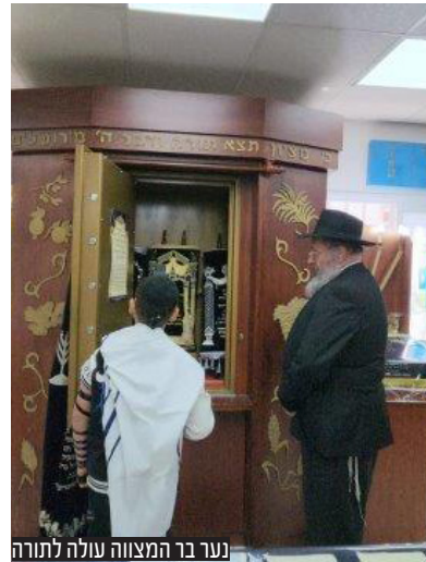
נער בר המצווה עולה לתורה