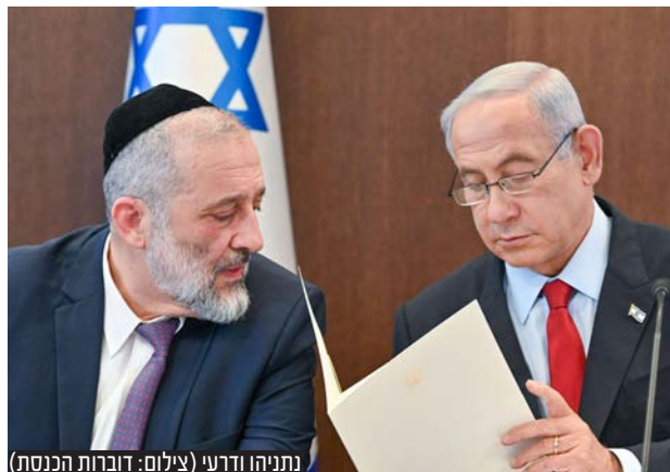
נתניהו ודרעי

במפלגות החרדיות מפנימים: למרות התחייבות מפורשת של נתניהו בהסכם הקואליציוני - חוק הגיוס לא יחוקק לפני אישור תקציב המדינה לשנים 2023-2024. אחד משרי ש"ס: "אם פסקת ההתגברות ממילא לא עברה כי כל הרפורמה הוקפאה ואם לא העברנו את חוק יסוד לימוד תורה, סביר להניח שבג"צ יפסול גם את חוק הגיוס החדש" | עמ' 11