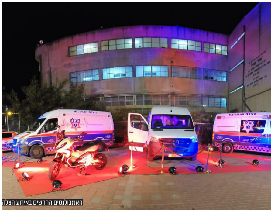
האמבולנסים החדשים באירוע הצלה