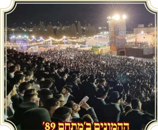
ההמונים ב'מתהם '89