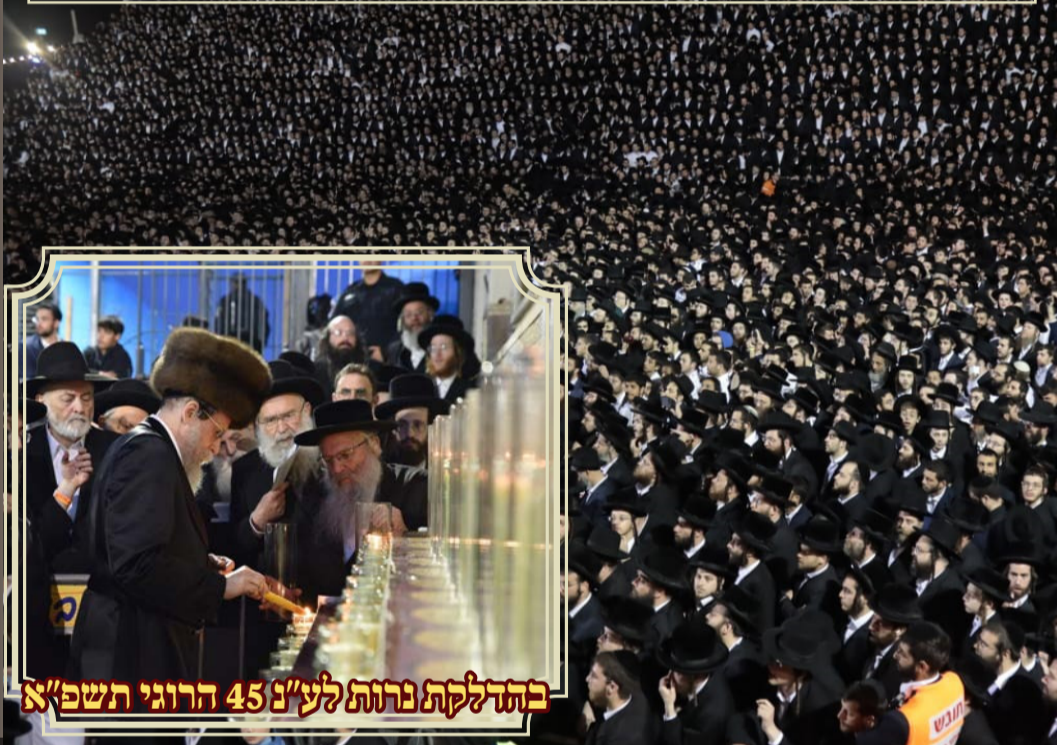
בהדלקת נרות לע"נ 45 הרוגי תשפ"א