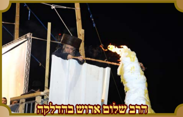
הרב שלום ארוש בהדלקה