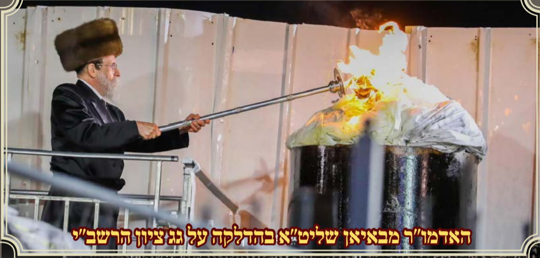
האדמו"ר מבאיאן שליט"א בהדלקה על גג ציון הרשב"י

מאות אלפים מכל רחבי הארץ עשו את דרכם בליל ל"ג בעומר ולמהרת היום לציונו של התנא האלוקי רבי שמעון בר יוחאי זיע"א. מראות מהר מירון מהילולא דבר יוחאי