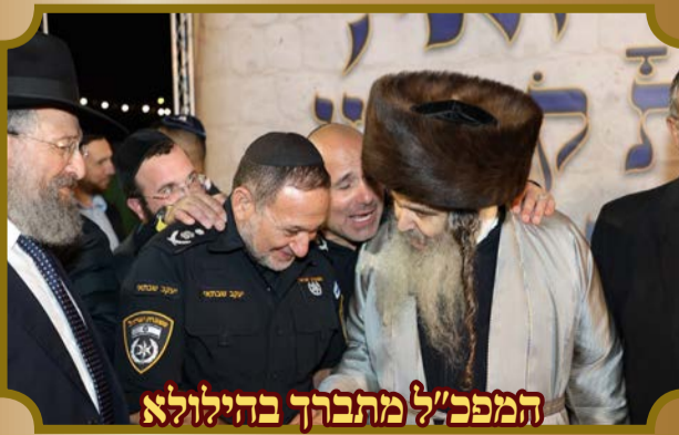
המפכ"ל מתברך בהילולא