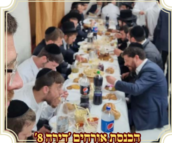
הכנסת אורחים 'דירה 8'