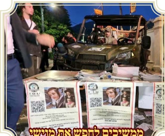
ממשיכים לחפש את מוישי