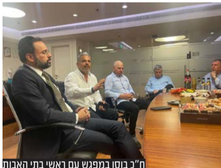
ח"כ בוסו במפגש עם ראשי בתי האבות

את הדברים הצהיר יו"ר ועדת הבריאות ח"כ הרב אוריאל בוסו בתום מפגש מקצועי שקיים כאורח איגוד בתי אבות, במרכז סיעוד ותיקים בני ברק, יחד עם נציגי רשתות בתי אבות