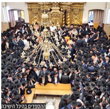
החסידים בהיכל הישיבה