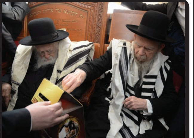
מרן רשכבה"ג רבי גרשון אדלשטיין צוקל" תורם לקרן 'צדקת רבי אהרון ליב' שע"י קופת העיר, כמנין שמו של רשכבה"ג מרן הגרא"ל שטיינמן צוקל"ל, לפני הלווייתו, יחד עם מרן רשכבה"ג הגר"ח קניבסקי צוקל"ל, כפי צוואת רבי עקיבא איגר - ליתן כמנין שמו בעת הלווייה.