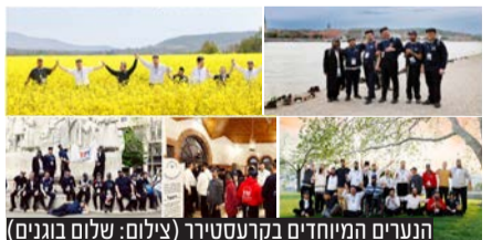
הנוער המיוחדים בקרעסטיר

עשרות דיירי מערך הדיור של 'אהל שרה', יצאו למסע חיזוק ותפילה על ציונו של ר' שיעלה מקרעסטיר בהונגריה