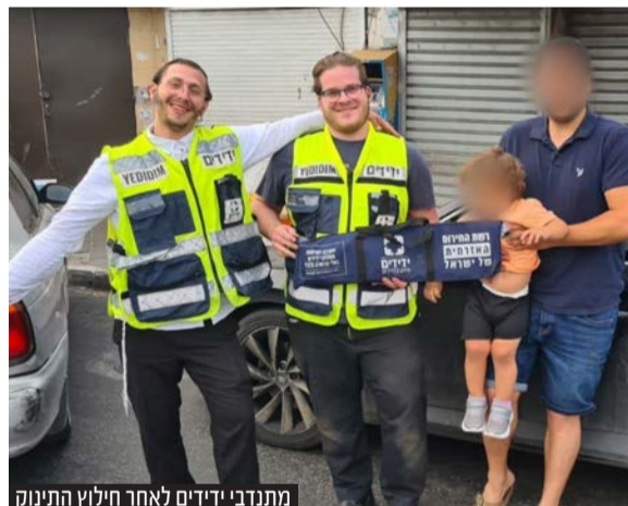
מתנדבי ידידים לאחר חילוץ התינוק

בידידים שבים וקוראים להורים לשאת עליהם את מפתח הרכב תמיד. במקרה של נעילת דלת רכב יש ליצור קשר עם מוקד ידידים במספר 1230 ללא כוכבית.