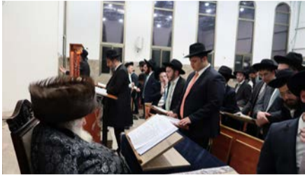
מאת: אריה שוורץ

זקן הפוסקים הגר"מ שטרנבוך, שהיה בישיבתו בבית שמש בחג השבועות וסיפר לתלמידיו מה ששמע מפיו של הגאון הקדוש ר' אלחנן וסרמן הי"ד לפני כתשעים שנה