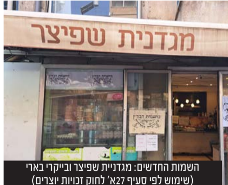
השמות החדשים: מגדניית שפיצר ובייקרי בארי (שימוש לפי סעיף 27 לחוק זכויות יוצרים)

לאחר שסניפים של אנג'ל בירושלים ובאשדוד נסגרו או החלו לעבוד כמאפייה פרטית, גם בבני ברק 2 המאפיות שפעלו עם המותג אנג'ל שינו את שמם ל"מגדניית שפיצר" ברח' חזון איש 2 ו"בייקרי בארי" ברח' בארי