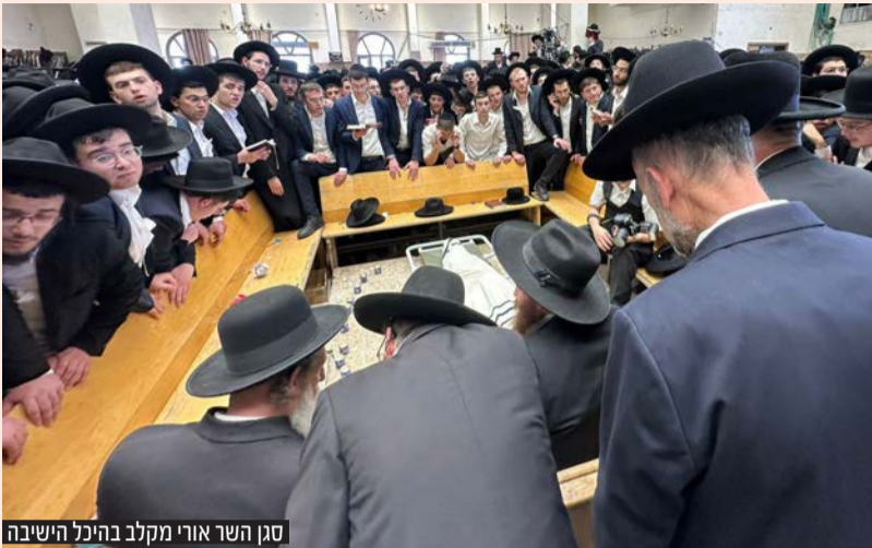
סגן השר אורי מקלב בהיכל הישיבה

סגן השר הרב אורי מקלב, מתלמידי מרן זצ"ל בישיבת פוניבז' בטור פרידה