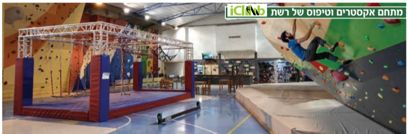
מתחם אקסטרים וטיפוס של רשת iClimb

קירות בהובלה | קירות באבטחה אוטומטית | קירות בולדר | מתחם נינג'ה