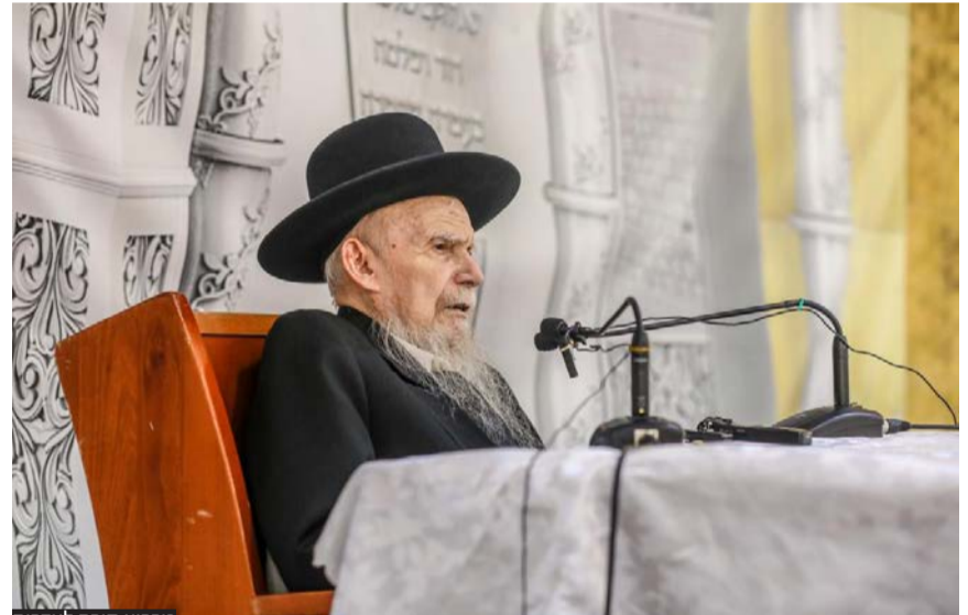
מרביץ תורה לעדרים

היחלשותם והסתלקותם של ראשי הישיבה זצ"ל, החל לשמש כראש הישיבה, במסירת שיחות ושיעורים כללים. במהלך כל השנים לא החסיר הגרי"ג יום אחד ממסירת השיעור כשהוא אינו מותר בשום מצב בעולם. ביום בו קם מה'שבעה' על אחיו הגאון רבי יעקב, כבר מסר בשעה 12 את השיעור הקבוע, כשאף בימי ה'שבעה' ביקש מידו הגדול רעו לראשות הישיבה שיבלחט"א הגרב"ד פוברסקי, שימלא את מקומו באמירת השיעורים. בשנות תש"ס אף הרחיב את שיעוריו היומיים גם לימי הבין הזמנים, ומאז הוא מסר אותם בביתו מדי יום ביומו. השיעור נמשך עם כל משתתפיו מדי יום, אפילו ביום בדיקת חמץ. כמידי שבוע בימי שלישי הוא מסר שיחת חיזוק לתלמידיו בביתו, השיחה מודפסת בעלון "דרכי החיזוק" שיוצא מדי שבוע ומופץ בעשרות אלפי עותקים. בישיבת פוניבז' שימש מרן זצ"ל כבעל תוקע למעלה משבעים שנה, כשאף בשנה האחרונה שימש כבעל תקיעה, כשאלפים היו נוהרים לשמוע את התקיעות המהודרות.