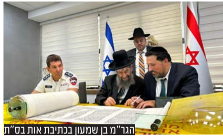
הגר"מ בן שמעון בכתובת את ס"ת

רבה הספרדי של ב"ב הגאון הרב מסעוד בן שמעון שהשתתף במעמד בירך ואמר: "כל אחד מכם אנשי מד"א עושה את הנעשה לפני הנשמע. מקבל את הקריאה ולא יודע לקראת מה הוא הולך, אבל הוא אומר נעשה" • מנכ"ל מד"א, אלי בין: "בעז"ה נחנך בקרוב בית כנסת נוסף גדול ומכובד בקרית מד"א - עם ספרי תורה רבים"