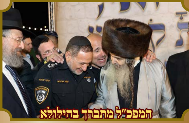
המפכ"ל מתברך בהילולא