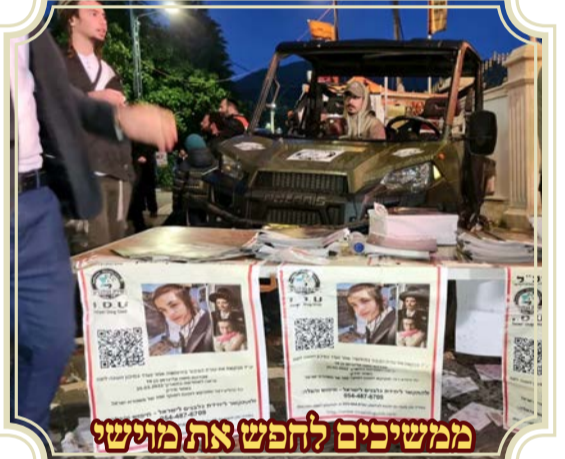
ממשיכים לחפש את מוישו