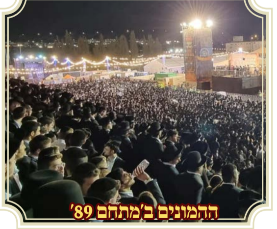
ההמונים ב'מתחם '89