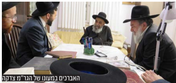
האברכים במעון של הגר"מ צדקה

בהוראת הגר"מ צדקה ייפתח סמינר חדש כבר בחודש אלול הקרוב בשכונת נווה יעקב