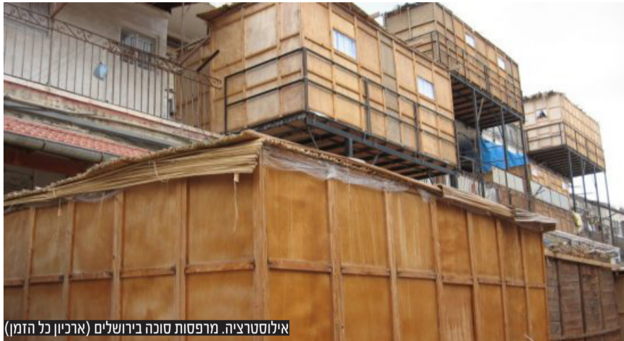
אילוסטרציה. מרפסות סוכה בירושלים

על פי הסיכום, שנחשף בדיני חוק ההסדרים בוועדת הפנים של הכנסת, מינהל התכנון יבהיר לכלל הוועדות המקומיות בארץ, כי כל עוד מדובר במרפסת פתוחה לשמים כהגדרת סוכה כהלכתה, תוכל הוועדה המקומית להעניק היתר בניה גם מחוץ לזכויות הבניה כל עוד