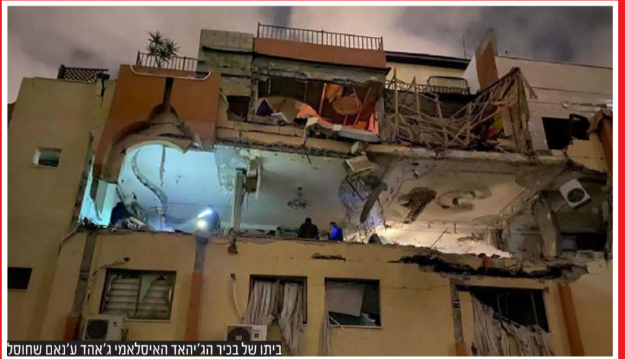
ביתו של בכיר הג'יהאד האיסלאמי ג'אהד ע'נאם שחוסל