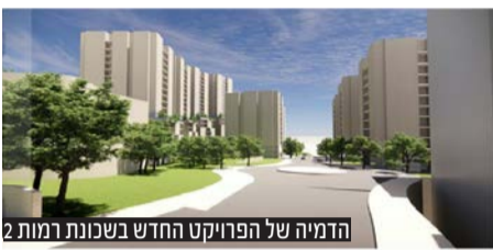
הדמיה של הפרויקט החדש בשכונת רמות 2

לאפשר אמצעים שיקלו על נגישות הולכי רגל לעבור בין מתחמי הבינוי של התכנית, עקב הטופוגרפיה המאפיינת אזור זה של העיר ירושלים.