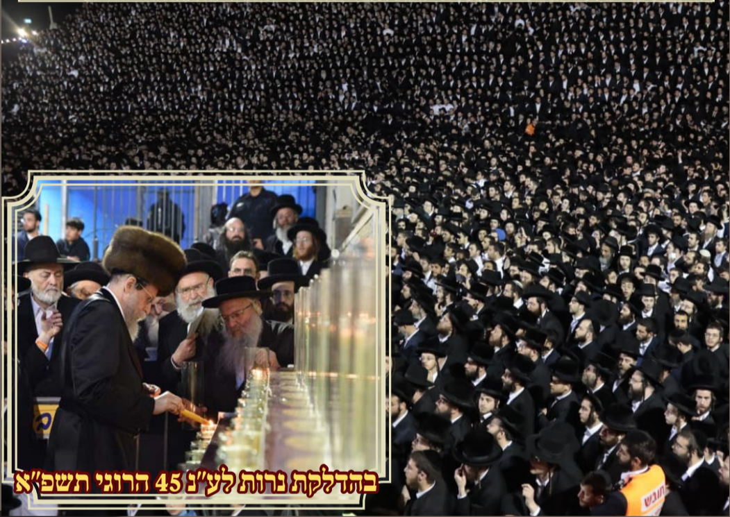
בהדלקת נרות לע"נ 45 הרוגי תשפ"א