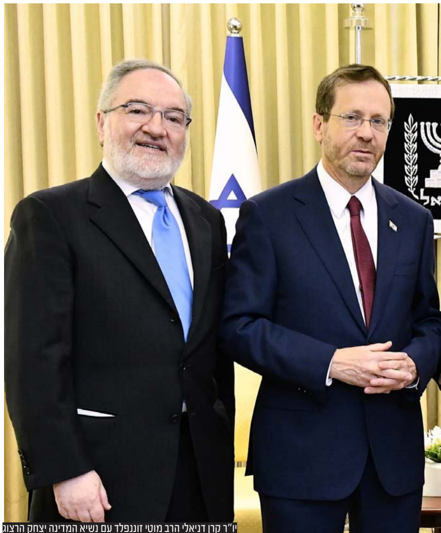
ד"ר קרן דניאלי הרב מוטי זוננפלד עם נשיא המדינה יצחק הרצוג

ביוזמת קרן דניאלי ובשיתוף מכבי: גם השנה, מעל 200,000 חברי מכבי הצביעו עד כה במיזם רופא עם לב - לבחור את הרופאים שמגיע להם תודה • הענקת הפרס נועדה להעצים את המוטיבציה בקרב כלל הרופאים והאחיות לשלב מקצועיות עם נשמה ולהגביר את המודעות העצומה וחשיבותה של האהבה והאנושיות כחלק בלתי נפרד מטיפול רפואי מקצועי