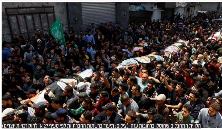
הלוחים המחבלים שחוסלו ברחובות עזה

שלושה מפקדים בכירים בג'יהאד האסלאמי ברצועת עזה חוסלו במיטותיהם בלילה שבין שני לשלישי. במהלך הלוחמה של המחבלים איימו בג'יהאד האיסלאמי לפתוח במתקפה נגד ישראל ובמערכת הביטחון נערכים לגל של ירי לעבר ערי הדרום. גם בחמאס ובחיזבאללה הצהירו שבכוונתם להצטרף למתקפה על ישראל