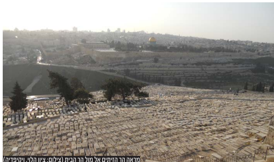
מראה הר הזיתים אל מול הר הבית

יוצא מן הכלל, נמצאות המושכות בידיהם של שומרי תורה ומצוות. ולכן, עכשיו, כשכל הרשויות הרלוונטיות נמצאות בשליטה של יהודים שומרי תורה ומצוות - זה הזמן לעשות מעשה ולשקם את ההריסות בהר הזיתים. אם עכשיו, כשיש בידינו את היכולת לא נעשה שום דבר, איך נוכל לרחוץ בניקיון כפינו ולומר שאין לנו אחריות למה שקורה שם, בבית הקברות היהודי העתיק בעולם, השוכן בעיר הקודש והמקדש, מול מקום המקדש, ושועלים הילכו בו בגו זקוף וברגל גסה".