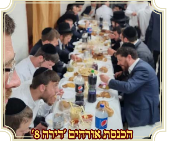
הכנסת אורחים 'דירה 8'