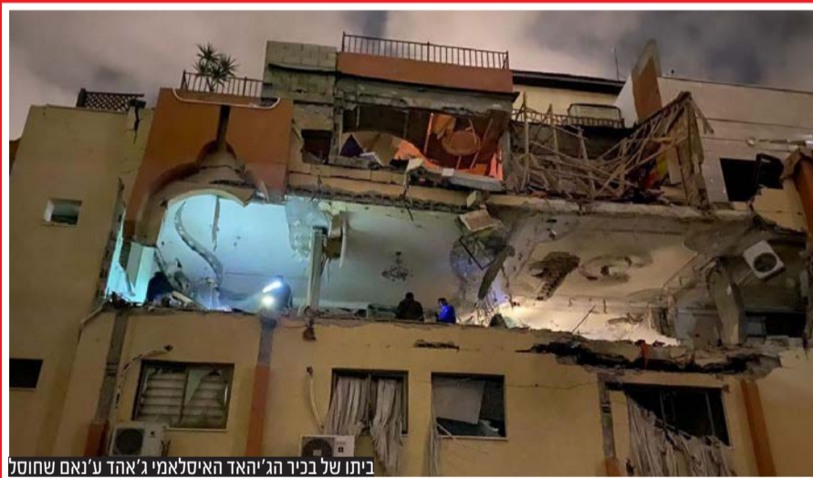
הלוחים המחבלים שחוסלו ברחובות עזה