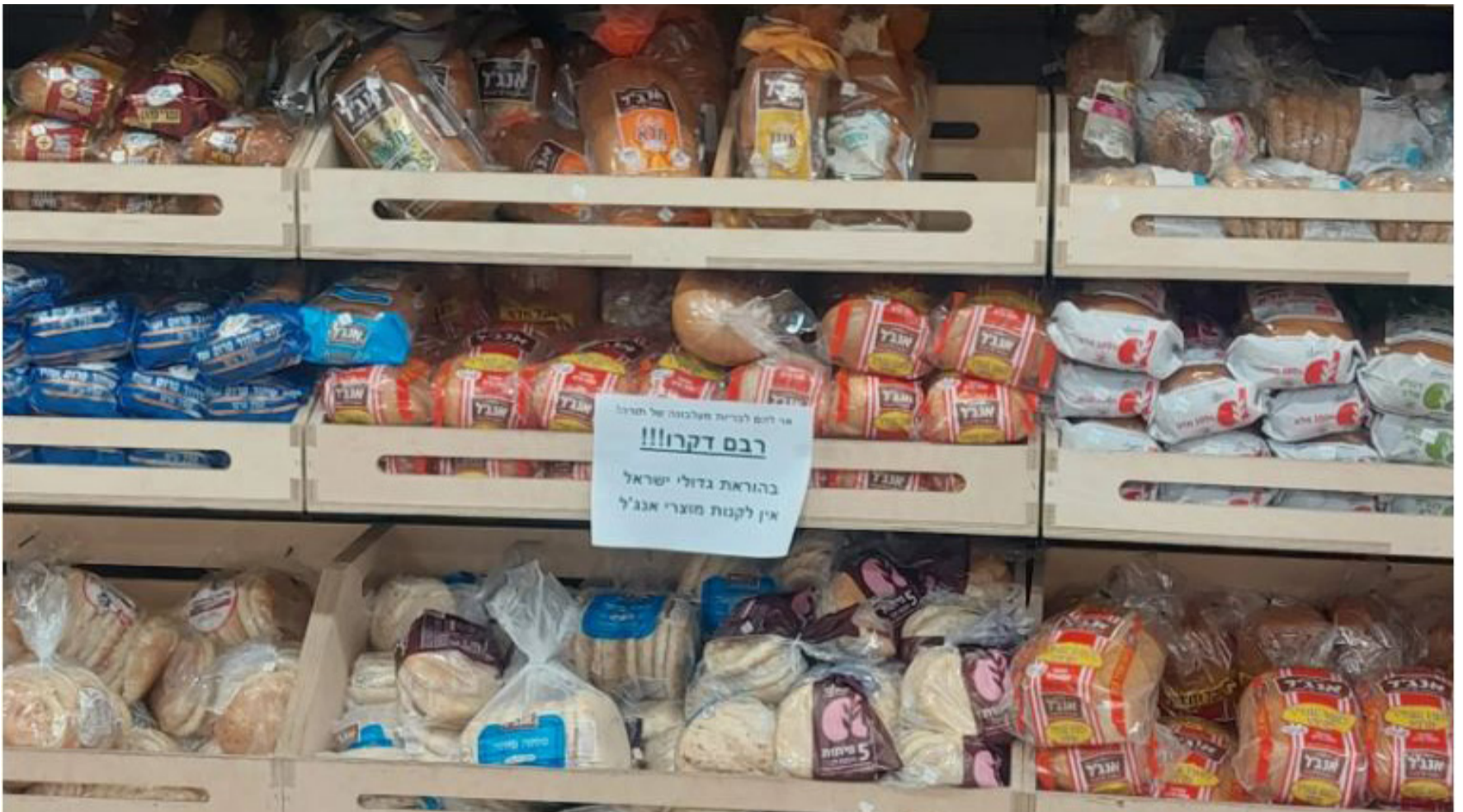
מחאה אפקטיבית שמעבירה את המסר. הלחמים המיומנים של אנג'ל

ממש כשם שאף אחד לא מצפה מנכדיו של נשיא בג"ץ בדימוס אהרן ברק לרכוש מוצרים מאלו שמפגינים מול ביתו של הסבא, כך להבדיל אי אפשר לצפות מאדם חרדי לקנות מוצרים מחברה שבראשה עומד אדם שהפגין מול ביתו של גדול הדור.