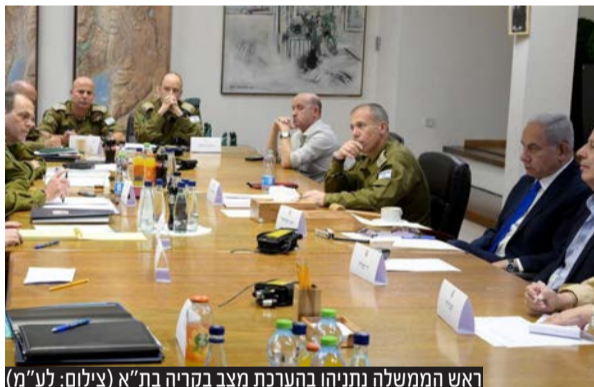
ראש הממשלה נתניהו בהערכת מצב בקריה בת"א