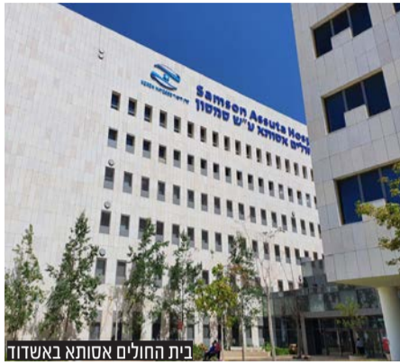
בית החולים אסותא באשדוד

תלמיד ישיבה, תושב ירושלים בן 16 האלרגי לחלב, טעם גלידת פרווה אך אז התברר כי היא חלבית. לאר שפיתח תגובה חריפה, רופאי בית החולים אסותא באשדוד, נאלצו להרדימו ולהנשימו • בית החולים מזהירים את הסובלים מאלרגיות: "אל תלכו בלי מזרק אפיפן"