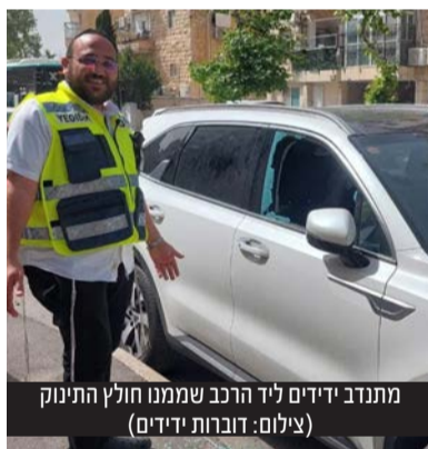
מתנדב ידידים ליד הרכב שממנו חולץ התינוק