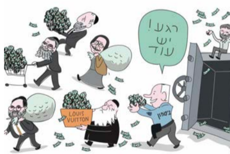
הקריקטורה של בידרמן בעיתון 'הארץ'