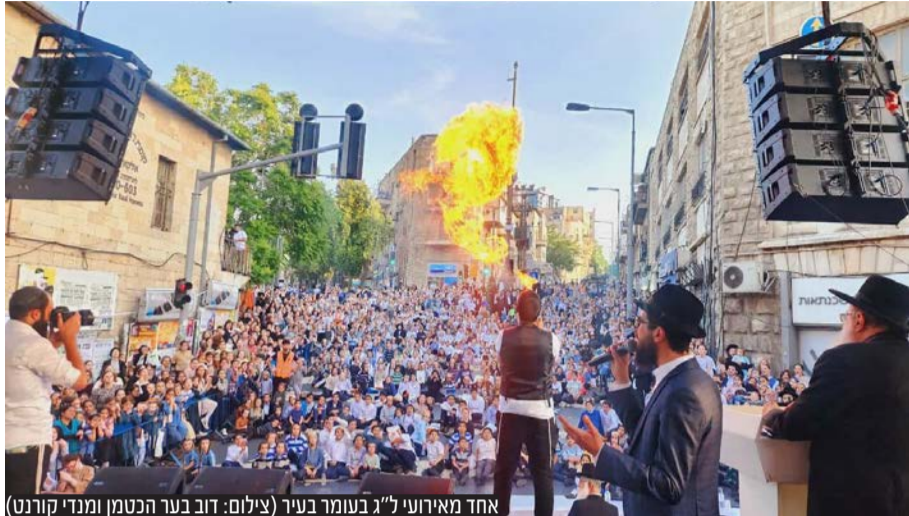
אחד מאירועי ל"ג בעומר בעיר