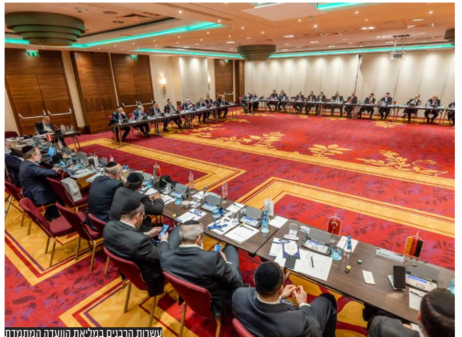
נשרות הרבנים במליאת הועדה המתמדת

הדין באירופה ובישראל חד משמעית ולא תשתנה לעולם; גיורים מתבצעים אך ורק ע"י בי"ד חשוב וקבוע, לא יאושרו גיורים שיבוצעו ע"י 'רבנים' ה'מיובאים' למבצע גיור ולא יבוצע גיור במקומות בהם אין תשתית לחיים קהילתיים יהודיים - גיור שלא יבוצע כדת וכדין וכפי סדרי הנהגה והמתווה שהיה נהוג עד כה ע"י בתי הדין של אירופה בשיתוף פעולה עם הרה"ר לישראל לא יוכר על ידינו כל עיקר". הרבנים קיימו דיון על הקמת מאגר מידע ממוחשב של בתי הדין והקמת מרכז מידע לרבנים מסדרי קידושין על שאלות יוחסין.