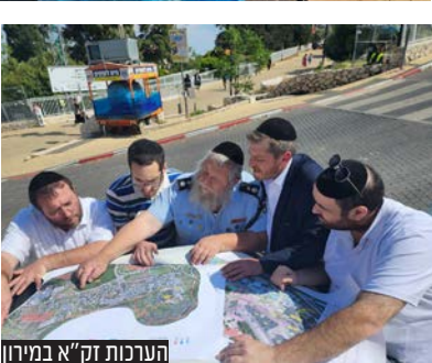
היערכות זק"א במירון

זק"א בציר העלייה המרכזי לצינון של הרשב"י ובמתחם המורחב החדש, עשרות אלפי 'תגי זיהוי' אשר יוצמדו לידי הילדים העולים מירונה, כאשר על התג מופיעים פרטי הילד וכתובת מגוריו עם מספר טלפון של מלוויו הנמצאים במירון. כדי להקל על איתור מהיר של ההורים. רעיון יצירתי שהוכח כמוצלח ביותר באיתור ילדים אובדים ובהקניית שקט להורים".