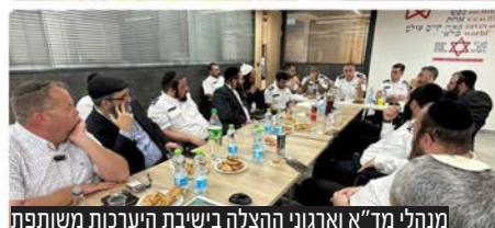
מנהלי מד"א וארגוני ההצלה בישיבת היערכות משותפת

הנהלת מגן דוד אדום ונציגי ארגוני ההצלה הפועלים עמה בשיתוף פעולה קיימו ישיבת היערכות משותפת כהיערכות לקראת הילולת הרשב"י בל"ג בעומר.