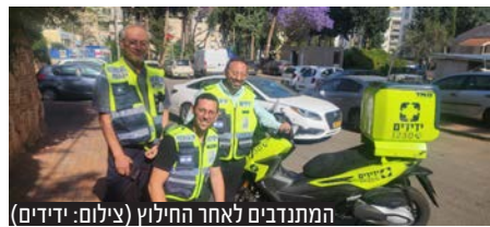
המתנדבים לאחר החילוץ