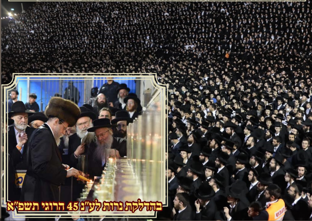
בהדלקת נרות לע"נ 45 הרוגי תשפ"א