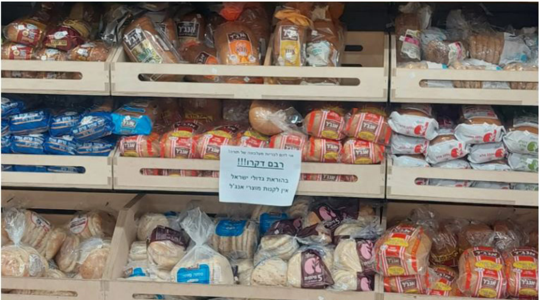
מחאה אפקטיבית שמעבירה את המסר. הלחמים המיומנים של אנג'ל

ממש כשם שאף אחד לא מצפה מנכדיו של נשיא בג"ץ בדימוס אהרן ברק לרכוש מוצרים מאלו שמפגינים מול ביתו של הסבא, כך להבדיל אי אפשר לצפות מאדם חרדי לקנות מוצרים מחברה שבראשה עומד אדם שהפגין מול ביתו של גדול הדור.