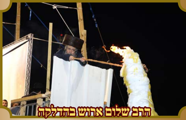
הרב שלום ארוש בהדלקה