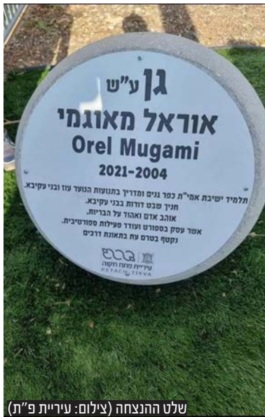
שלט ההנצחה

לפני כשנתיים תושבי פתח תקווה הזדעזעו לשמע תאונה קשה שקרתה בכביש 40 סמוך לשכונת שעריה. אוראל מאוגמי, תלמיד בישיבת אמי"ת כפר גנים, נהרג בתאונת דרכים.