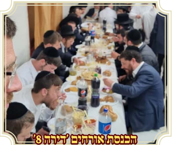
הכנסת אורחים 'דירה '8