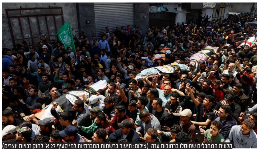
הלוחים המחבלים שחוסלו ברחובות עזה

שלושה מפקדים בכירים בג'אהד האיסלאמי ברצועת עזה חוסלו במיטותיהם בלילה שבין שני לשלישי. יממה לאחר החיסולים שפתחו את מבצע 'מגן וחץ', החל הגא"פ במטחי רקטות וטילים לעבר יישובי עוטף עזה ועד מהרה התרחב הירי לערי הדרום והמרכז. גם בחמאס ובחיזבאללה הצהירו שבכוונתם להצטרף למתקפה על ישראל | עמ' 12