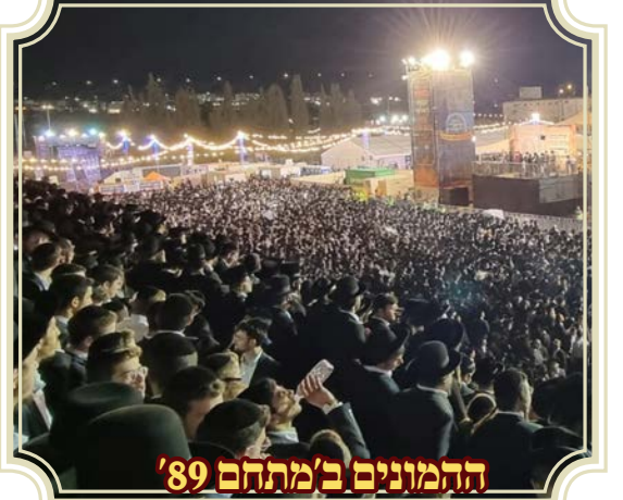
ההמונים ב'מתחם '89