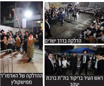
ההדלקה של האדמו"ר ממישקולץ

חלק מהמקומות בהם נערכה הדלקה בחסות היחידה - בת"ת דרך ישרים, בת"ת ברכת יעקב, בבית המדרש בית אהרון - בעזר, במישקולץ, בקהילת ליעזנסק, בקהילת איילת השחר, קהילת גור, קהילת הבעש"ט, בת"ת פרי מגדים, בת"ת שירת התורה, בקהילת המשוררים, בקהילת חב"ד בשוק ועוד.