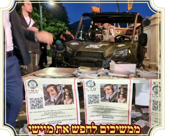
ממשיכים לחפש את מוישי