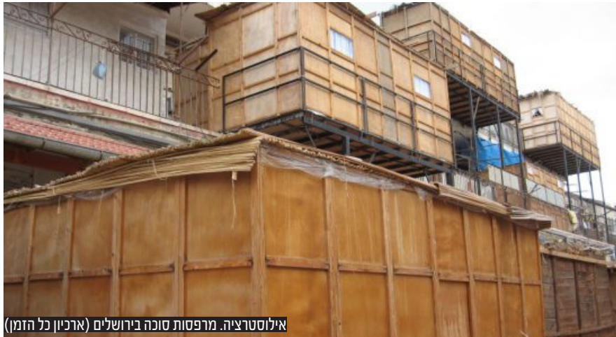
אילוסטרציה. מרפסות סוכה בירושלים (ארכיון כל הזמן)

על פי הסיכום, שנחשף בדיוני חוק ההסדרים בוועדת הפנים של הכנסת, מינהל התכנון יבהיר לכלל הוועדות המקומיות בארץ, כי כל עוד מדובר במרפסת פתוחה לשמים כהגדרת סוכה כהלכתה, תוכל הוועדה המקומית להעניק היתר בניה גם מחוץ לזכויות הבניה כל עוד