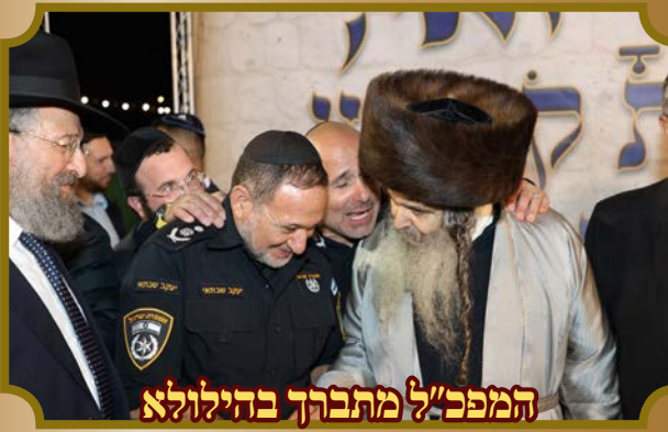
המפכ"ל מתברך בהילולא