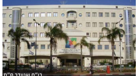
ב"ח שניידר פ"ת

יאיר בן ה-8 שאף צפצפה לריאותיו ונזקק לטיפול חירום במרכז שניידר