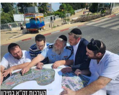
היערכות זק"א במירון

זק"א בציר העלייה המרכזי לצינון של הרשב"י ובמתחם המורחב החדש, עשרות אלפי 'תגי זיהוי' אשר יוצמדו לידי הילדים העולים מירונה, כאשר על התג מופיעים פרטי הילד וכתובת מגוריו עם מספר טלפון של מלוויו הנמצאים במירון. כדי להקל על איתור מהיר של ההורים. רעיון יצירתי שהוכח כמוצלח ביותר באיתור ילדים אובדים ובהקניית שקט להורים."