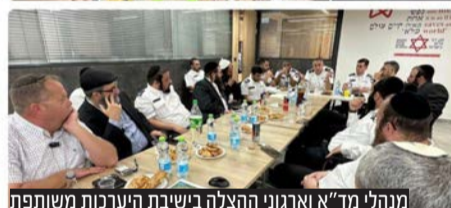
מנהלי מד"א וארגוני ההצלה בישיבת היערכות משותפת

הנהלת מגן דוד אדום ונציגי ארגוני ההצלה הפועלים עמה בשיתוף פעולה קיימו ישיבת היערכות משותפת כהיערכות לקראת הילולת הרשב"י בל"ג בעומר.