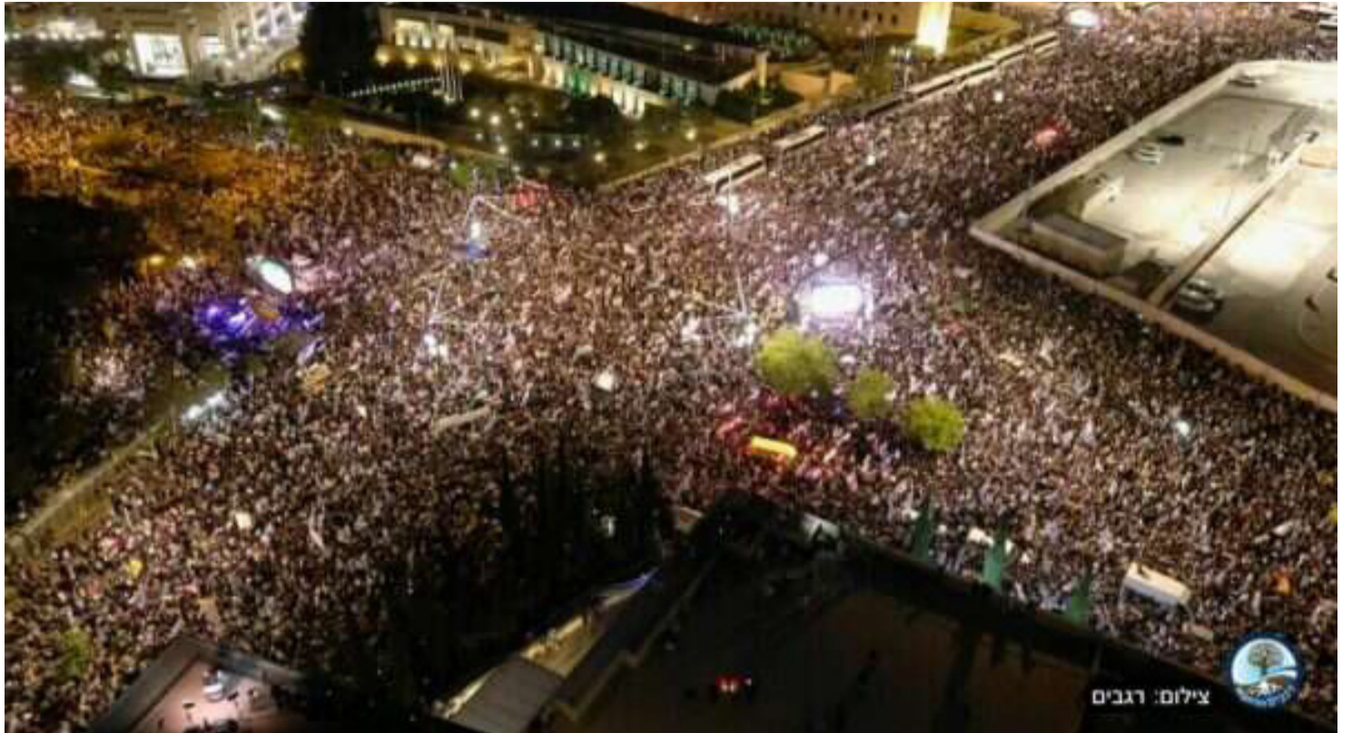
ההפגנה הגדולה ביותר עד כה. מחאת הימין בירושלים

» על רקע ההכרזות הללו נפתח כנס הקיץ בו תידרש הכנסת לאשר את תקציב המדינה. על פניו, התחייבה הקואליציה לסייעות החרדיות להעביר את חוק הגיוס במקביל לתקציב. אולם בש"ס וגם ביהדות התורה הודיעו עקרונית לראש הממשלה כי עקב גל ההסתה (וגם עקב ההבנה שאין משמעות אמיתית לחוק הגיוס בטרם עברה הרפורמה המשפטית, ולמצער פסקת ההתגברות, הקריטית כדי למנוע שוב פסילה של החוק בבג"ץ) הם מוכנים לדחות את החקיקה במספר חודשים