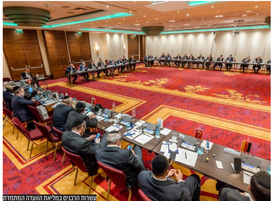
נשרות הרבנים במליאת הועדה המתמדת

הדין באירופה ובישראל חד משמעית ולא תשתנה לעולם; גיורים מתבצעים אך ורק ע"י בי"ד חשוב וקבוע, לא יאושרו גיורים שיבוצעו ע"י 'רבנים' ה'מיובאים' למבצעי גיור ולא יבוצע גיור במקומות בהם אין תשתית לחיים קהילתיים יהודיים - גיור שלא יבוצע כדת וכדין וכפי סדרי הנהגה והמתווה שהיה נהוג עד כה ע"י בתי הדין של אירופה בשיתוף פעולה עם הרה"ר לישראל לא יוכר על ידינו כל עיקר". הרבנים קיימו דיון על הקמת מאגר מידע ממוחשב של בתי הדין והקמת מרכז מידע לרבנים מסדרי קידושין על שאלות יוחסין.