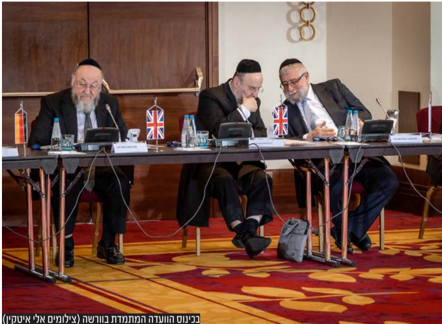
בכינוס הועדה המתמדת בורשה

בדיונים בדרכי חיזוק הקהילות והמאבק בחקיקה האנטי דתית באירופה בראשות נשיא הועדה הגר"פ גולדשמידט ויו"ר הועדה המתמדת אב"ד לונדון הגר"מ געללעי משתתפים רבני המדינות וערים, אבות בתיה"ד ודיינים ממרבית מדינות האיחוד האירופי • בפני המשתתפים הובא מכתבם המיוחד של מרן ראש הישיבה הגר"ג אדלשטיין שליט"א ומרן הגר"ד לנדו שליט"א • הרבנים ייפגשו עם יו"ר הסנאט נציג הנשיא ודיפלומטים ויבקרו במוסדות הקהילה המארחת פליטים מאוקראינה