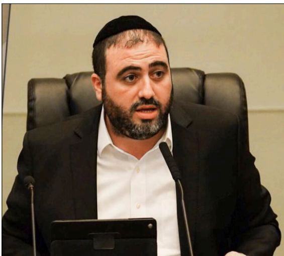
« מסתער על הדרכונים. שר הפנים והבריאות ה"כ משה ארבל

ובכל זאת, לא פורסם כל מכתב רשמי בנושא, אולי מדיון 'מוטב יהיו שוגגין' ואולי משום 'כשם שמצווה לומר דבר הנשמע'. יש גם מקום להניח שכמו בכל עיסוק פומבי אחר הנוגע לרפורמה, מבכרים גדולי ישראל שלא להציב את המגזר החרדי בחזית המאבק, בניגוד גמור לניסיון הנואש של מובילי המחאה למצב אותה כמאבק של 'חרדים נגד חילונים'. כך במאבקם החדש למען גיוס בחורי הישיבות שהוכרו בסוף השבוע, כך בתהלוכה שערכו לבני ברק והסתיימה בקעריות צ'ולנט וכך בהפחדות החוזרות ונשנות מפני מדינת הלכה, רחמנא ליצלן