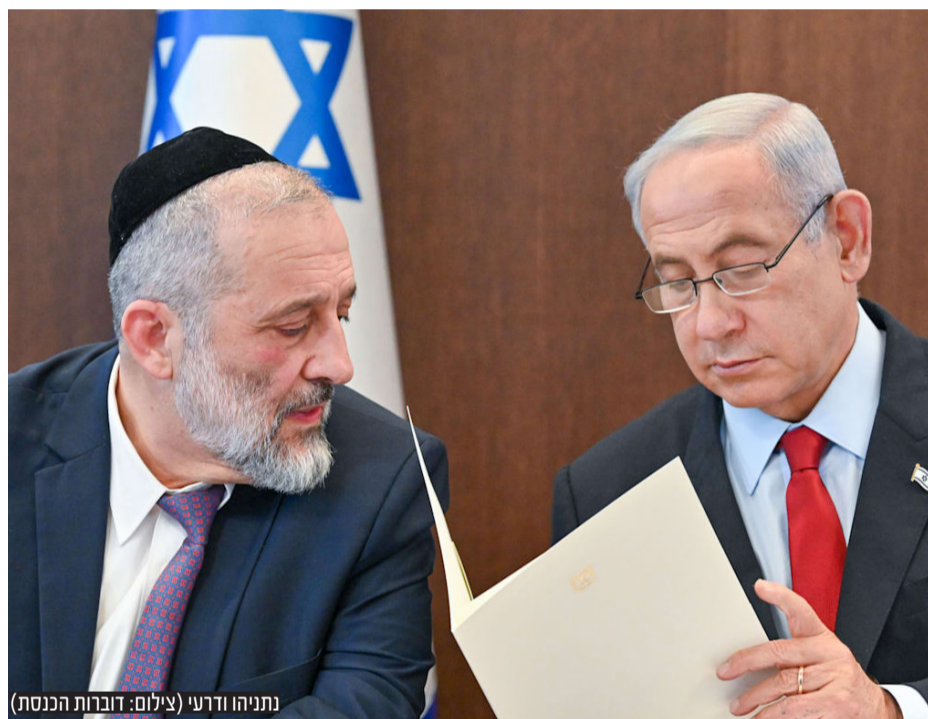
נתניהו ודרעי

במפלגות החרדיות מפנימים: למרות התחייבות מפורשת של נתניהו בהסכם הקואליציוני - חוק הגיוס לא יחוקק לפני אישור תקציב המדינה לשנים 2023-2024. אחד משרי ש"ס: "אם פסקת ההתגברות ממילא לא עברה כי כל הרפורמה הוקפאה ואם לא העברנו את חוק יסוד לימוד תורה, סביר להניח שבג"צ יפסול גם את חוק הגיוס החדש, כך שבכל מצב נמצא את עצמנו חוזרים לאותה נקודה. בנושא כה רגיש שעתיד עולם התורה תלוי בו, מוטב לפעול בחוכמה"