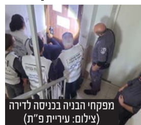
מפקחי הבניה בכניסה לדירה

למבנה מסחרי שהוצב באופן ארעי ברחוב רוטשילד, כאשר פחות מ-24 שעות בוצעה הריסה עצמית. ראש העיר