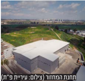
תחנת המחזור