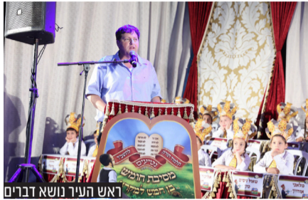
ראש העיר נישא דברים