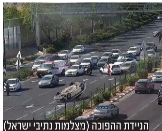
הניידת ההפוכה

המשטרה עצרה קטין תושב ג'נין בחשד לגניבת רכב בפ"ת • באירוע נוסף של מרדף אחר חוליית גנבי רכב, ניידת השיטור התהפכה והשוטרים נזקקו לטיפול רפואי