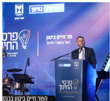
השר חיים ביטון בכנס

השר במשרד החינוך, חיים ביטון העניק תעודות הצטיינות למנהלים ומנהלות פורצי דרך ומוסדות מהמגזר החרדי במסגרת 'פרס החינוך הארצי' לשנת תשפ"ג