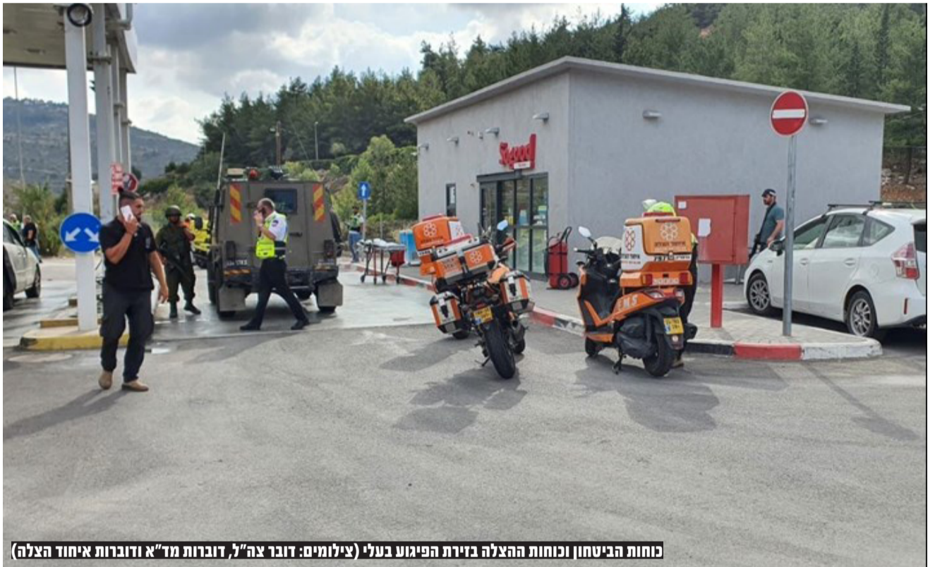
כוחות הביטחון וכוחות ההצלה בזירת הפיגוע בעלי (צילומים: דובר צה"ל, דוברות מד"א ודוברות איחוד הצלה)