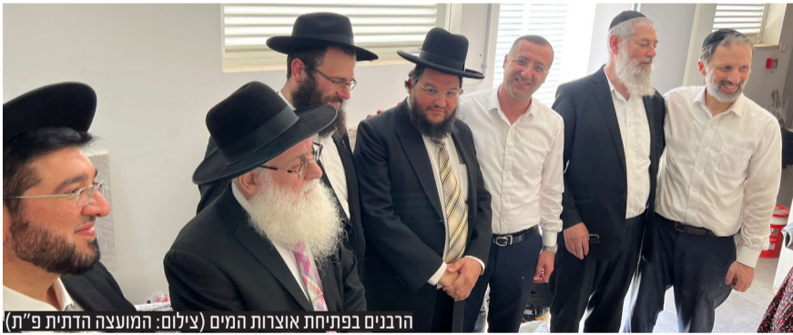
הרבנים בפתיחת אוצרות המים

השבוע התקיים במקום טקס פתיחת אוצרות המים בהשתתפות רבנים ואישי ציבור