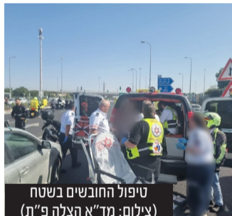
טיפול החובשים בשטח