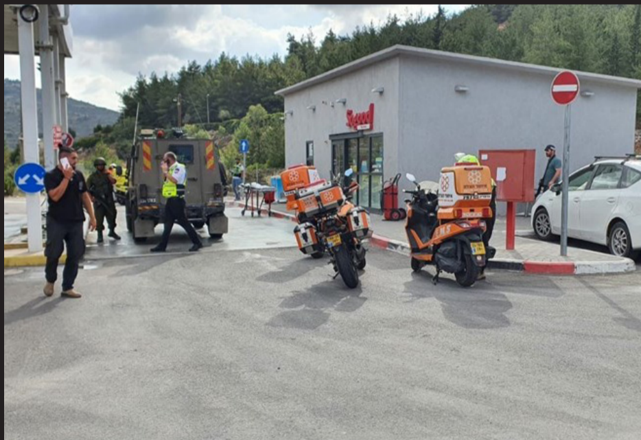
כוחות הביטחון וכוחות ההצלה בזירת הפיגוע בעלי

ביהמ"ד גבוה לדיינות "ברכת אברהם" ירושלים גם השנה, לקראת חודש אלול, נוספו מספר מקומות לאברכים מצויינים במיוחד, לכולל חושן משפט בעיון ישיבתי אליבא דהלכתא, בשכונת רמות. לאברכים בני ספרד בגילאי 22 - 38. מלגה של 4200 שקלים. לפרטים והרשמה: 052-766-8236