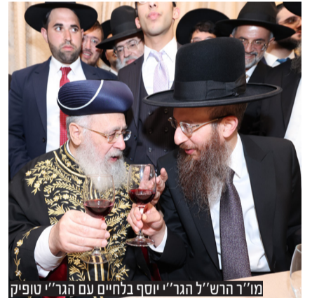
מור"ר הרש"ל הגר"י יוסף בלחיים עם הגר"י טופיק