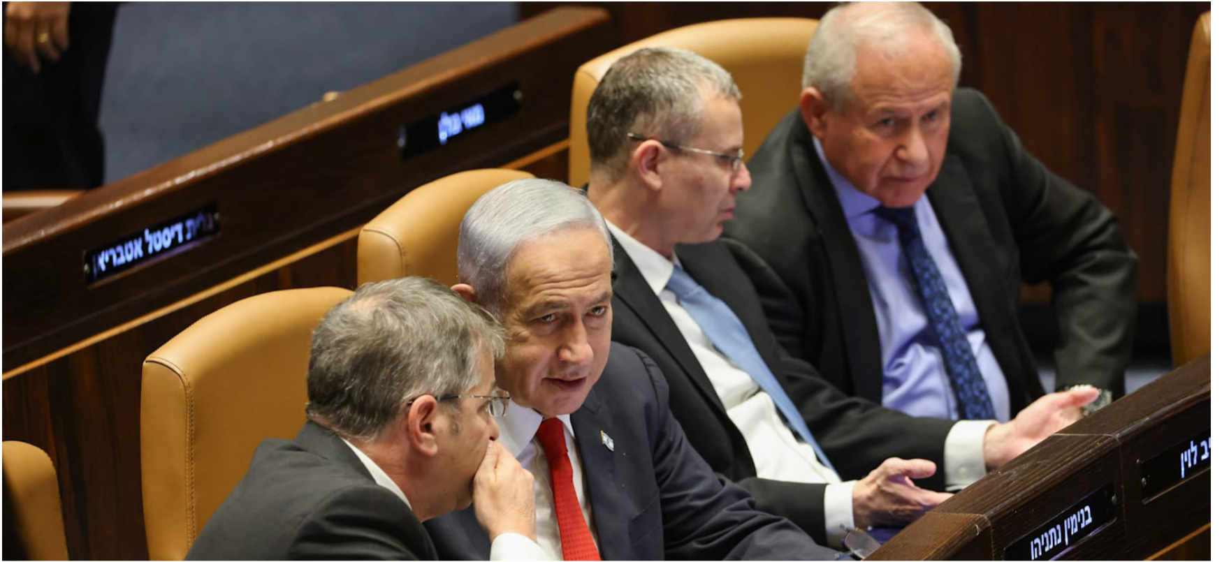
הפתעה צפויה מראש, הצבעה במליאת הכנסת

» במשך חודשים ארוכים, מרשה לעצמו כל צרוע וכל זב בפוליטיקה ובתקשורת ובכלל לחבוט בציבור החרדי מכל זווית אפשרית. יום אחד זה כדורגלן עבר מתוסכל שקיבל משבצת טלוויזיונית, ובמשנהו צצה מגישה אחרת שמכנה את כולנו "מוצצי דם". במקרה אחד זה ראש שב"כ כושל לשעבר שמכנה את הנציגות החרדית ג'יהאד, ובמקרה אחר צץ פעיל תימהוני של 'אחים לנשק' וזורק חבילות של שטרות מדומים על צעירים חרדים.