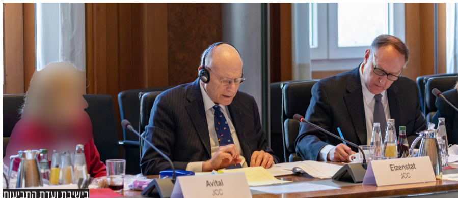
בישיבת ועדת התביעות

מימון שעות סיעוד לניצולי שואה יגדל ב 105.2 מיליון דולר נוספים ויגיע לסכום כולל של $888.9 מיליון; תוספת תשלום שנתית לזכאי קרן הסיוע תמשך עד 2027, עבור למעלה מ-128,000 ניצולי שואה ברחבי העולם