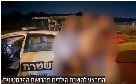
המבצע להשבת הילדים מהרשות הפלסטינית. עוד חזון למועד, אבל העיקר הוא שהילדים נמצאים כעת בחיק אימם, במקום בטוח, ואנו בטוחים שהם יגדלו לתפארת עם ישראל וירו אותה נחת יהודי רב.

הפלסטינית בעיר בצפון השומרון המזוהה עם גורמי הטרור והועברו לידי מפקדת התיאום והקישור, שם חיכתה להם אימם. הפגישה בין האם לילדיה הייתה בלתי ניתנת לתיאור.