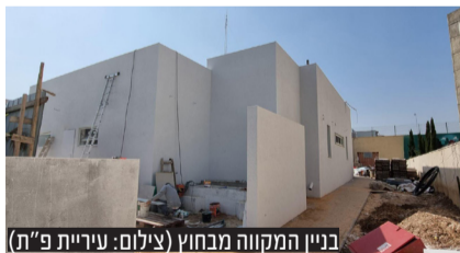
בניין המקווה מבחוץ