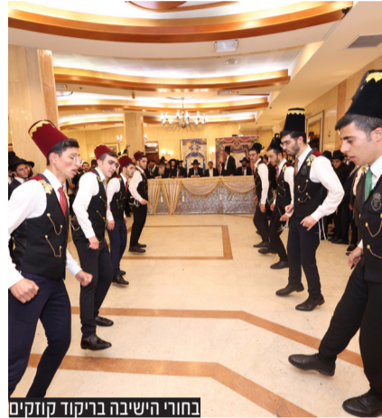
בחורי הישיבה בריקוד בחתונה