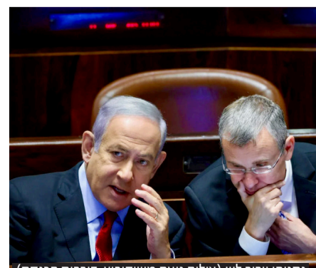
נתניהו ויריב לוין

בעקבות ההצהרה המשותפת של לפיד וגנץ על הקפאת השיחות בבית הנשיא, הודיע נתניהו בישיבת הממשלה: "בהתאם למנדט שקיבלנו - נעשה תיקונים במערכת המשפט" • בארגוני המחאה נערכים להפגנות ולשיבוש החיים של אזרחי ישראל | עמ' 10