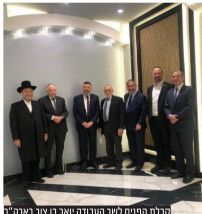
קבלת הפנים לשר העבודה יואב בן צור בארה"ב

במפגש קבלת הפנים בניו יורק השתתפו ראשי הוועד הבינלאומי להגנת הר הזיתים • ראשי הוועד הודו לשר הרב בן צור על פעילותו רבת השנים למען ההר עוד בהיותו יו"ר השדולה בכנסת ובכל תפקידיו הציבוריים • השר הדגיש כי ימשיך לעמוד לימין הוועד ויודא שההר מקבל את היחס המתאים