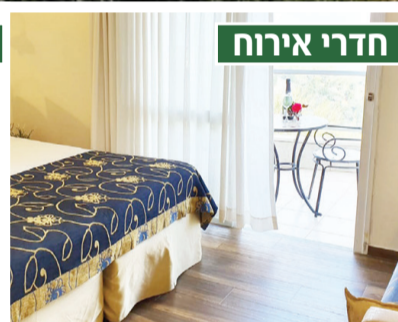
*האירוח כולל ארוחת בוקר בלבד