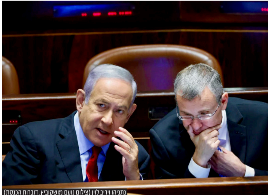
נתניהו ויריב לוין

באופוזיציה לא ידעו כיצד להגיב. לפיד וגנץ שהכריזו עוד טרם ההצבעה על כוונתם לתת הצהרה משותפת, נעמדו מול המיקרופון והכריזו: השיחות בבית הנשיא מושהות. הסיבה, לטענתם, מאחר ולא נבחר נציג לקואליציה וממילא אין כוונת שר המשפטים לכנס את הוועדה, המשמעות היא שאין ועדה ואם אין ועדה אין שיחות. בקואליציה מיהרו להאשים את גנץ ולפיד בפיצוץ השיחות. בליכוד טענו כי