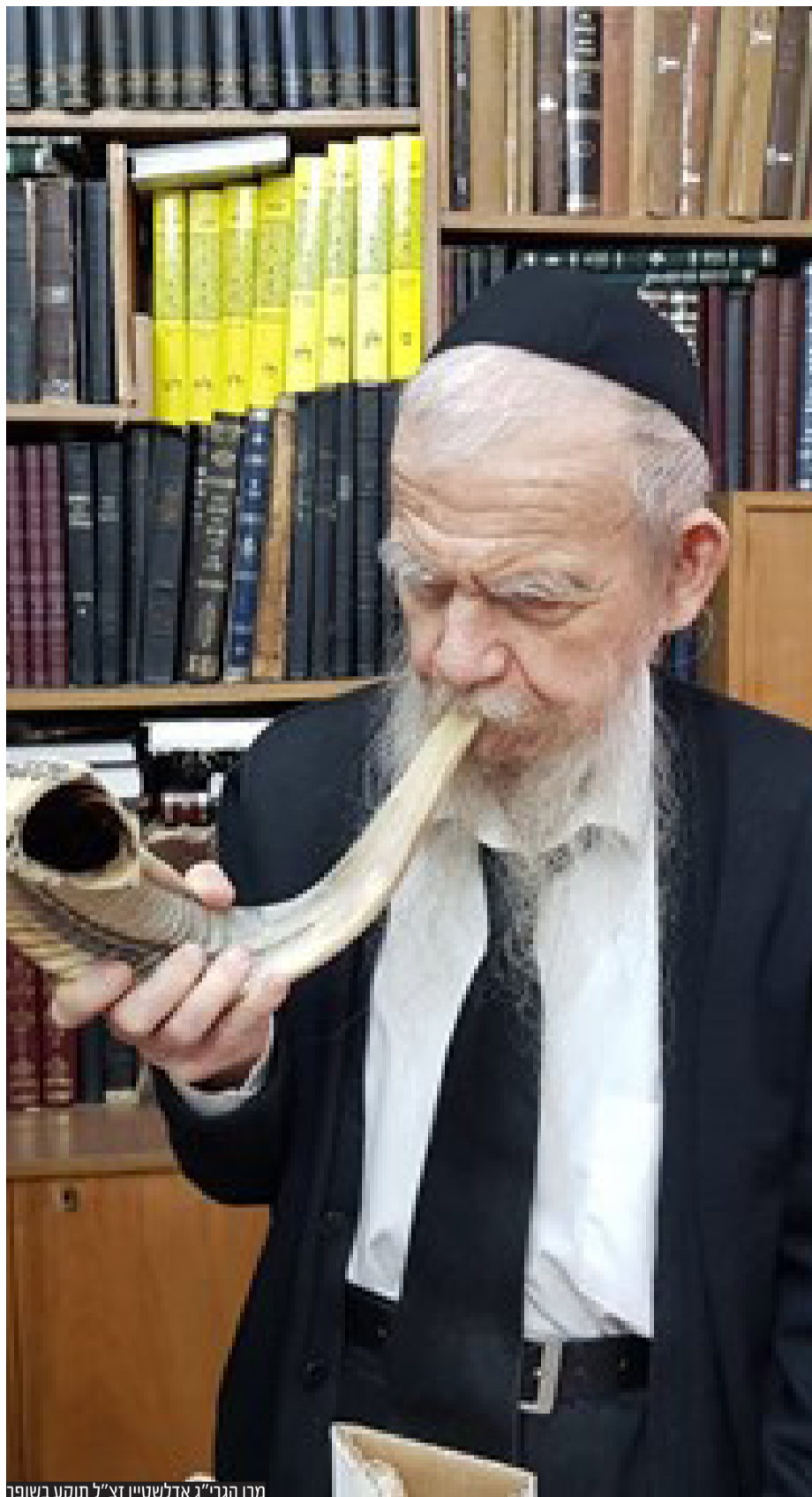
מרן הגר"ג אדלשטיין זצ"ל תוקע בשופר

במשך שבעים וחמש שנה ברציפות, זוכים אלפים מתלמידי ישיבת פוניבז' לשמוע את תקיעות השופר בימי ראש השנה מפי מרן ראש הישיבה הגר"ג אדלשטיין. מלבד תלמידי הישיבה ורבים מהבוגרים שקבעו את מקום תפילתם בהיכל הישיבה, רבים מתושבי בני ברק, הטריווה עזמם לגבעת הישיבה כדי לשמוע את מרן זצ"ל תוקע בשופר. למעשה, התקיעות הראשונות של מרן ראש הישיבה הגאון רבי גרשון אדלשטיין זצ"ל, החלו בשנת תש"ה, עוד בימי בחרותו אצל מרן החזן איש זצ"ל. הבעל תוקע אצל החזן איש נחלש באותה שנה, ואולם החזן"א שהכיר את ראש הישיבה הגר"ג ודן עמו רבות בלימוד, הגיע לאוזניו שמועה, כי הגר"ג זצ"ל מלומד בחכמת התקיעות וקרא לו לתקוע באותה שנה, כאשר החזן איש היה המקריא בעצמו. לפני התקיעות דנו יחדיו החזן"א והגר"ג בנוגע לנשימות בעת התקיעות. מאחר והיה עדיין לפני