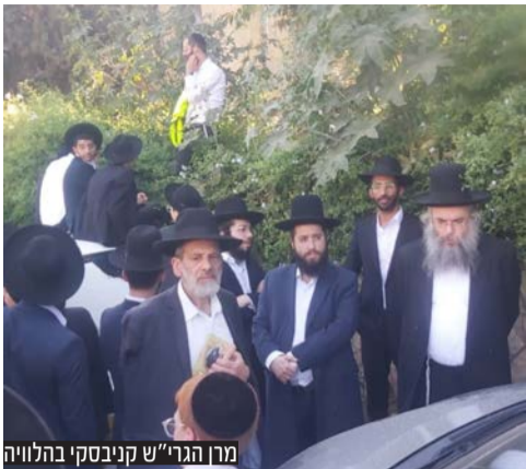
מרן הגרי"ג קניבסקי בהלוויה