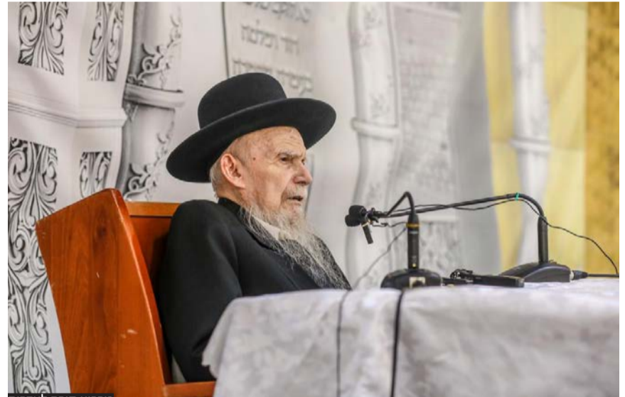
מרביץ תורה לעדריס