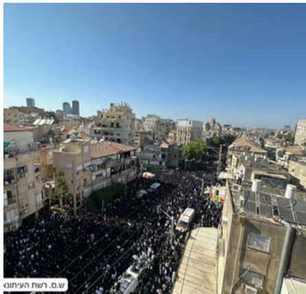
ש.ס. רשת העיתונות