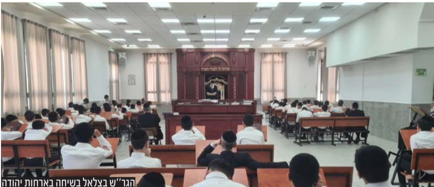
הגר"ש בצלאל בשיחה בארחות יהודה

על רקע גל ההסתה נגד הציבור החרדי, הגיע חבר מועצת חכמי התורה וראש ישיבת פורת יוסף הגר"ש בצלאל, לשיחת חיזוק בישיבת ארחות יהודה באלעד: "הקב"ה ברא מליארדי אנשים ומכל אלה הוא הכי שמח בבני התורה שלומדים"