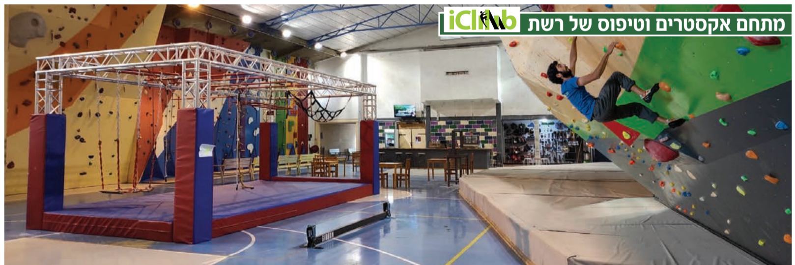
מתחם אקסטרים וטיפוס של רשת iClimb