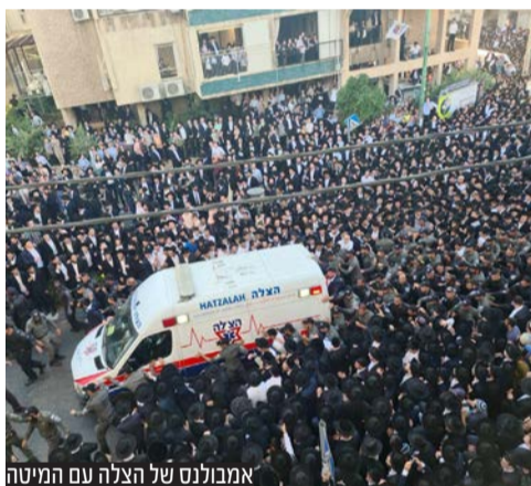
אמבולנס של הצלה עם המיטה