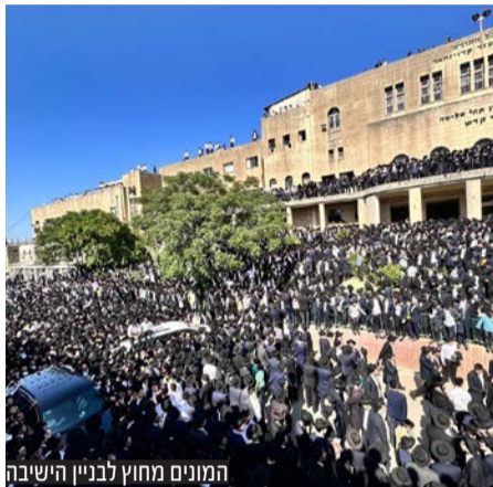
המונים מחוץ לבניין הישיבה