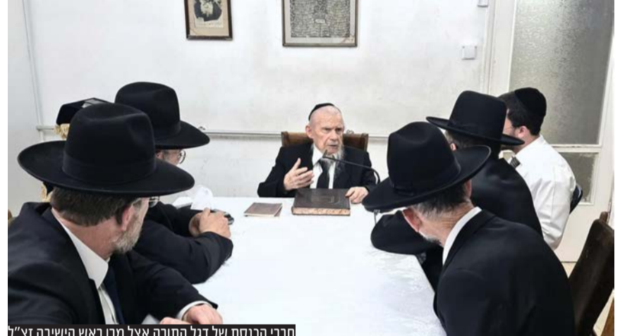
חברי הכנסת של דגל התורה אצל מרן ראש הישיבה זצ"ל