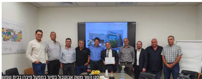
סגן השר משה אבוטבול בסיור במפעל פיברו בבית שמש

*סגן השר אמר בישיבת הסיכום: "התפעלות מאוד מלראות את התהליכים המיוחדים של פיתוחי החיסונים, שמסייעים למשק העופות והפטם. לנו כמשרד החקלאות יש שותפות וחלק לא רק בנתינת החותמת, אלה גם לנסות ולסייע ככל שנוכל בתוספת תקנים לשירות הווטרינרי שתמשיכו לפרוץ קדימה. כל פיתוח הנעשה כאן במפעל מונע מחלות בעופות, שיכולים גם להדביק בני אדם. ואין ספק שפיתוחים מיוחדים כאלה ששומרים לנו על משק העופות והפטם, שלא ייווצרו מחסורים בשווקים. מסייעים גם בהכרח להורדת יוקר המחיייה. ומחובתנו לשמור את המפעל המיוחד הזה שימשיך לפעול, ואף יגדיל את פעילותו בתקנים נוספים ככל שיתאפשר, תקנים אלו אם יצאו לפועל ע"י משרד החקלאות, ישמשו לפיקוח נוסף של השירות הווטרינרי ולביקורות ייחודיים, שעמידה בהם תיתן תוקף למפעל, להגיע למדינות נוספות רבות הדורשות רף גבוה של דרישות, למפעלים המעוניינים להיכנס לארצם. ויוסיף לנו למדינת ישראל, ולמשרד החקלאות, גם מוניטין וכבוד. כמובילים בפיתוחים ישראלים למניעת תחלואה".