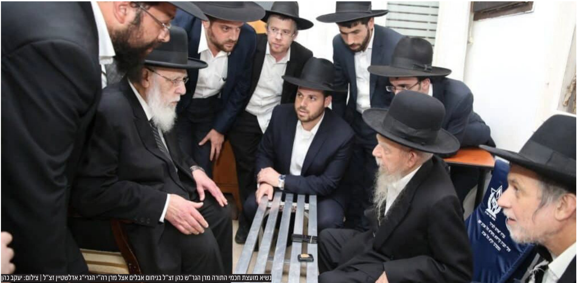
נשיא מועצת חכמי התורה מרן הגר"ש כהן זצ"ל בניחום אבלי אצל מרן רה"ג הגר"ג אדלשטיין זצ"ל

איבדנו שריד לדור דעה. רבי גרשון היה דמות ייחודית ביותר, גם בין גדולי התורה שהיו, שלכל אחד כמובן יש את הייחודיות שלו. זו היתה דמות של צניעות ופשטות מצד אחד, ומצד שני - מלמד שלא שינה. פשוטו כמשמעו. מאז שאנחנו מכירים אותו, קרוב ל-50 שנה, הוא תמיד באותו סדר יום ברור של תורה ושיעורים