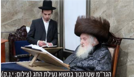
הגר"מ שטרנבוך במשא נעילת החג