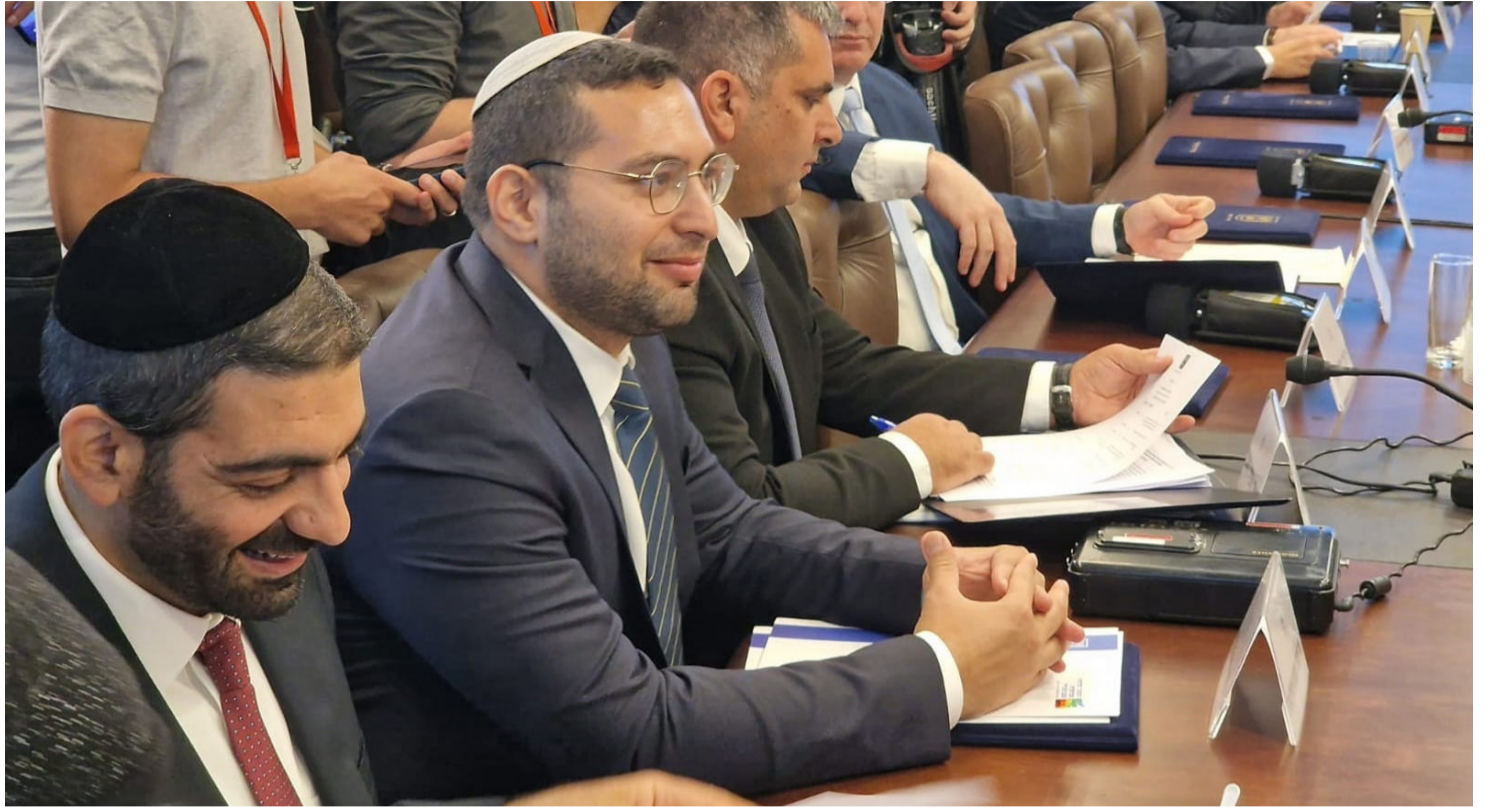
חוגג ציונות. השר וסרלאוף בישיבת הממשלה