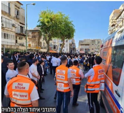
מתנדבי איחוד הצלה בהלוויה