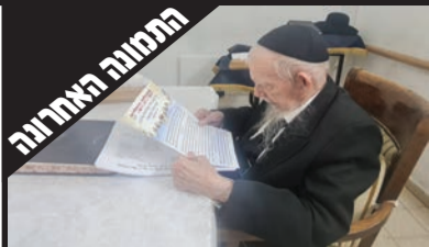
מרן רשכבה"ג הגר"ג אדלשטיין בתפילת השלי"ה על תורמי לקופת העיר - ערב ר"ח סיון תשפ"ג