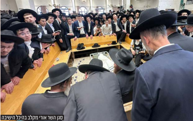
סגן השר אורי מקלב בהיכל הישיבה

סגן השר הרב אורי מקלב, מתלמידי מרן זצ"ל בישיבת פוניבז' בטור פרידה