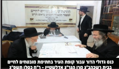
כנס גדולי הדור עבור קופת העיר בחתימת מובטחים לחיים בבית רשכבה"ג מרן הגר"ג אדלשטיין - ר"ח כסלו תשפ"ג