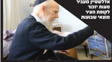
מרן רשכבה"ג הגר"ג אדלשטיין מעביר מעות יזכור לקופת העיר מוצאי שבועות