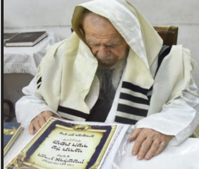
מרן רשכבה"ג הגר"ג אדלשטיין מעתיר על תורמי קופת העיר לפני כל נדרי