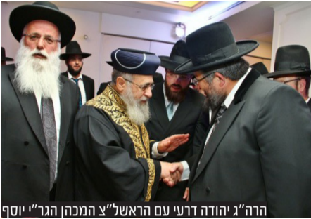
הרה"ג יהודה דרעי עם הראשון לצ"ח המכהן הגר"י יוסף