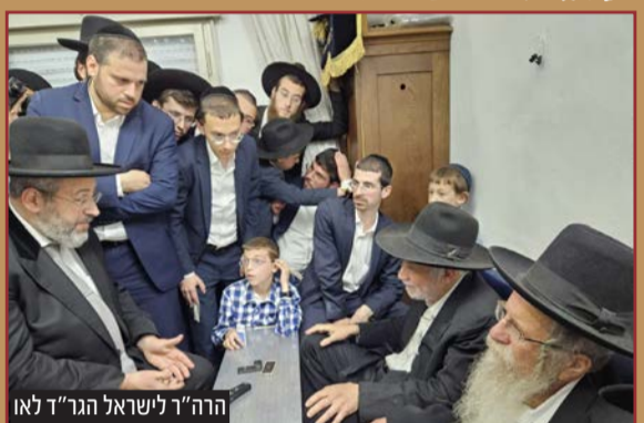
הרה"ר לישראל הגר"ד לאו