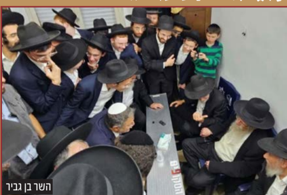
השר בן גביר