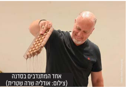
אחד המתנדבים בסדנה

של כל אחד למערך הפועל יום יום. ממש כמו השוקולד, כל המרכיבים מתחברים לקובייה אחת. יחד זה הכוח שלנו."