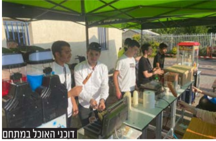
דוכני האוכל במתחם

הנהלת בית הספר תיכון מעיין שבשכונת שעריה, בשיתוף הקרן לעידוד יוזמות חינוכיות ושלומי ערה מ'עיר ללא אלימות', קיימה את האירוע והכריזה על כניסה ללא עלות לילדי השכונה • תושבים ל'קו עיתונות דתית': "מרגש לראות את השכנות הנפלאה עם בית הספר הפועל בשכונה"