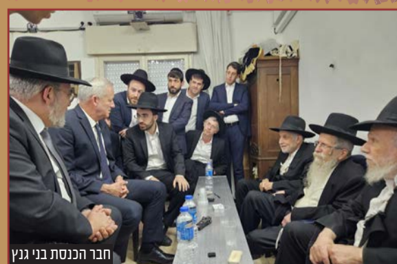
חבר הכנסת בני גניץ