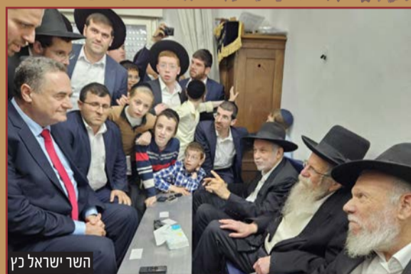
השר ישראל כץ