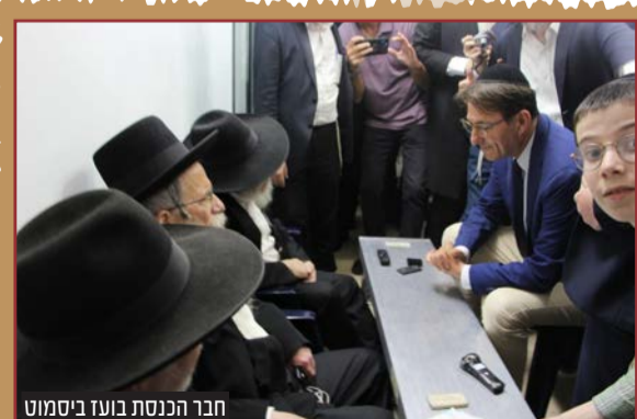
חבר הכנסת בועז ביסמוט