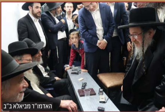
האדמו"ר מביאלא ב"ב