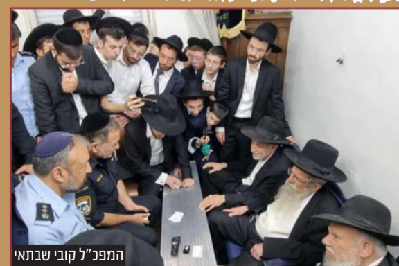
המפכ"ל קובי שבתאי