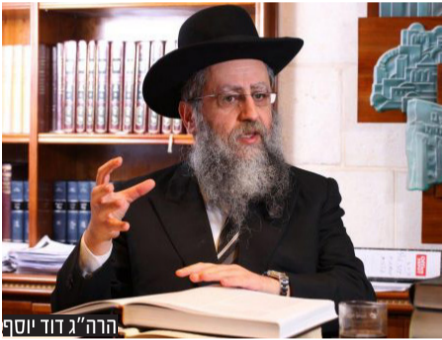
הרה"ג דוד יוסף