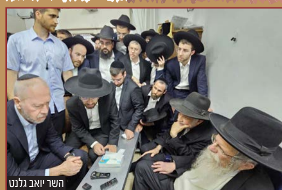
השר יואב גלנט