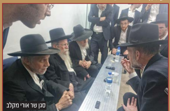
סגן שר אורי מקלב