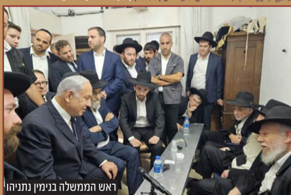
ראש הממשלה בנימין נתניהו