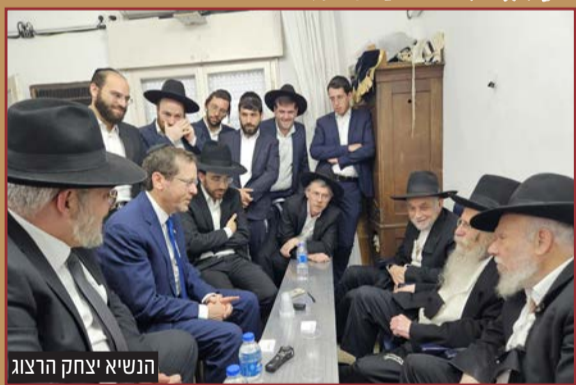
הנשיא יצחק הרצוג