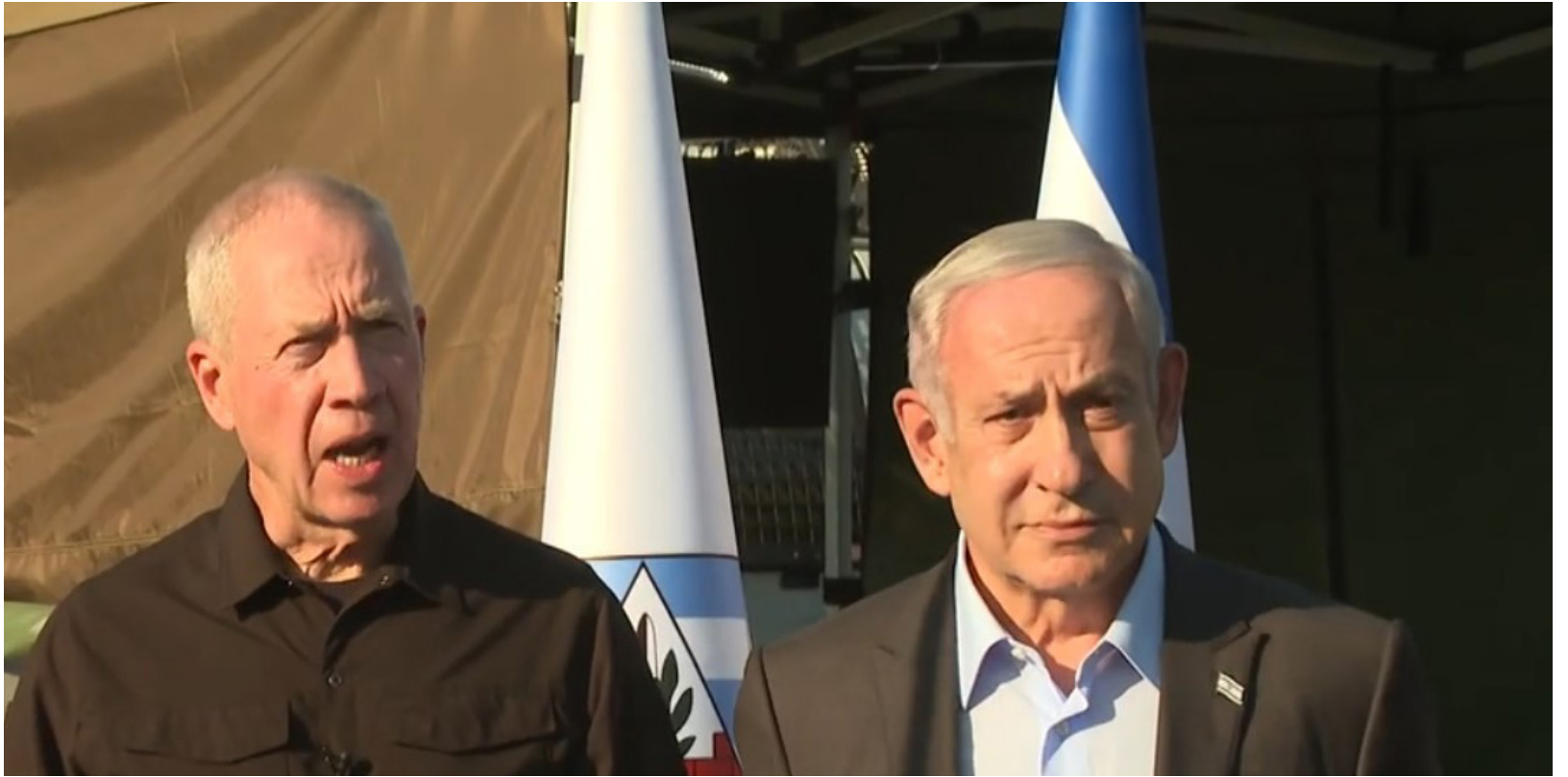
משנה גישה? שר הביטחון בנאום נגד הסרבנות

כזו הייתה גוררת את העיר לסיבוב שני - בו בסבירות גבוהה היה מנצח מועמד אנטי חרדי. רק בשעות הבוקר המוקדמות נשמו הש"סניקים לרווחה, כשהתפרסמה התוצאה הסופית ובה חצה לסרי את קו ארבעים האחוזים הנדרשים על חודם של שברירי קולות. בנייתו שלאחר מעשה, קיבל לסרי קרוב ל-30% מכלל המצביעים מקרב קולות התושבים החרדים בעיר, כחמישה אחוזים נוספים ממצביעי מפלגה מקומית המזוהה עם יוצאי גיאורגיה, ובקושי שישה אחוזים שהביא מעצמו - נתון מקביל למצבו במועצת העיר, שם הכניס בדקה התשעים את הנציג השני.