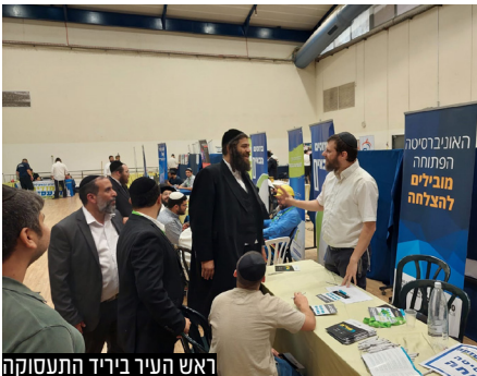
ראש העיר ביריד התעסוקה

במרכז צעירים אלעד, שיזמו והפיקו את היריד לימודים ותעסוקה, היו שבעי רצון מההיענות הרבה של המשתתפים ביריד, דבר שהראה את הצורך הגדול של תושבים רבים בהכוונה הן ללימודים והן לתעסוקה