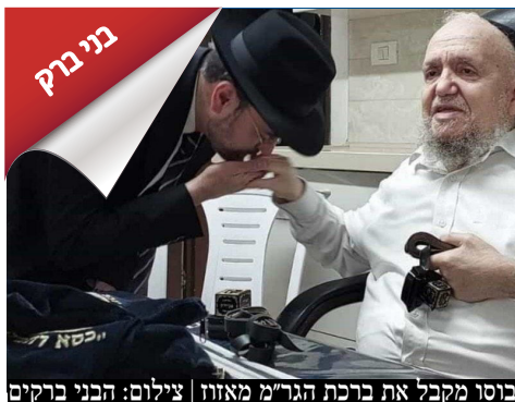
בוטו מקבל את ברכת הגר"מ מאזון

דרעי: רצים עד הסוף בישיבת סיעת ש"ס שהתקיימה ביום שלישי אמר דרעי: "זה רציני, הולכים עד הסוף בבני ברק. יש לנו סיכוי אמיתי לנצח" • חשוב להבהיר: בבחירות האחרונות לכנסת יהדות התורה קיבלה 60% מהקולות בעיר