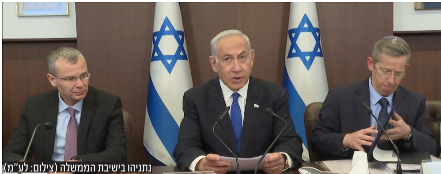
נתניהו בישיבת הממשלה

בפתח ישיבת הממשלה הודה נתניהו לציבור על הדאגה לבריאותו לאחר שאושפז בביה"ח שיבא בעקבות התייבשות. "לא ייתכן שתהיה קבוצה בתוך הצבא שתאיים על הממשלה הנבחרת: אם לא תעשו כרצוננו - נוריד את השאלטר על הביטחון", תקף נתניהו את המאיימים בסרבנות