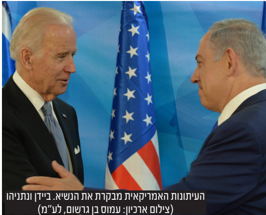
העיתונות האמריקאית מבקרת את הנשיא. ביידן ונתניהו

במאמר מערכת של ה'וול סטריט ג'ורנל', כותבים העורכים כי היחס שמקבל נתניהו מביידן גרוע יותר מהיחס שמקבלים האייתולות באיראן • "ישראלים צריכים להתווכח בנושא הרפורמה המשפטית בלי הפרשנות של ביידן", נכתב במאמר המערכת