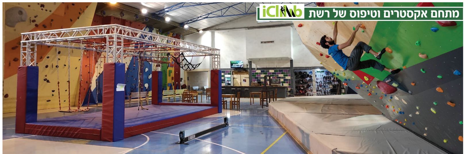
מתחם אקסטרים וטיפוס של רשת iClimb