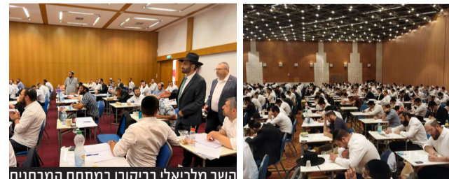
השר מלכיאלי בביקורו במתחם המבחנים