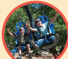
SKY RIDER VR חציאות מדומה