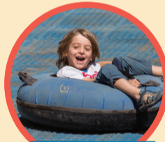
אבובי קיץ החל מה-28.7