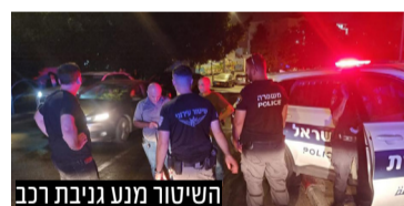
השיטור מנע גניבת רכב