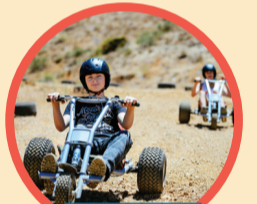
קרטינג החל מה-28.7