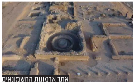
אתר ארמונות החשמונאים