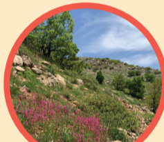
סיורים מודרכים ללא תשלום* *בהרשמה מראש אונליין