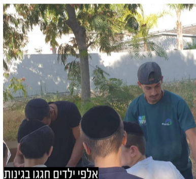
אלפי ילדים חגגו בגינות

במסגרת ציון השבוע הירוק, בו מעלים את המודעות לסביבה ולצורך השמירה עליה • הפעילות התקיימה בשיתוף פעולה עם דמותו של קופלה, שבשבועות האחרונים נכנסה לאלעד כדי לעודד את הילדים לשמירה על הניקיון והסביבה