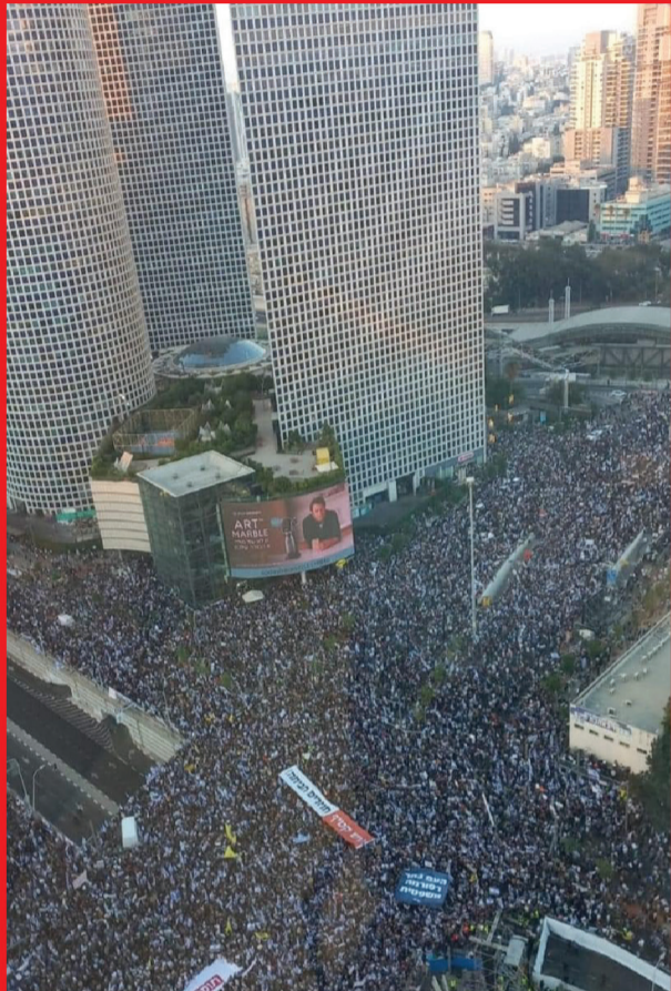
ימים סוערים ברחובות. הפגנת הימין בת"א השבוע

בעיתוי הכי פחות מתאים, הונחה על שולחן הכנסת הצעת חוק יסוד לימוד תורה שגררה ביקורת על העיתוי הן מצד הקואליציה והן מצד האופוזיציה. יהדות התורה הגיבה: "הצעת החוק הוכנה בזמנו על ידינו כחלק מהפתרון הכולל. מועד ההנחה על שולחן הכנסת הוא מקרי". בליכוד מיהרו להתנער: "הצעת חוק יסוד לימוד תורה לא עומדת על הפרק והיא לא תקודם" | עמ' 8