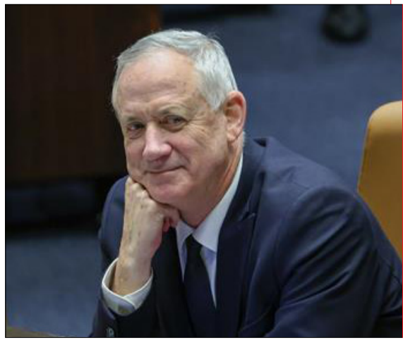
« הזדמנות שנייה. יו"ר המחנה הממלכתי ח"כ בני גנץ

« גנץ פספס הזדמנות פז לצאת גיבור לאומי של ממש. ביום רביעי בלילה, כשיצא בקריאה פומבית לממשלה לעצור בדקה האחרונה ולשבת למצוא פתרון מוסכם, הוא חזר לרגע להיות הטירון שנכנס לפוליטיקה לפני 4 וחצי שנים בלבד. במקום להשתמש בסיסמאות נבובות, היה גנץ יכול למלכד את הקואליציה בהצעה מפתה - לפרט במדויק מה הוא דורש לדלל בצמצום עילת הסבירות, ולהודיע כי במקרה כזה הוא ואנשיו יצביעו בעד