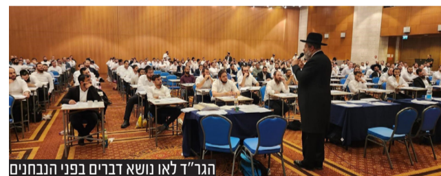
הגר"ד לאו נושא דברים בפני הנבחנים

עשה לך רב: למעלה מ-2,800 אברכים ובני תורה, נבחנו השבוע בבנייני האומה בירושלים במבחני הרבנות הראשית לישראל • הרב הראשי לישראל הגר"ד לאו לנבחי הרבנות הראשית: "אתם דור העתיד של עולם הרבנות" • השר לשירותי דת ח"כ מיכאל מלכיאלי: "בזמן שאחרים בחוץ עסוקים בהפגנות, פה נמצאת התשובה האמתית, תלמידי חכמים שתורתם אומנותם, אנשים שעליהם ובזכותם עומד העולם"