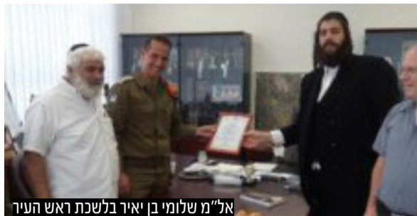
אל"מ שלומי בן יאיר בלשכת ראש העיר

מפקד מחוז ירושלים ומרכז בפיקוד העורף, אל"מ שלומי בן יאיר, שבא להיפרד מהעיר, עם סיום תפקידו: "אני מודה ומעריך את שיתוף הפעולה ההדוק בין פיקוד העורף לרשות המקומית. ראינו בזמני חירום מוכנות טובה שמסייעת רבות לתושבים"