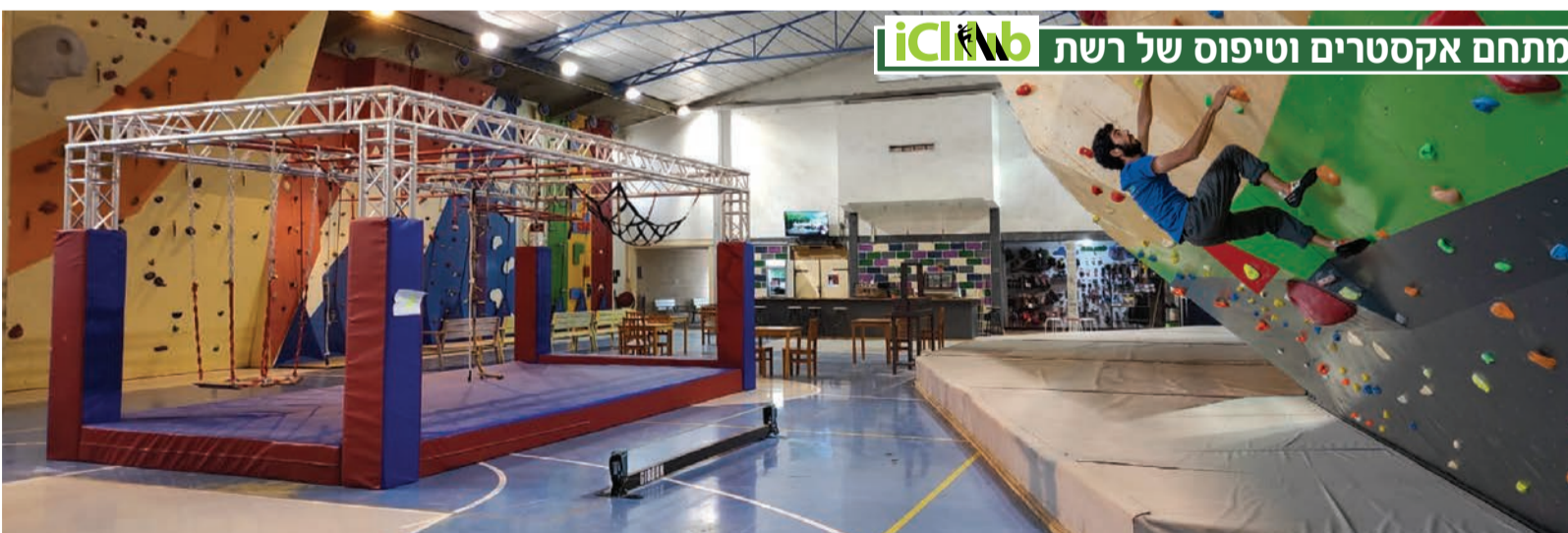
מתחם אקסטרים וטיפוס של רשת iClimb