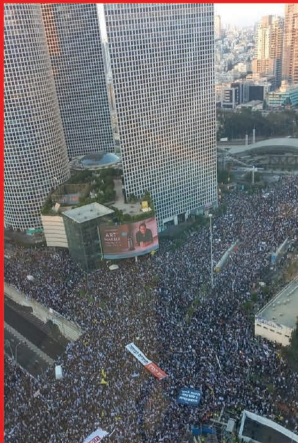
ימים סוערים ברחובות. הפגנת הימין בת"א השבוע