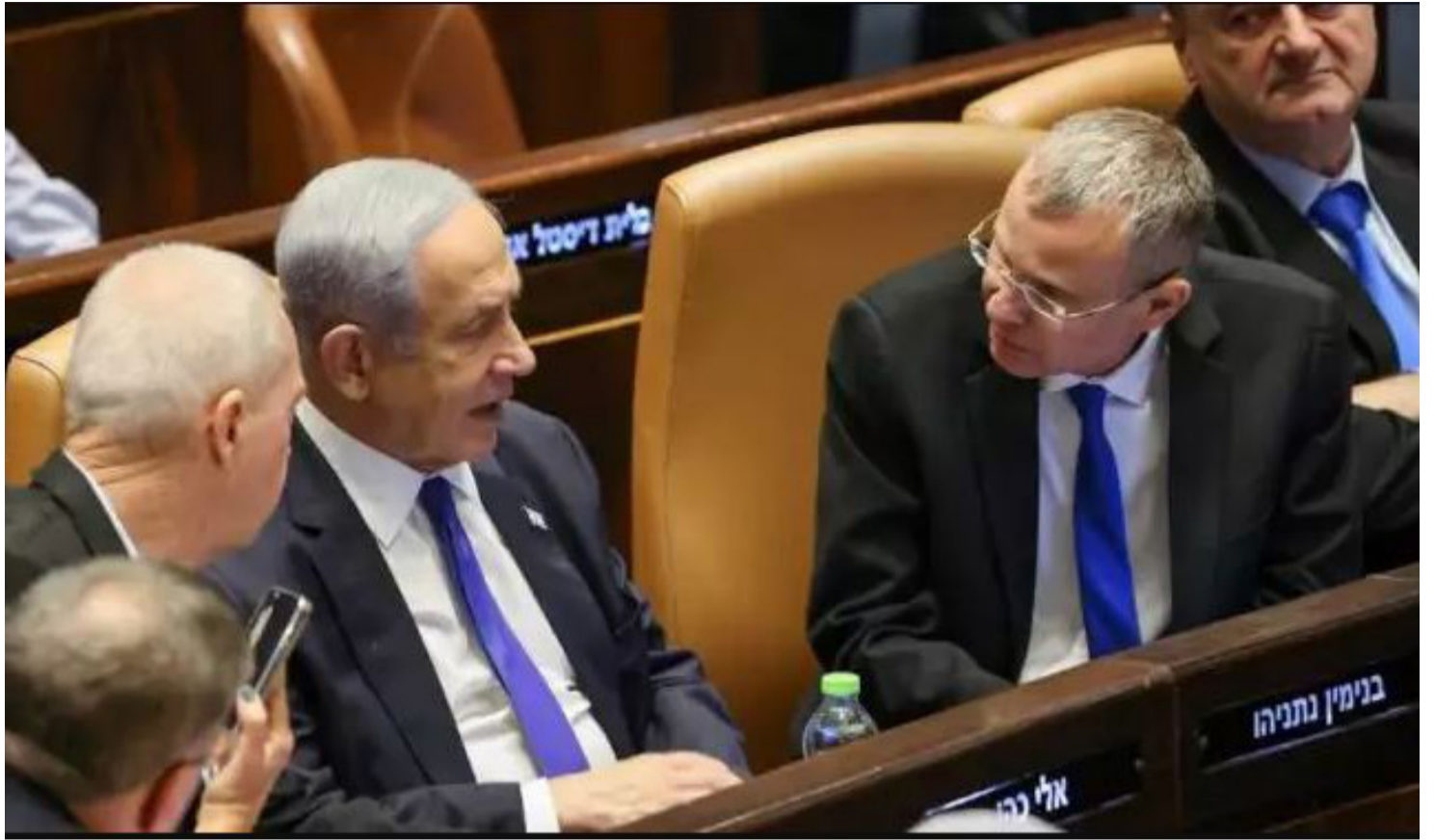
מושכים את נתניהו משיני צדדיו, לוי וגלנט עם ראש הממשלה ברגעי ההצבעה.

מול לוי, עד כמה השפיע בן גביר והוטו שהטיל על נסיגה אפשרית, מה הוצע לאופוזיציה ומדוע הפשרה נכשלה בסוף, האם דרעי היה מעורב ושמה הוא דווקא שמר מרחק, ועוד כהנה וכהנה. נחסוך לכם את שלל הגרסאות, שאף אחד לא הצליח להרכיב מהן תמונה קוהרנטית כלשהי, וניגש היישר לתוצאות.