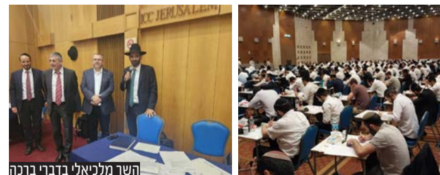
השר מלכיאלי בדברי ברכה