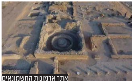
אתר ארמונות החשמונאים

כהן, השר לביטחון לאומי איתמר בן גביר, שר המורשת עמיחי אליהו, שר התרבות מיקי זוהר, שרת התחבורה מירי רגב והמנהל האזורי על קידום פיתוח ושימור אתרי מורשת בבנימין ואמר כי "יש בידינו זכות גדולה ועצומה לשמור ולפתח את המורשת של העם היהודי. אנחנו מחזיקים פיקדון של דורות. בהובלת שרי הממשלה הצלחנו לקדם תוכנית חשובה לביסוס האחיזה ההיסטורית שלנו באתר ארמונות החשמונאים במטרה לשמור על המורשת היהודית ביריחו ומורשת החשמונאים. אנחנו מצמיחים אתר מורשת ותיירות שיקלוט מבקרים מכל העולם."