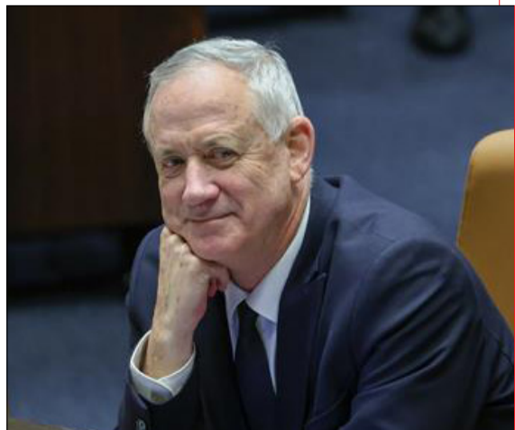
« הזדמנות שנייה. יו"ר המחנה הממלכתי ח"כ בני גנץ

« גנץ פספס הזדמנות פז לצאת גיבור לאומי של ממש. ביום רביעי בלילה, כשיצא בקריאה פומבית לממשלה לעצור בדקה האחרונה ולשבת למצוא פתרון מוסכם, הוא חזר לרגע להיות הטירון שנכנס לפוליטיקה לפני 4 וחצי שנים בלבד. במקום להשתמש בסיסמאות נבובות, היה גנץ יכול למלכד את הקואליציה בהצעה מפתה - לפרט במדויק מה הוא דורש לדלל בצמצום עילת הסבירות, ולהודיע כי במקרה כזה הוא ואנשיו יצביעו בעד