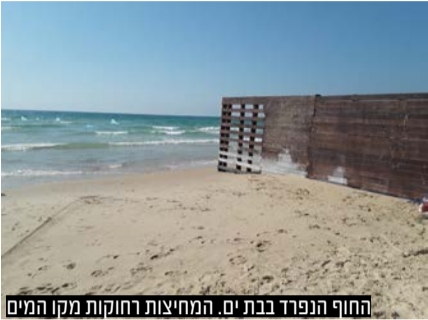
החוף הנפרד בבתי ים. המחיצות רחוקות מקו המים

באגודה פונים לראשי הערים בערי החוף להכשיר חופים שיותאמו לשימוש הציבור החרדי • עיקר הבעיה בחופי בת ים, אשקלון והרצליה - חופים אלו ניתן להכשירם בקלות ולהתאימם לדרישות הציבור החרדי