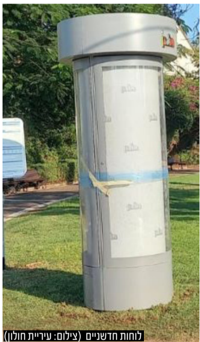
לוחות חדשניים

לוחות המודעות המעוצבים כוללים תאורה מבוססת אנרגיה סולארית ידיוותית לסביבה