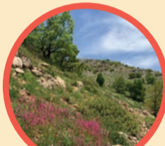
סיורים מודרכים ללא תשלום* *בהרשמה מראש אונליין