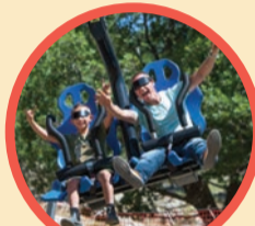
SKY RIDER VR ציאות מדומה