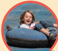
אבובי קיץ החל מה-28.7