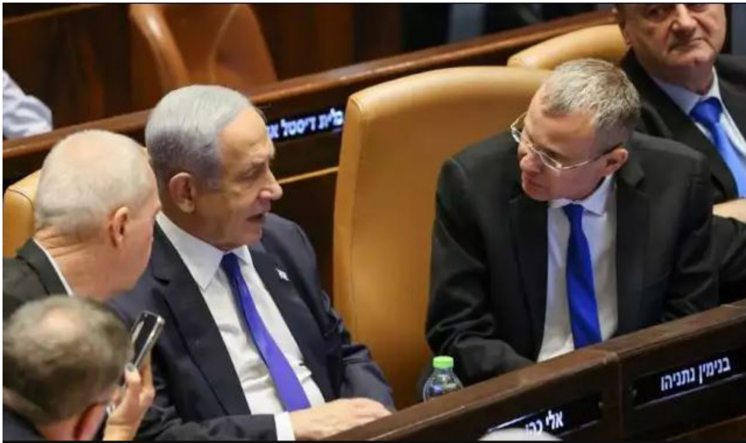
מושכים את נתניהו משיני צדדיו, לוי וגלנט עם ראש הממשלה ברגעי ההצבעה.