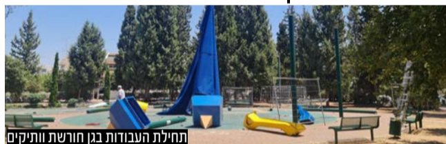
החילת העבודות בגן חורשת ותיקים

מתקני משחקים, נדנדות חדשות, משטח משחק בטיחותי ומדשאות ירוקות: אגף גנים ונוף בעיריית רחובות החל השבוע לחדש את גן חורשת ותיקים ברח' קנדלר • העבודות לחידוש הגינה ייערכו במשך חודשיים