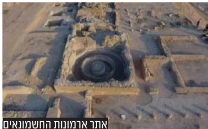
אתר ארמונות החשמונאים