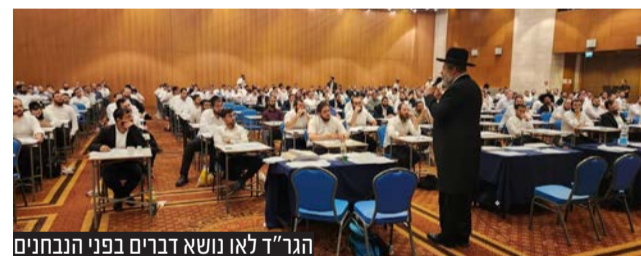
הגר"ד לאו נושא דברים בפני הנבחנים

עשה לך רב: למעלה מ-2,800 אברכים ובני תורה, נבחנו השבוע בבנייני האומה בירושלים במבחני הרבנות הראשית לישראל • הרב הראשי לישראל הגר"ד לאו לנבחי הרבנות הראשית: "אתם דור העתיד של עולם הרבנות" • השר לשירותי דת ח"כ מיכאל מלכיאלי: "בזמן שאחרים בחוץ עסוקים בהפגנות, פה נמצאת התשובה האמתית, תלמידי חכמים שתורתם אומנותם, אנשים שעליהם ובזכותם עומד העולם"