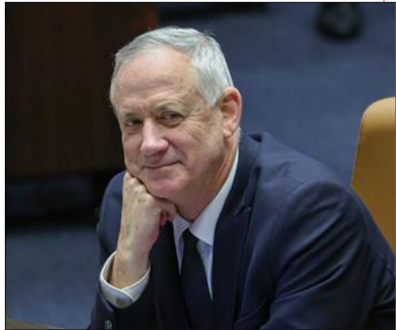
«הזדמנות שנייה. יו"ר המחנה הממלכתי ח"כ בני גנץ »

«גנץ פספס הזדמנות פז לצאת גיבור לאומי של ממש. ביום רביעי בלילה, כשיצא בקריאה פומבית לממשלה לעצור בדקה האחרונה ולשבת למצוא פתרון מוסכם, הוא חזר לרגע להיות הטירון שנכנס לפוליטיקה לפני 4 וחצי שנים בלבד. במקום להשתמש בסיסמאות נבובות, היה גנץ יכול למלכד את הקואליציה בהצעה מפתה - לפרט במדויק מה הוא דורש לדלל בצמצום עילת הסבירות, ולהודיע כי במקרה כזה הוא ואנשיו יצביעו בעד»