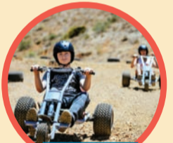
קרטינג החל מה-28.7