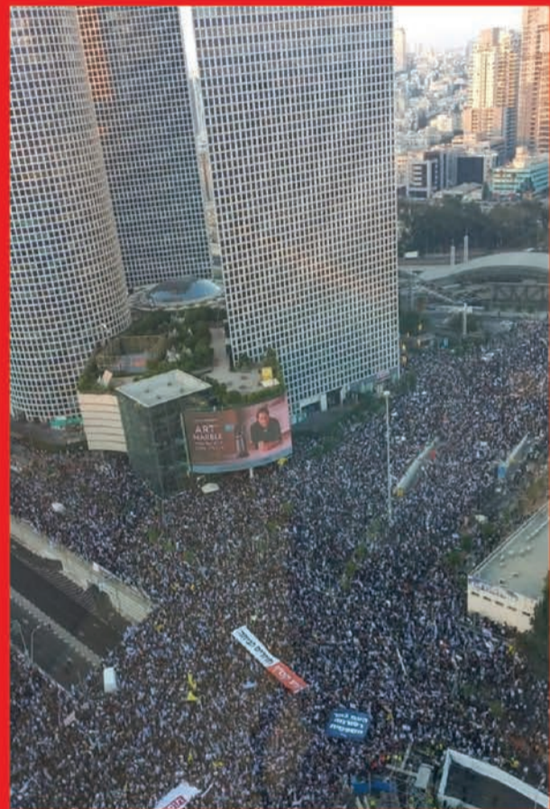
ימים סוערים ברחובות. הפגנת הימין בת"א השבוע