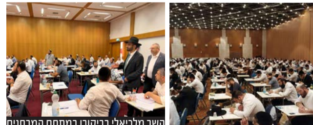
השר מלכיאלי בביקורו במתחם המבחנים