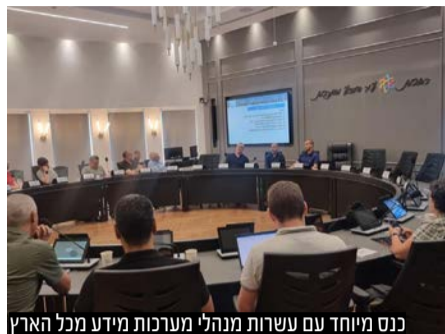
כנס מיוחד עם עשרות מנהלי מערכות מידע מכל הארץ

מעל 30 מנהלי אגפי מערכות מידע של עיריית רחובות מכל רחבי ישראל הגיעו לבקר בעיריית רחובות כדי ללמוד על פרויקטים טכנולוגיים חדשניים, שאותם מובילה עיריית רחובות באמצעות אגף מערכות מידע וביטחון.