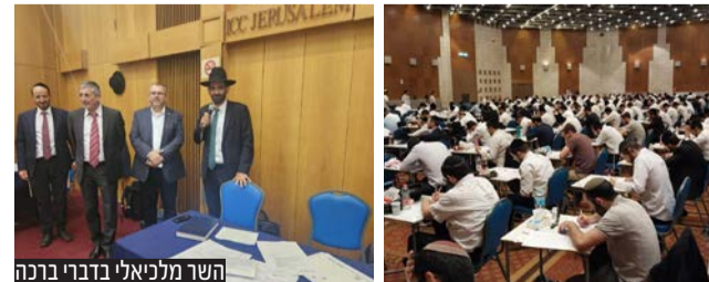
השר מלכיאלי בדברי ברכה

באולמות גדולים ומרווחים כדוגמת בנייני האומה בירושלים ושיפורים נוספים שהוכנסו.