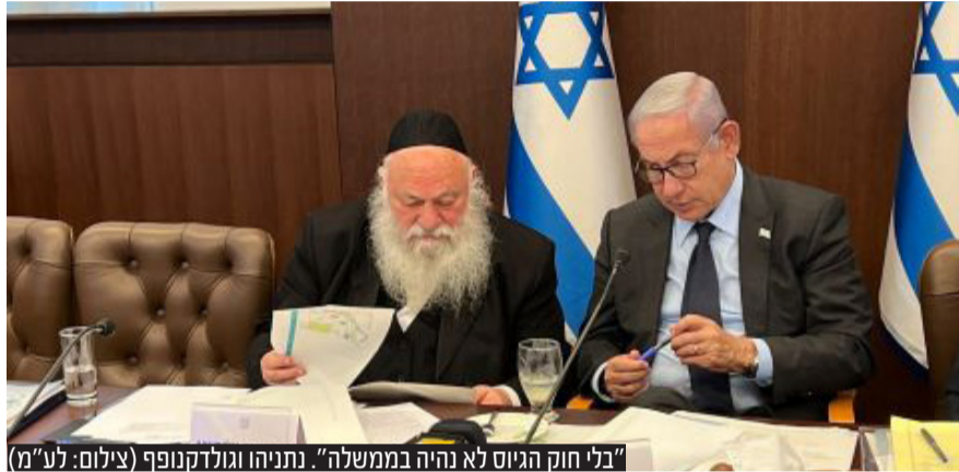
"בלי חוק הגיוס לא נהיה בממשלה". נתניהו וגולדקנופף

יחד עם זאת, ל"קו עיתונות" נודע כי במפלגות החרדיות נערכים גם למקרה שהחוק לא יעבור ותסתיים הוראת השעה ולפיה שר הביטחון הורה לצה"ל שלא לגייס את בני הישיבות. במקרה כזה, ניאולף למצוא פתרונות חלופיים. במפלגות החרדיות החלו בימים האחרונים בהתייעצויות משפטיות לתקופה שבה אין חוק שמסדיר את דחיית השירות של בני הישיבות. הפלונטר סביב חוק הגיוס, שנמשך למעלה מעשור וחצי, טרם הגיע אל קיצו. כמה מממשלות העבר נפלו על רקע חוק הגיוס. נתניהו לא רוצה שגם כהונתו השישית תסתיים מבעוד מועד והוא ייאולף למצוא פתרון יצירתי שגם יניח את דעתן של המפלגות החרדיות, מהלי לעורר עליו את המחאה הציבורית.