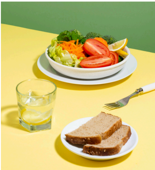
צלחת בארוחת הערב.

רגע לפני שהילדים חוזרים למסגרות, שתי המומחיות, ד"ר שירלי הרשקו מומחית בכירה בתחום הקשב, סופרת וחוקרת, מפתחת שיטת 'תזונה קשובה', וחלי ממון, מייסדת רשת תמיכה לאורח חיים בריא, מסבירות כיצד להבטיח תזונה מאוזנת גם בימי החופש