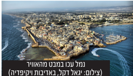
נמל עכו במבט מהאוויר