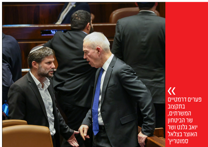
פרטים דרמטיים בתקצוב המשרתים, שר הביטחון יואב גלנט ושר האוצר בצלאל סמוטריץ'

בשלב מסוים, ניסה גנץ לומר כי אמנם הוא מבין שאי אפשר להתפשר על בני הישיבות וציין כי "גם לי זה חשוב", ובכל זאת, ביקש, אולי אפשר להגיע להסכמות... הגרמ"צ השיב לאלתר כי בסוגיה הזו לא ניתן לוותר, "איך אנחנו יכולים לוותר על משהו שאנחנו לא בעלים עליו, על התורה? אין לנו אפשרות לוותר על שום דבר". גנץ ניסה להבדיל בין בחורים שלומדים ובין כאלו שלא, ומרן קטע את הדברים וקבע נחרצות: "כל בחור אני צריך בישיבה". בהמשך, הבטיח לגנץ כי אם יסייע לפתור את הסוגיה מובטח לו שהוא בן עולם הבא, "גם אם תעשה זאת לשם פוליטיקה"