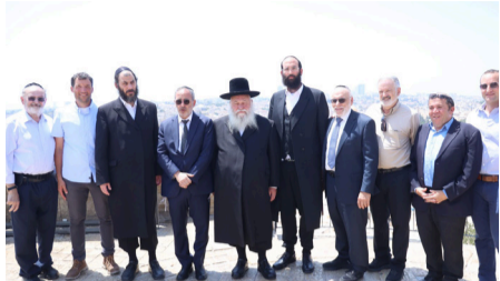
שר השיכון עם ראשי הוועד להגנת הר הזיתים בסיור בהר

השר יצחק גולדקנופף הכריז על הבשורה ההיסטורית לאחר חצי שנה של משא ומתן מול פקידי האוצר • את ההכרזה קיים השר במהלך סיור מיוחד בהר הזיתים אותו יזמו ואירגנו 'הועד להגנה על הר הזיתים'