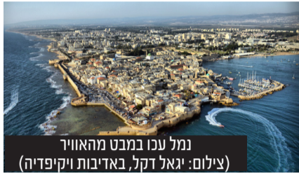
נמל עכו במבט מהאוויר