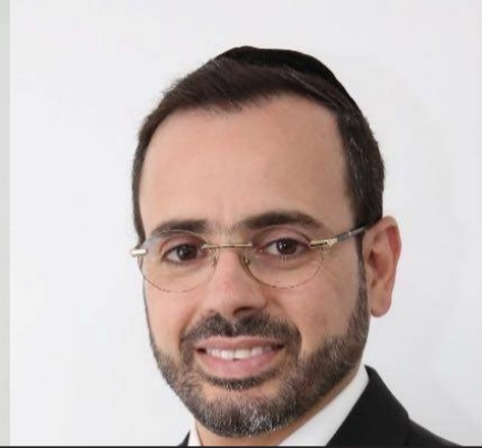
ישאר עד הגמר באשדוד? מ"מ ראש העיר אבי אמסלם