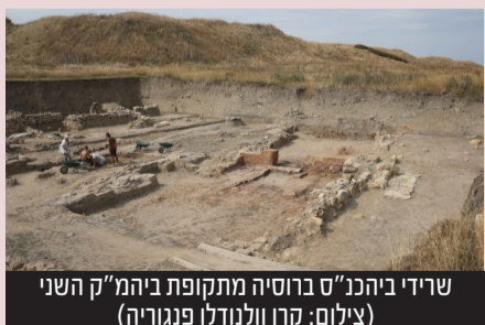
שרידי ביהמ"ק ברוסיה מתקופת ביהמ"ק השני

מדובר באחד מבתי הכנסת העתיקים בעולם • חוקרים ארכיאולוגים הופתעו מהמצאים • התרגשות בקהילה היהודית בקרסנודר הסמוכה