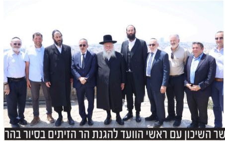
שר השיכון עם ראשי הוועד להגנת הר הזיתים בסיור בהר

השר יצחק גולדקנופף הכריז על הבשורה ההיסטורית לאחר חצי שנה של משא ומתן מול פקידי האוצר • את ההכרזה קיים השר במהלך סיור מיוחד בהר הזיתים אותו יזמו ואירגנו 'הועד להגנה על הר הזיתים'