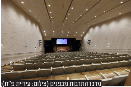
מרכז התרבות מבפנים