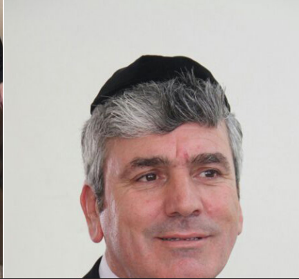
ישאר עד הגמר באשדוד? מ"מ ראש העיר אבי אמסלם