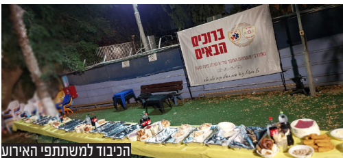
התבוד למשתתפי האירוע