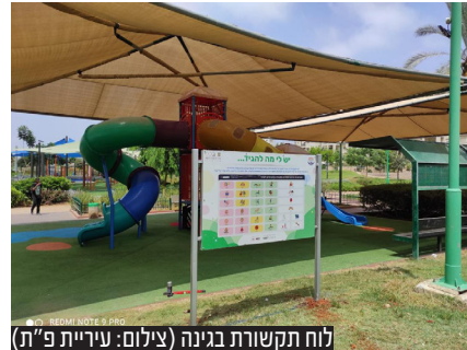
לוח תקשורת בגינה