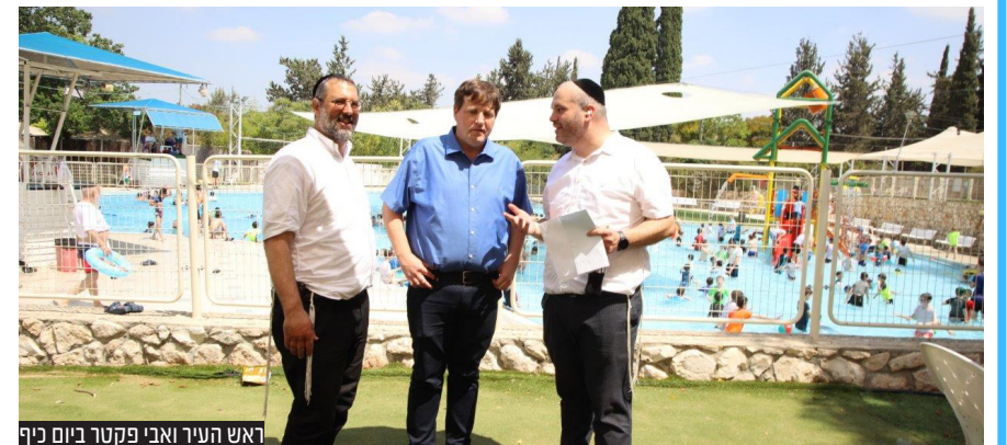
ראש העיר ואבי פקטר ביום כיף

בחסות היחידה לתרבות חרדית ובעידוד ראש העיר יצאו אוטובוסים משני מוקדים בעיר ובשני ימים נפרדים לפארק המים נחשונים, בנוסף לערב בריכה עבור בני הישיבות