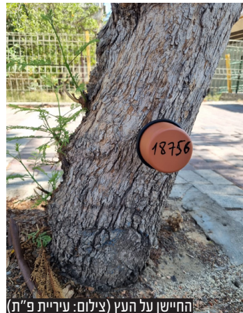
החישן על העץ

במסגרת התיאום בין העירייה למשרד להגנת הסביבה לטובת קידום הטיפול בטרמיט הפורמוסי, בימים האחרונים החל פרויקט להתקנת אלפי חיישנים לזיהוי טרמיטים בעצים. מדובר בטכנולוגיה פורצת דרך חדשה אשר פותחה לאחרונה בישראל ומטרתה לאתר את פעילות הטרמיטים בשלב מוקדם, לפני שנראה לעין.