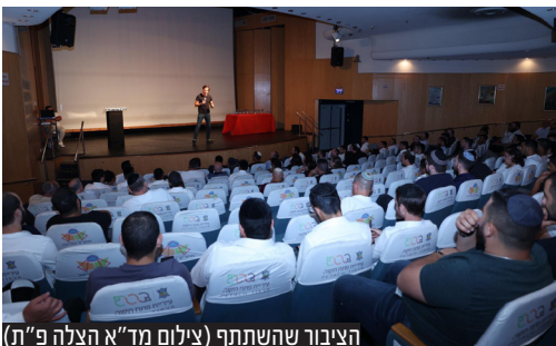
הציבור שהשתתף

מתנדבי משפחת החסד 'מד"א' - הצלה פתח תקווה וילדיהם התכנסו ביום שלישי לערב גיבוש מרענן וחוויתי אשר נערך 'במועדון הספורט' ברחוב מינץ בפתח תקווה.