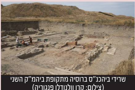
שרידי ביהמ"ק ברוסיה מתקופת ביהמ"ק השני

מדובר באחד מבתי הכנסת העתיקים בעולם • חוקרים ארכיאולוגים הופתעו מהמצאים • התרגשות בקהילה היהודית בקרסנודר הסמוכה