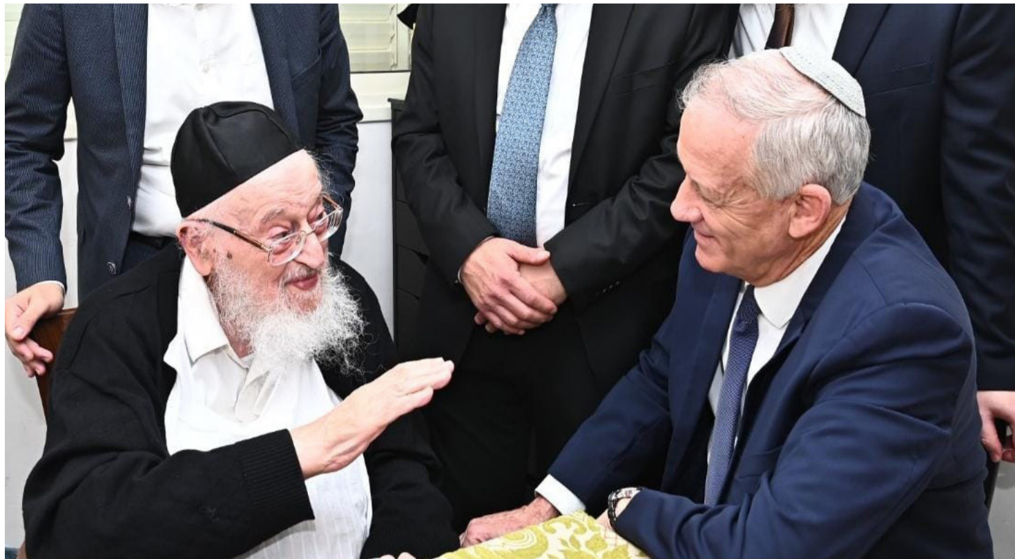
לא מתערבים לכם ואל תתערבו לנו", שר הביטחון לשעבר אצל מרן הגרמ"צ ברגמן

הצעת חוק יסוד לימוד תורה, במתכונת כזו או אחרת.