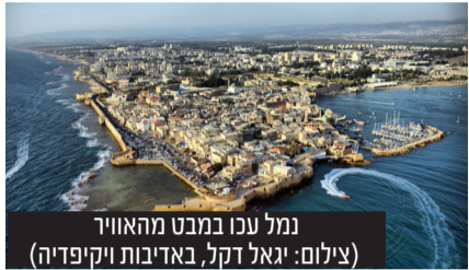
נמל עכו במבט מהאוויר