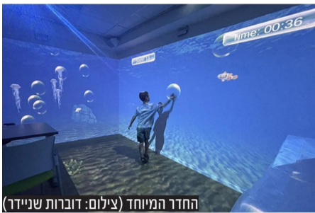
החדר המיוחד (צילום: דוברות שניידר)

החדר מאפשר לילדים לשחק באמצעות גירוי החושים, ולצוות הרפואי להדגים לילדים ולהוריהם על פרוצדורות רפואיות שהם עומדים לעבור