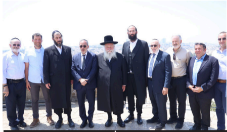
שר השיכון עם ראשי הוועד להגנת הר הזיתים בסיור בהר

השר יצחק גולדקנופף הכריז על הבשורה ההיסטורית לאחר חצי שנה של משא ומתן מול פקידי האוצר • את ההכרזה קיים השר במהלך סיור מיוחד בהר הזיתים אותו יזמו ואירגנו 'הועד להגנה על הר הזיתים'