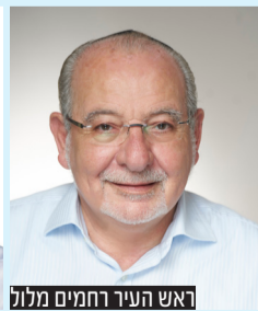
ראש העיר החמים מלול