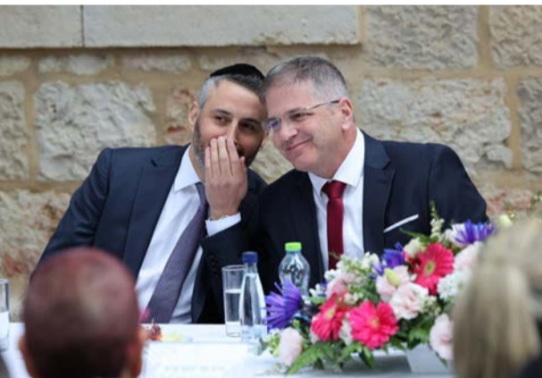
עם שר החינוך יואב קיש