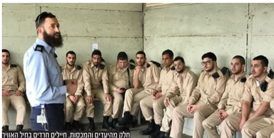
חלק מהיעדים והמכסות. חיילים חרדים בחיל האוויר

הנציגים החרדים זועמים על הקשיים שמערימים היועצים המשפטיים שטענו שהחוק לא מקובל עליהם בגלל "חוסר שוויון" • ראשי שלוש המפלגות החרדיות העבירו לנתניהו מסר משותף: לא נקבל דחיה נוספת של חוק הגיוס • "שיעבדנו את החודשים האחרונים לרפורמה של יריב לוי, אין לנו שום כוונה לשעבד את כל הקדנציה. יש לנו מחויבויות כמו חוק הגיוס ויוקר המחיה"