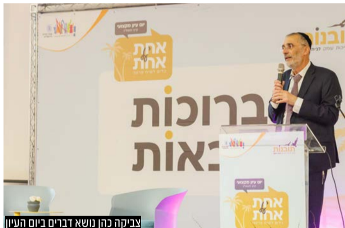
צביקה כהן נושא דברים ביום העיון

סגן ומ"מ ראש העיר ירושלים הרב צביקה כהן למשתתפות יום העיון: "ויגבה ליבו בדרכי השם היא הדרך הנכונה למנוע משברים מול אתגרי התקופה"