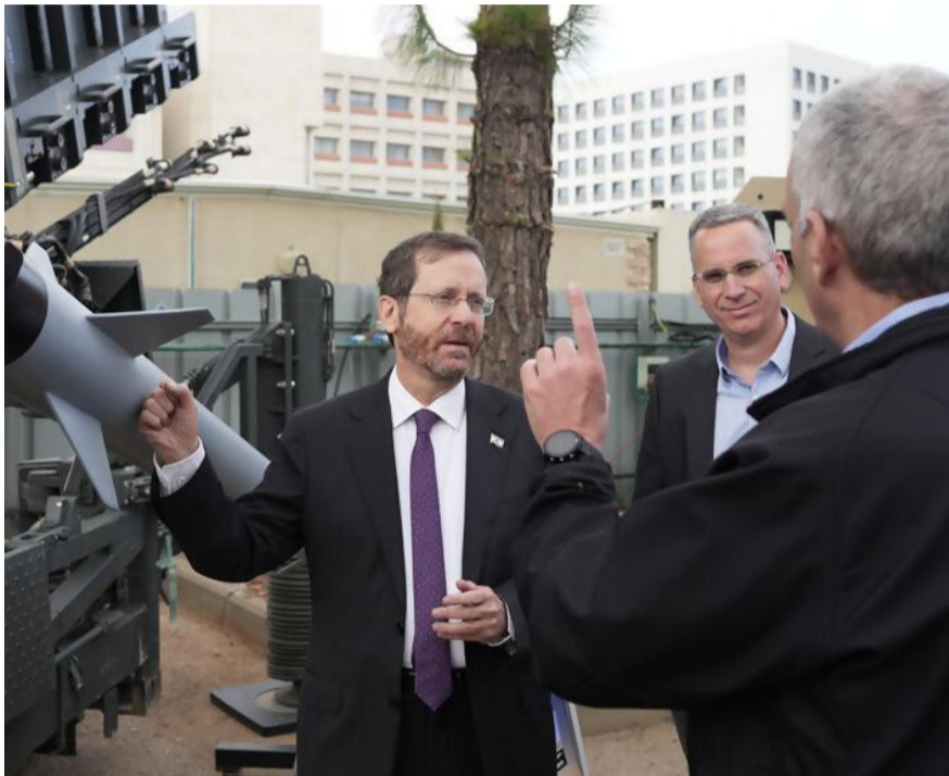
נשיא המדינה בביקור במפעל רפאל בצפון

בהתייעצות עם רבני העיר: תושבים חרדים מנוף הגליל יעברו לימודי הכשרה לקראת עבודה בתעשייה הביטחונית ב'רפאל'. חברת רפאל בשיתוף עיריית נוף הגליל, המכללה הטכנולוגית בעיר והעמותות "צורים" ו"מלאכתם" - יוצאות במיזם פורץ דרך בתחום העסקת גברים חרדים בתעשייה הביטחונית