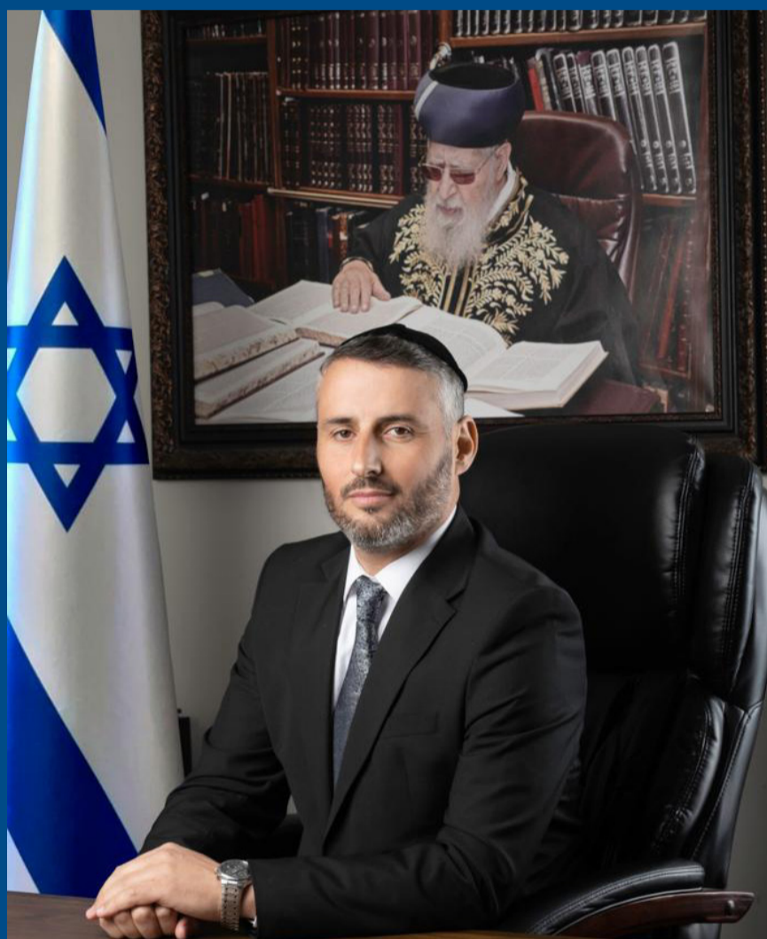
"הציבור החרדי היה מודר מהחלטות מרכזיות במשרד החינוך". השר ביטון

"בסופו של תהליך ארוך ומייגע, אפשר לומר שתלמיד במערכת החינוך החרדי לא יהיה מופלה מול תלמיד במערכת החינוך הרשמית", אומר השר חיים ביטון בראיון מיוחד ל"קו עיתונות" ומבטיח: "ב-2023 כל אברך יקבל על פניו כל השנה את מה שסוכם בהסכם הקואליציוני"