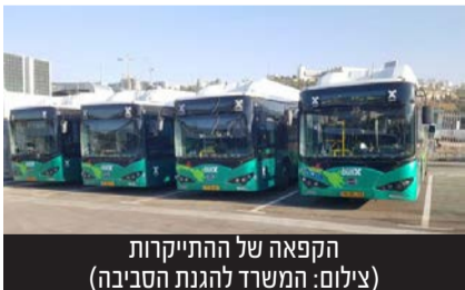
הקפאה של ההתייקרות

לאחר שהושג סיכום בין שרת התחבורה מירי רגב ושר האוצר בצלאל סמוטריץ', נחתם ביום שני השבוע הצו שימנע את ההתייקרות שתוכננה בשיעור של 12% בתעריפי התחבורה הציבורית למשך שנה שלמה