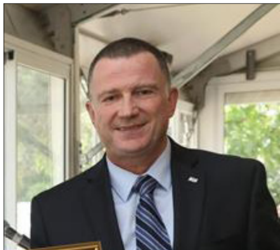
« מורד נאמן. יו"ר ועדת חו"ב ח"כ יולי אדלשטיין

גם בשלב זה צריך לומר: מרבית המשפטיים מעריכים עדיין שבג"ץ יימנע מהתנגשות חזיתית, ובמקום זאת הוא יבחר לאשר בדיעבד את החקיקה - ולצדף אליה ביקורת קטלנית באמירות אגב. הסיבה איננה מטעמים משפטיים, כמו שהיא נובעת משיקולים פוליטיים: חיות יודעת שהקריטיציזם הציבורי לביטול חוקי יסוד אינו גבוה, אפילו בקרב מתנגדי הרפורמה. היא תעדיף לשמור את הנשק ליום פקודה, אם וכאשר הכנסת תקדם חקיקה שבאמת תפריע לה, כמו שינוי הרכב הועדה למינוי שופטים, או החלשת מעמדם של היועמ"שים