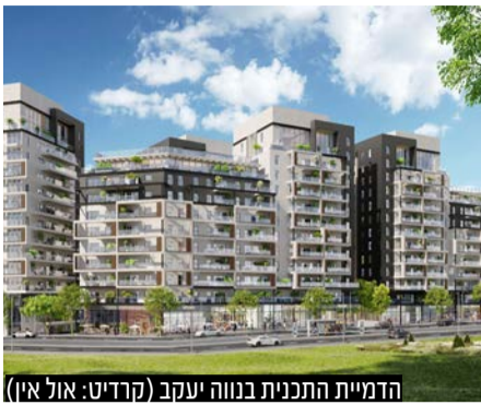
הדמיית התכנית בנווה יעקב (קהל: אול איו)

רוטשטיין וחברת טרא - Terra יקימו כ-5,000 דירות בפרויקט התחדשות עירונית בירושלים • מדובר במגה פרויקט של החברות, הכולל 521 דירות חדשות, הוכרז כמתחם במסלול מיסוי; היקף ההכנסות הצפוי מהפרויקט הינו כ-765 מיליון שקל