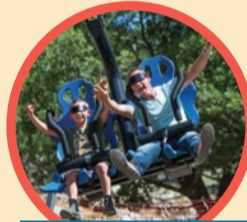
SKY RIDER VR