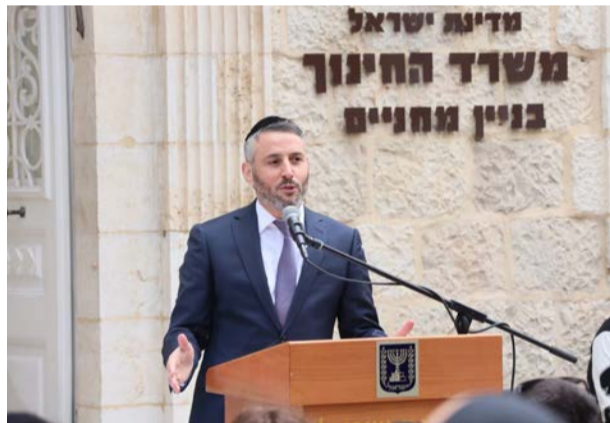
נושא דברים בטקס כניסתו לתפקיד

שונים ומורכבים. זה תלוי בהסכמים על גבי הסכמים, ולא הכל זה שחור ולבן. הציבור אינו מודע לכך, קח לדוגמה את בתי הספר היסודיים, מלבד בסיס התקציב יש 104 סלים שונים לתקצוב תלמיד ולכל סל יש קריטריונים ופרמטרים שונים זה מזה. מעטים האנשים, כולל עובדי משרד החינוך, שבקיאם בכל הפרמטרים של כל סלי התקצוב.