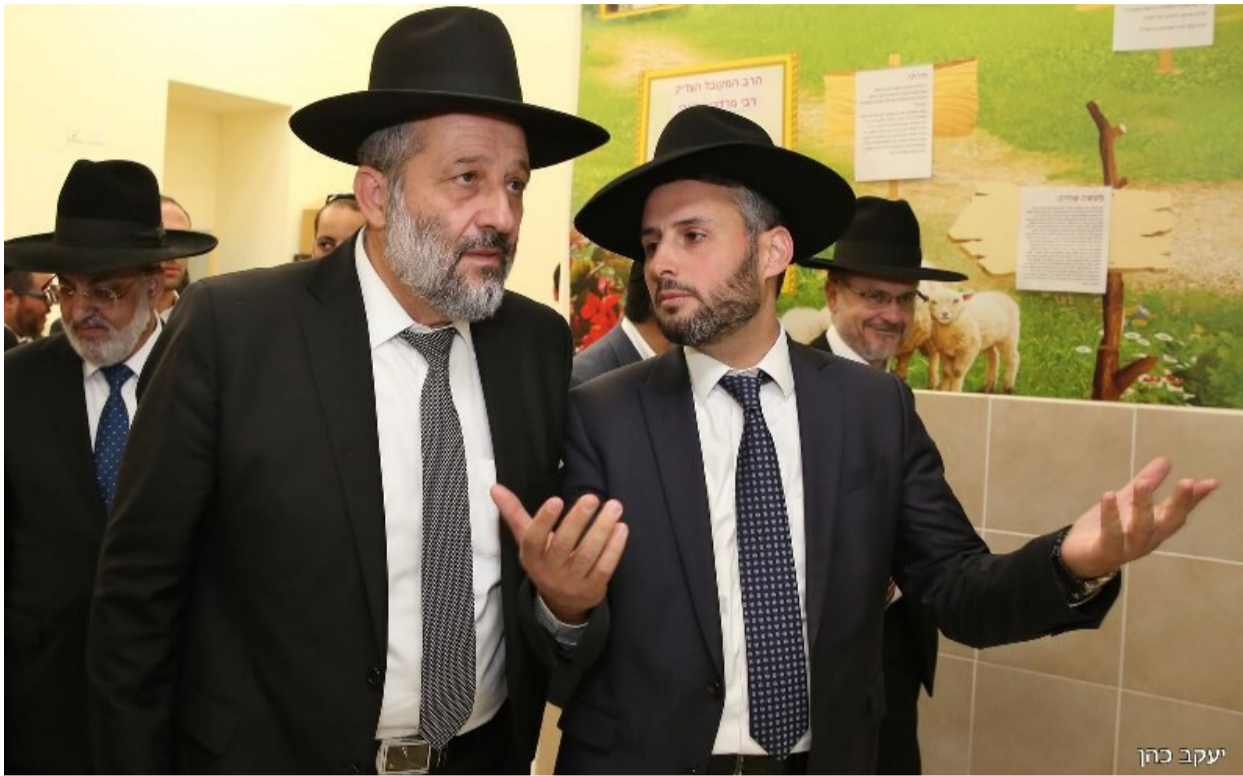
השר חיים ביטון עם יו"ר ש"ס אריה דרעי