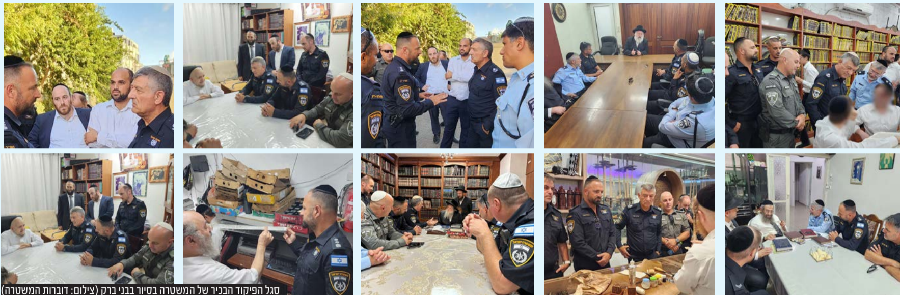
סגל הפיקוד הבכיר של המשטרה בסיור בבני ברק

מפקד מחוז תל אביב, מפקד מרחב דן ומפקד תחנת בני ברק הגיעו לביקור אצל רבני העיר בבני ברק לקראת ראש השנה וחודש החגים