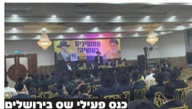
כנס פעילי ש"ס בירושלים

מובילים בעשייה: מאות פעילי תנועת ש"ס התכנסו לאור המהפכה האדירה שחוללה התנועה בירושלים בכל השכונות והמגזרים