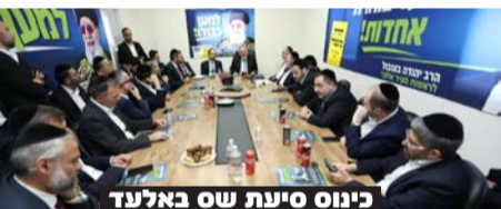
כינוס סיעת ש"ס באלעד

בראשות יו"ר ש"ס ח"כ אריה דרעי התכנסו שרי וחברי הכנסת של תנועת ש"ס לישיבת סיעה מיוחדת בעיר אלעד • דרעי עצמו מתכוון להוביל את ניהול המטה באומרו על הרב בוטבול כי הוא "יוביל לאחדות בין כולם"