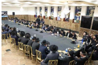
כנס הגבאים של בני תורה