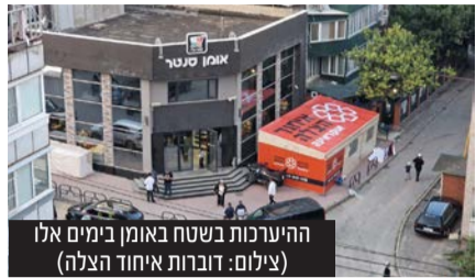
ההיערכות בשטח באומן בימים אלו