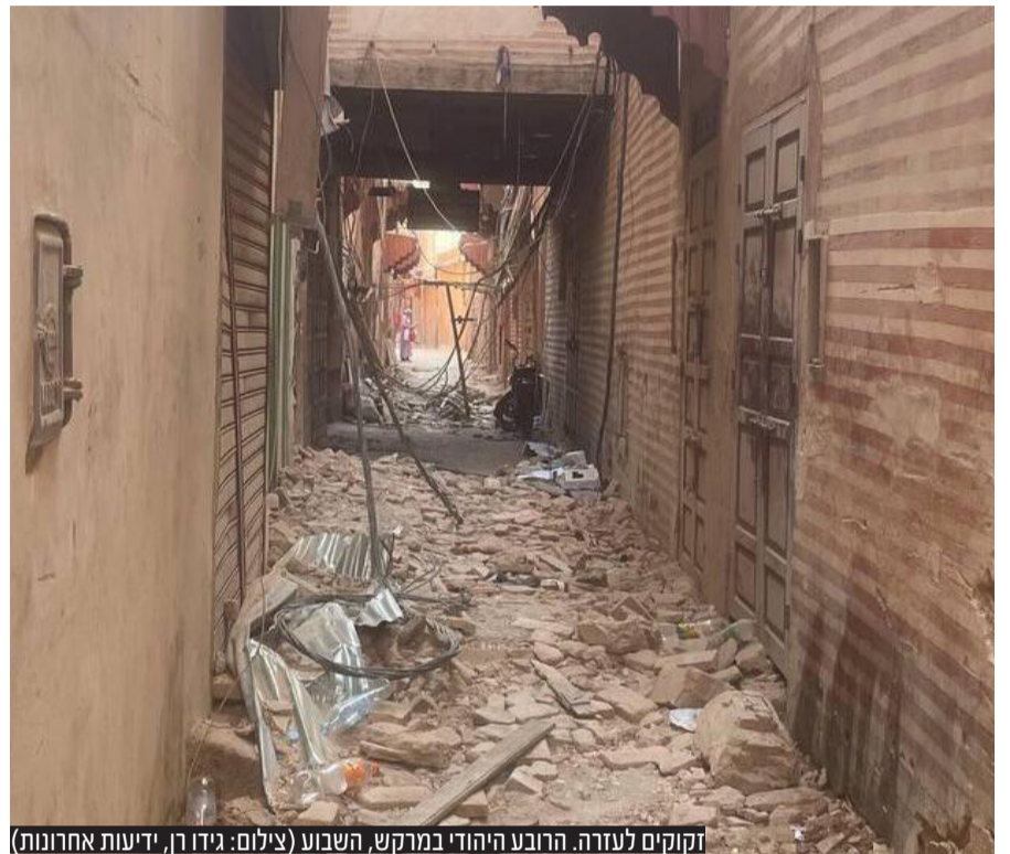
זקוקים לעזרה. הרובע היהודי במרקש, השבוע

התאומים שאירע בארה"ב. עד היום אנשים זוכרים את ענני האבק העצומים שנגלו לעיניהם". לדבריו, מדובר במוות אכזרי למדי. "התחושה היא ממש של חנק. בעוד שכמות קטנה של אבק לרוב לא גורמת למוות, ברגע שנושמים כמות גדולה שלו נוצר כשל נשימתי. אגב, גם פצועים מרעידות אדמה לרוב סובלים מבעיות נשימה בעקבות שאיפת אבק". "באבק יש הרבה מאוד חלקיקים מזהמים, אלה נכנסים לריאות ולא משאירים מקום לאוויר נקי להיכנס", מוסיף פרופ' אמיר און, מנהל ריאות שיבא בה"ח תל השומר. "מבחינה בריאותית, הריאות שלנו הן מערכת שבה הגזים נכנסים לגוף. יש שם ממברנות עדינות שדרכן נעשה מעבר הגזים, ואם הוא נסתם או נפגע זה מייצר בעיה של כניסת גזים חיוניים. חלקיקי האבק עצמו עושים נזק מיידי כי יש בהם חומרים מסוכנים שהאדם שואף". צוותי חילוץ בינלאומיים האשימו את ממשלת מרוקו כי היא חוסמת משלחות סיועו מקשה על מאמצי חילוץ הנפגעים ברעידת האדמה הקטלנית במדינה. העיתון האמריקני "ניו יורק טיימס" דיווח כי כמה משלחות הצליחו להגיע ולפעול במדינה מוכת האסון, אך רבות אחרות נותרו בחוץ. ארנו פרה, מייסד ארגון "מחלצים ללא גבולות" אמר לתחנת רדיו מרכזית בצרפת כי "הממשלה המרוקאית חוסמת לחלוטין צוותי חילוץ והצלה. אנחנו לא מבינים את ההתנהלות הזו". עד כה נחתה במדינה משלחת אחת מקטאר אך משלחות מתוניסיה, אלג'יריה, ישראל וערב הסעודית טרם קיבלו אישור להיכנס לשטחה של המדינה.