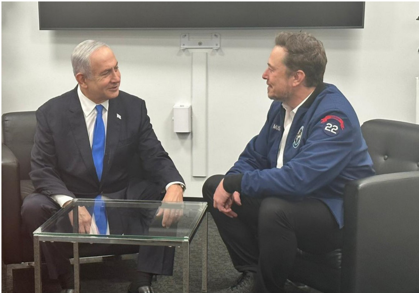
ראש הממשלה נתניהו עם המילארדר אילון מאסק