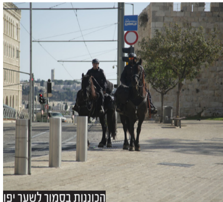
הכוננות בסמוך לשער יפו