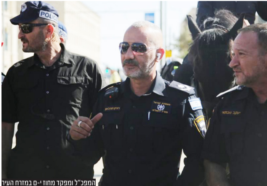
המפכ"ל ומפקד מחוז י-ם במזרח העיר

במרכז ההתרעות לפיגועים: ירושלים ואיו"ש. במשטרה שמים דגש על קו התפר ומנסים למנוע כניסה של שוהים בלתי-חוקיים לצד סריקות ברחבי הערים השונות לאיתורם. כחלק מההיערכות מנסים לסגור את הפרצות בקו התפר דרכו מדי יום מאות תושבי השטחים חודרים לישראל עם אישורי עבודה וגם בלי אישורים.