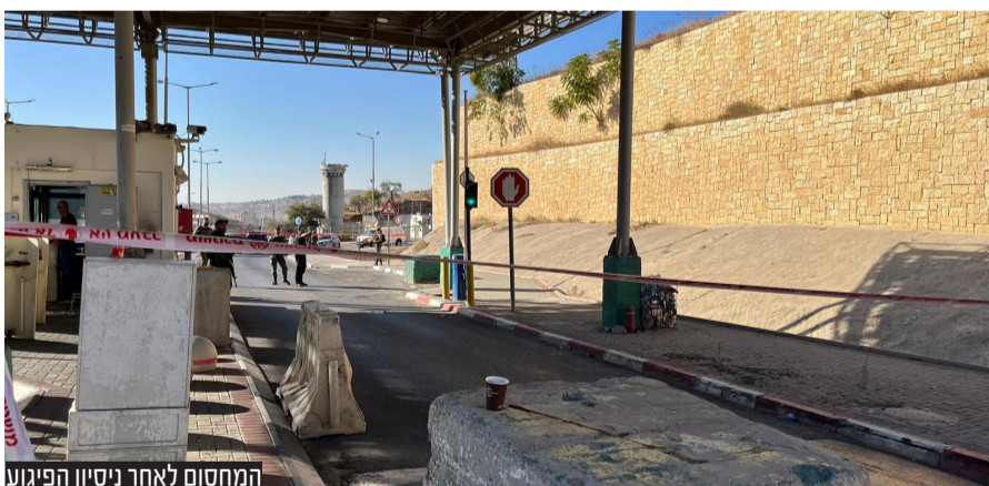
המחסום לאחר ניסיון הפיגוע

בכיר במשטרה אמר כי יש "עשרות התרעות לפיגועים". הוא ציין כי "המשטרה תמשיך בכוננות הגבוה ביותר בירושלים וברחבי הארץ. ראינו בערב החג את המוטיבציה להוציא פיגועים בתחומי ישראל. הנחת העבודה שלנו שינסו לפגוע בתחושת הביטחון ומי שרוצה להרוס את החג, גם אם כשל בערב ראש השנה, עוד ינסה להוציא פיגועים".