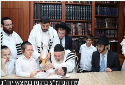
מרן הגרמ"צ ברגמן במוצאי יום"ס

המונים יפקדו את מעונו של זקן חברי מועצת גדולי התורה מרן הגרמ"צ ברגמן שליט"א בימי חול המועד סוכות, להקבלת פני רבו ברגל ולברכת המועד