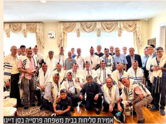
אמירת סליחות בבית משפחה פרטייה בסן דייגו

מוסדות התורה והחסד "תפארת רפאל" מיסודו של הגאון הגדול מרן הגר"ע יוסף זצוק"ל ובנשיאותו והדרכתו של הראשון לציון הרה"ר לישאל הגר"י יוסף שליט"א, מציינים בסיפוק רב את סיום חודש 'ירח האיתנים', שכולו היה גדוש עצרות תפילה והתעוררות בימי הרחמים והסליחות.