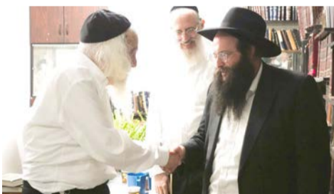
נציג בני תורה באשדוד מקבל את ברכת הגר"א דויטש

לראשונה מתמודדים בפלג הירושלמי בערים נוספות, שבהן לא התמודדו בעבר • בחלק מהערים נציגי 'בני תורה' שולבו ברשימות חרדיות המתמודדות למועצת העיר