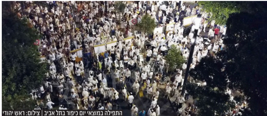
התפילה במוצאי יום כיפור בתל אביב

יצויין כי במקום החלו להתפתח עימותים בין המתפללים למפגינים הקיצוניים, המשטרה שהייתה במקום בחרה שלא להתערב, כך גם עיריית תל אביב, למרות גיבוי מקומם שהעניקו ראש העיר רון חולדאי ויו"ר האופוזיציה יאיר לפיד למפגינים. עם זאת, חרף הציפיות ממנו, יו"ר 'כחול לבן' בני גנץ נמנע מלגנות את המתפרעים.