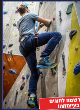
ההרשמה לחוגים בעיצומה!

בואו לטפס בקיר טיפוס הגבוה ביותר בירושלים!