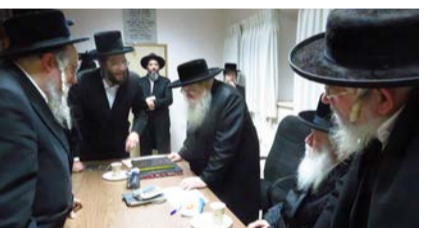
בביקור אצל גדולי ישראל

המומחה למאבק במיסיון: "בסייעתא דשמיא - אפילו מיסיונרים בכירים ממוצא יהודי באמריקה - חזרו בתשובה"