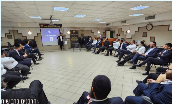
הרבנים ברב שיח

מלאכה קשה שבמקדש, והיא דורשת הצטיידות בכלים חדשים ומעודכנים.