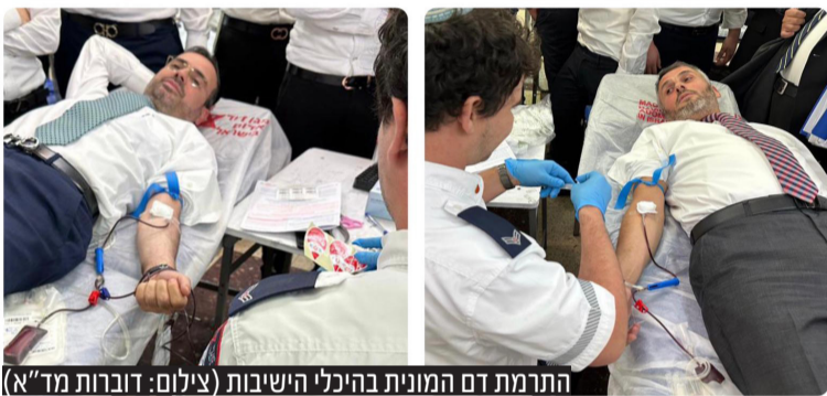
התרמת דם המוניות בהיכלי הישיבות

דם ומרכיביו והצלחת חייהם". השר הרב חיים ביטון: "קשר הדם שלנו כעם יהודי בא לידי ביטוי בהירתמות ובעזרה ההדדית בעתות מצוקה, כמו מיזמים שונים בחברה הישראלית שאנו רואים מאז האסון הנורא, כאשר כל צד דואג לשני. בימים קשים אלו חובה על כל אחד מאתנו להטות שכב". שר הבריאות הרב אוריאל בוסו: "מרגש לראות את מבצע שירותי הדם של מד"א שמקים מוקדים של התרמות דם בכל רחבי הארץ ומעניק לציבור את ההזדמנות לתת ולהיות שותף במאמץ הלאומי. מאז פרוץ המלחמה אנו נחשפים יום יום למיזמי התנדבות ותרומה לקהילה של העם המיוחד שלנו. תרומת דם מהווה חלק בלתי נפרד מעוצמתה של מערכת הבריאות ומסייעת לצוותים הרפואיים להציל חיים".