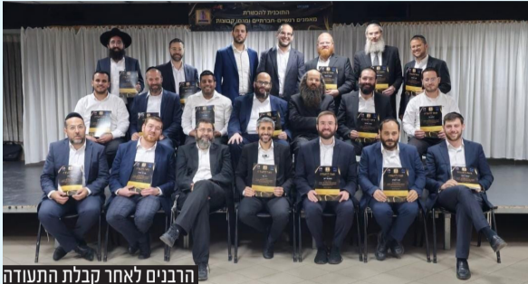
הרבנים לאחר קבלת התעודות