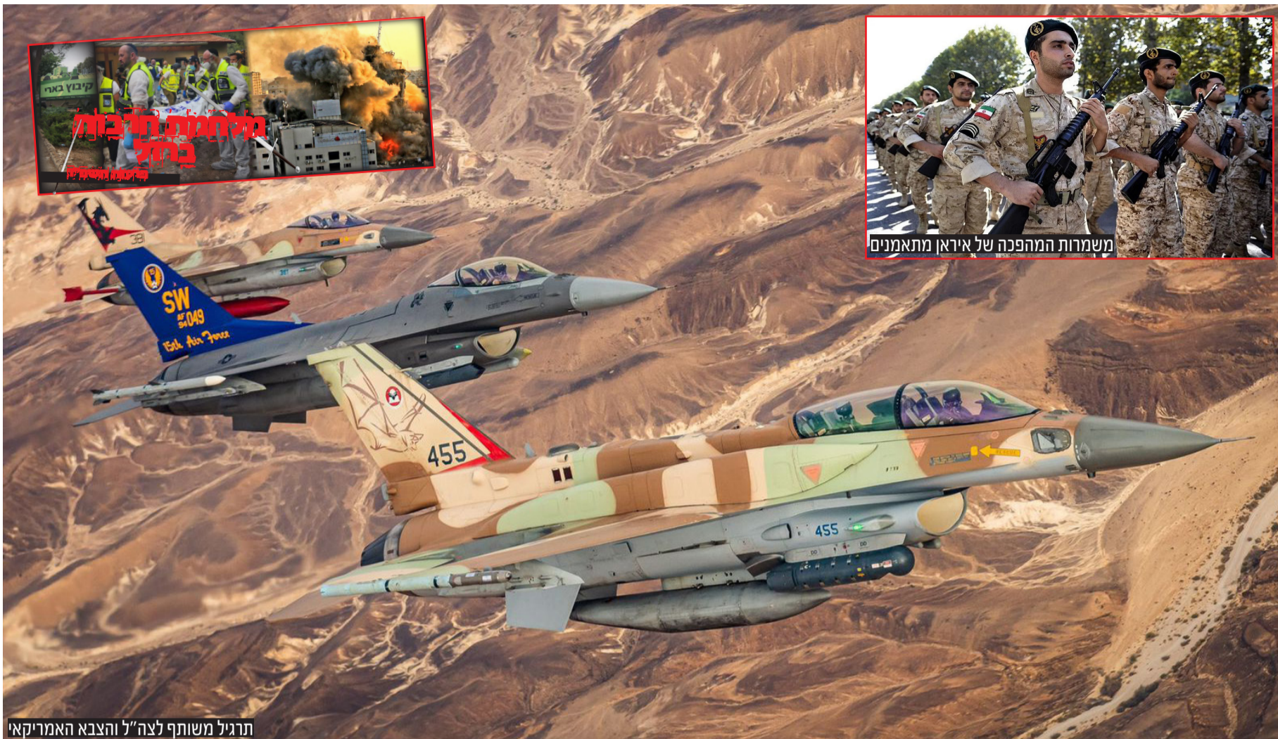
תרגיל משותף לצה"ל והצבא האמריקאי